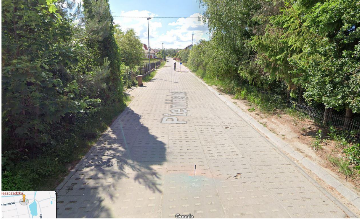
Widok w kierunku ul. Bieszczadzkiej (po prawej)