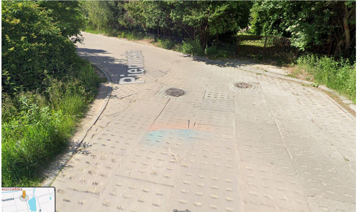
Zakręt z ograniczoną widocznością w obu kierunkach.