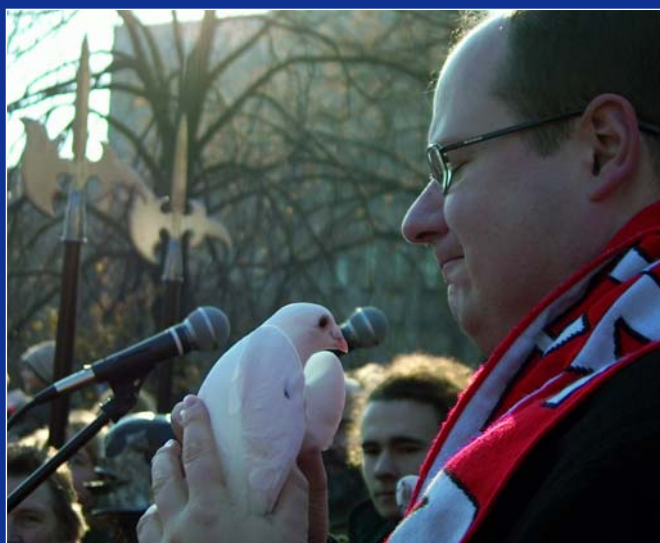
„Pocałować, nie pocałować...?”

gdzie za 12 euro kobiety robiące zakupy mogą zostawić męża. W przechowalni jest bar (dwa piwa w cenie wstępu), restauracja, i telewizja. Od nowego roku w przechowalniach będą organizowane szybkie kursy przyrządzania drinków i tor na gokarty.