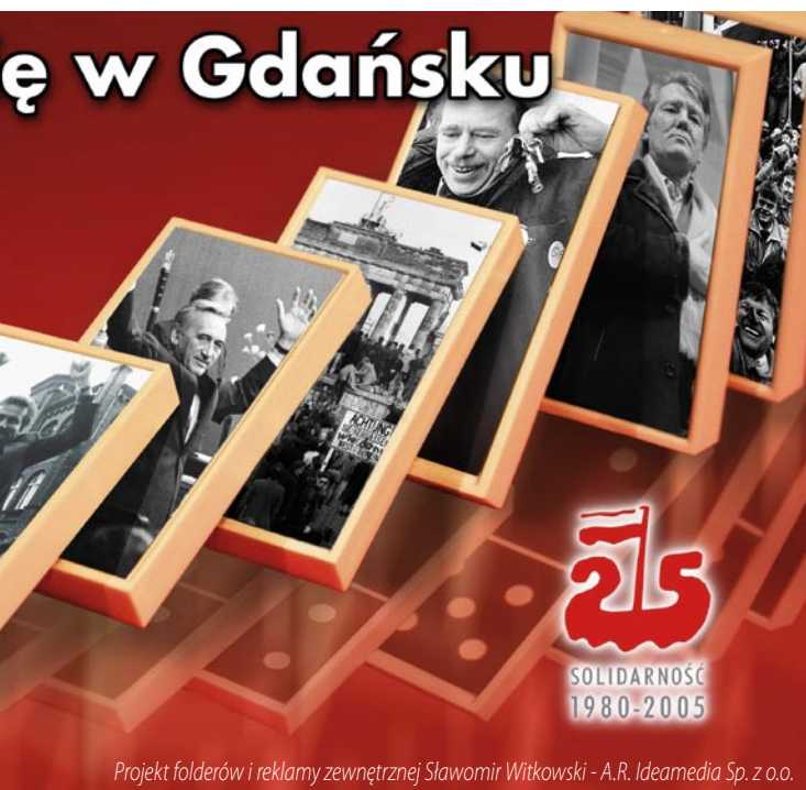
Projekt folderów i reklamy zewnętrznej Sławomir Witkowski - A.R. Ideamedia Sp. z o.o.

Na tym nie koniec. Organizatorzy Kampani przewidują także druk plakatów, przedstawiających słynne już „kostki domina” w wersji polskiej, angielskiej, francuskiej, hiszpańskiej. Pojawią się dodatkowe reklamy w gazetach zagranicznych. Na ulicach „stolicy Europy”, Brukseli, też nie zabraknie polskich akcentów – będzie można tam zobaczyć ponad sto citylightów. Do czytelników „Rzeczpospolitej” z pewnością dotrze specjalnie przygotowany dodatek. Wydział