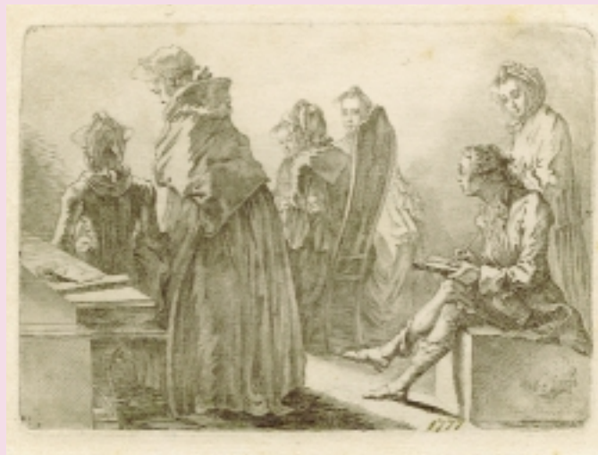
Muzeum Narodowe Gdańsk

Maria Spigarska (Muzeum Narodowe w Gdańsku)