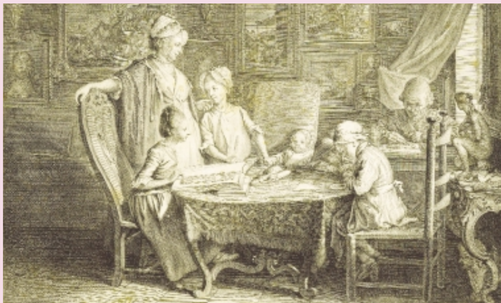
Muzeum Narodowe Gdańsk

Po pierwszych niepowodzeniach sukcesem zarówno wśród odbiorców, jak krytyki, okazało się podjęcie elektryzującego ówczesną Europę tematu, który dotyczył wyroku na Jeana Calasa, pro-