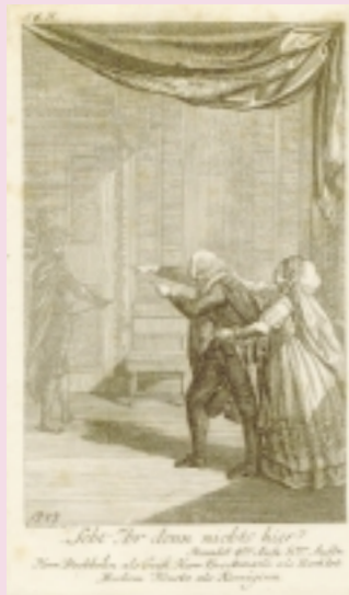
Muzeum Narodowe Gdańsk

domeną Daniela Chodowieckiego stała się książka: słowo wzbogacone ilustracjami niepomierne zyskiwało na atrakcyjności. Wydawcy masowo powstających kalendarzy, stanowiących ważny element ówczesnej kultury, almanachów upowszechniających wiedzę oraz literatury pięknej, jak i naukowej, uznali w Chodowieckim idealnego ilustratora. Doskonale mieszcząc się w narzuconym, charakterystycznym formacie, potrafił swym miniaturowym kompozycjom nadać wyraz, odpowiadający duchowi ilustrowanych sytuacji. Zwięzłość w charakteryzowaniu sytuacji świadczy o żywej świadomości otaczającego świata. Ilustracje z zakresu różnych dziedzin nauki i różnych obszarów aktywności człowieka dowodzą, że ich autor był osobą czytanną i świadomą podejmowanych tematów. W akwafortce, którą obrał jako najdoskonalsze dla siebie narzędzie wyrazu, osiągnął wyżyny precyzji. Gęstwiną drobnych, precyzyjnie prowadzonych linii potrafił oddać brylowatość przedmiotów, ekspresję ruchu, walory światła i cienia, perspektywę.