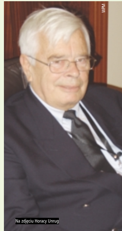
Na zdjęciu Horacy Unrug