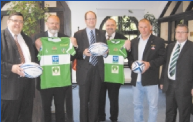
Saur Neptun Gdańsk

Saur Neptun Gdańsk i Zakład Utylizacyjny w Gdańsku podpisały umowy sponsorskie z Rugby Club Lechia. Obie firmy zasilą budżet drużyny łączną kwotą 100 tysięcy złotych. To efekt długofalowej polityki wspierania gdańskiej piłki przez obie spółki.