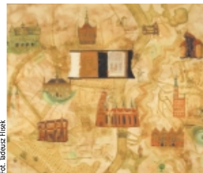
Fot. Tadeusz Flisek

tejszej Rady Miasta. Oba zdjęcia do tekstu wykonał Tadeusz Flisek.