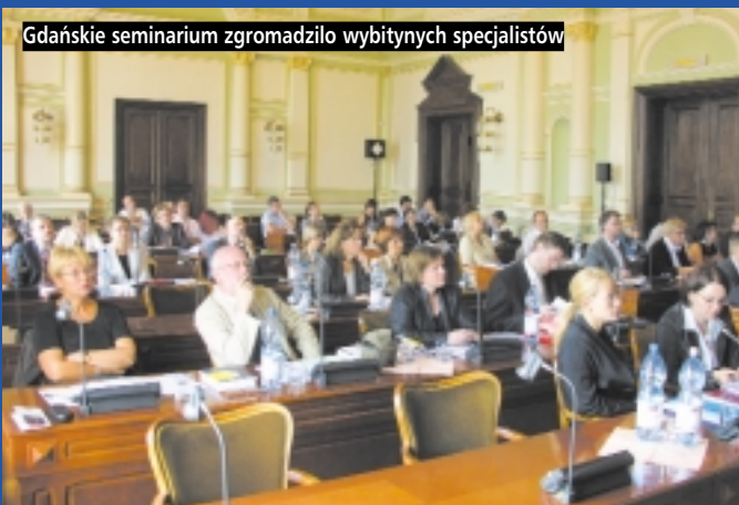
Gdańskie seminarium zgromadziło wybitnych specjalistów