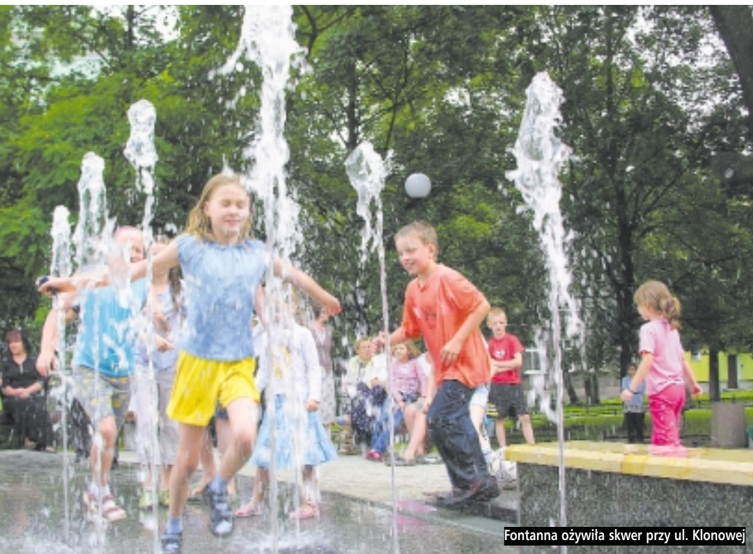
Fontanna ożywiła skwer przy ul. Klonowej

Wrzeszcz wzbogacił się o kolejną fontannę. Znajduje się ona na zieleńcu przy Alei Grunwaldzkiej, w niedalekim sąsiedztwie Hotelu Szydłowski. To już trzeci wodotrysk, który znalazł swoje miejsce w tej dzielnicy Gdańska, a siódmy na terenie całego miasta.