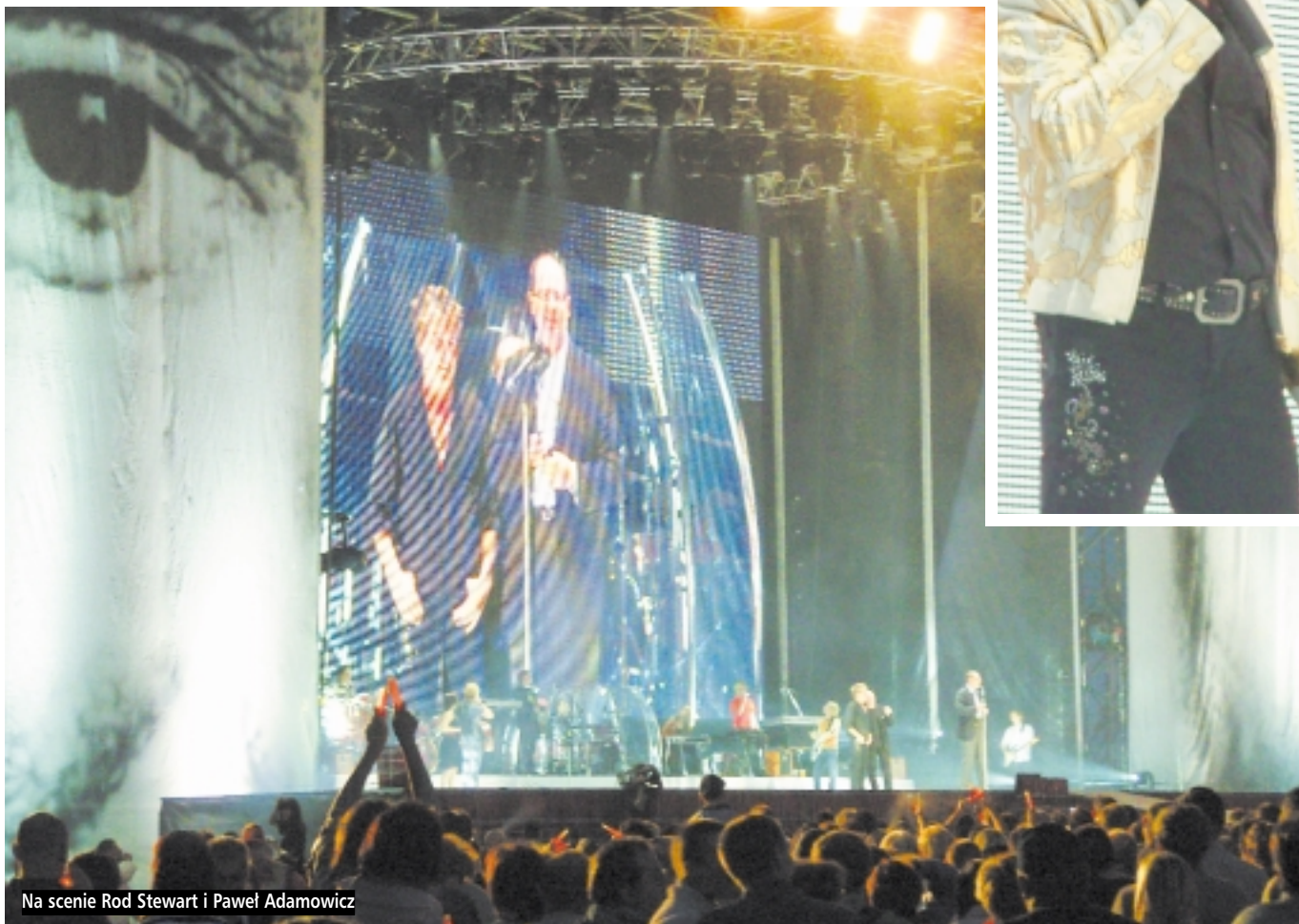
Na scenie Rod Stewart i Paweł Adamowicz

Koncert zgromadził ponad 35 tysięcy fanów z Polski i zagranicy. Rod Stewart wykonał wszystkie swoje największe przeboje, takie jak „Da Ya Think I'm Sexy” czy „Sailing”. Podczas dwugodzinnego występu artysta udowodnił, iż mimo tego, że młodość ma już za sobą, ciągle potrafi zaczarować słuchaczy swoją sceniczną energią. Wciągnął publiczność do wspólnej zabawy wykonując w mistrzowski sposób ponad 30 utworów. W trakcie występu słynny Szkot wykopywał w kierunku publiczności piłki opatrzone logo Solidarności oraz jego autografem. Na koniec czekała na zgromadzonych jeszcze jedna atrakcja. Za sceną i nad głowami fanów i rozbłyły setki fajerwerków wypełniając całe niebo.