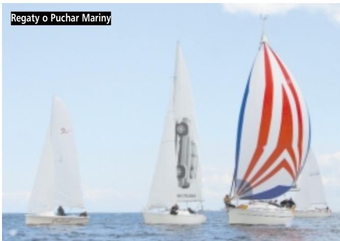
Regaty o Puchar Mariny

Po raz pierwszy rozegrane zostały żeglarskie Regaty o Puchar Mariny oraz Motorowodne Mistrzostwa Polski Skuterów Wodnych. Miejscem rozgrywania rywalizacji zarówno jachtów jak i skuterów był akwen w rejonie molo w Gdańsku-Brzeźnie. Dzięki temu licznie przybyli widzowie mogli śledzić zmagania zawodników i z molo, i z plaży.