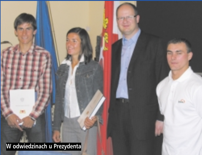
W odwiedzinach u Prezydenta

Prezydent uhonorował sportowców, którzy wyróżnili się wybitnymi osiągnięciami w ostatnich miesiącach. Pula nagród wynosiła 12 tys. złotych, prócz tego zawodnicy otrzymali pamiątkowe listy gratulacyjne i albumy.