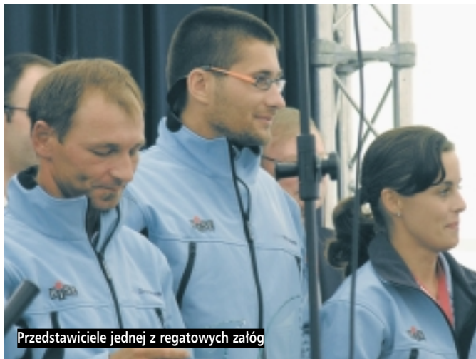
Przedstawiciele jednej z regatowych załóg

Przez kilka ostatnich dni lipca żeglarze z całej Europy odwiedzali Gdańsk. Okazją były dwie duże żeglarskie imprezy – morski festiwal Baltic Sail oraz regaty Baltic Sprint Cup.