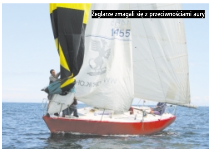
Żeglarze zmagali się z przeciwnościami aury

nych, które po raz pierwszy zorganizowane zostały na akwenie morskim. Publiczność mogła podziwiać niesamowitą szybkość i wspaniałe ewolucje najlepszych zawodników z Polski i zagranicy. Moc najszybszych maszyn wynosiła ok. 260 KM! Trasa przejazdu została zaplanowana tak, by oglądanie rywalizacji zapewniło każdemu z wi-