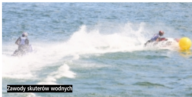
Zawody skuterów wodnych

W miniony weekend Marina Gdańsk świętowała dziesiąty jubileusz swojej działalności. Z tej okazji Miejski Ośrodek Sportu i Rekreacji w Gdańsku przygotował kilka niezwykle ciekawych i widowiskowych wydarzeń.