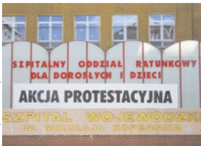
Jerzy Pinkas, Kancelaria Prezydenta

Z uwagi na trudną sytuację ekonomiczną szpitali oraz z troski o zdrowie mieszkańców prezydent Gdańska umorzył szpitalom działającym na terenie miasta zaległości od podatku od nieruchomości na łączną kwotę 2 348 897,06 zł. Udzielone ulgi w znaczący sposób przyczynią się do podwyższenia jakości usług medycznych oraz ich dostępności.