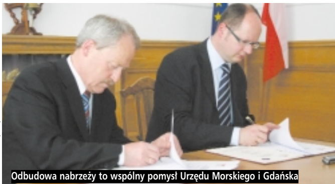
Odbudowa nabrzeży to wspólny pomysł Urzędu Morskiego i Gdańska

Miasto Gdańsk i Urząd Morski w Gdyni podpisały porozumienie dotyczące przebudowy i odbudowy gdańskich nabrzeży Motławy. To przygotowania do pozyskania na ten cel funduszy z unijnego Programu Operacyjnego Infrastruktura i Środowisko – wartość całego projektu przebudowy nabrzeży to 5,1 mln euro.