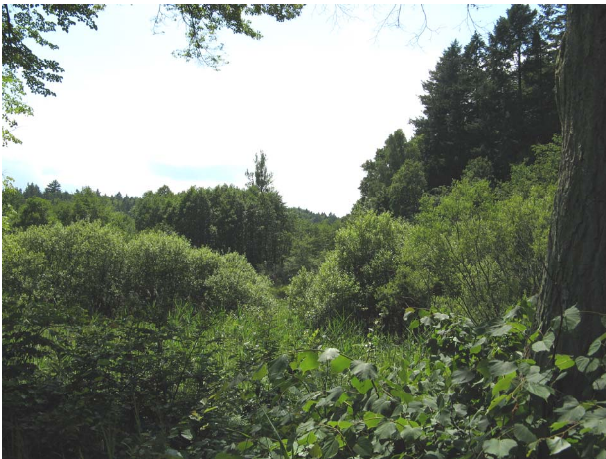
TPK. Dolina Radości.

Trójmiejski Park Krajobrazowy utworzony w 1979 roku jako drugi w województwie gdańskim i jeden z pierwszych w Polsce parków krajobrazowych. Przedmiot ochrony: specyficzna rzeźba terenu oraz szata roślinna, powierzchnia TPK w granicach Miasta Gdańska 2341,8 ha, a powierzchnia otuliny 2570,7 ha. Rozporządzenie Wojewody Gdańskiego z 8 listopada 1994 r. (Dz.Urz.Woj.Gdańskiego nr 27, poz. 139 z 1994 r.) szczegółowo określa przebieg granic parku oraz wprowadza zakazy, ograniczenia i obowiązki na terenie parku zgodnie z ustawą o ochronie przyrody.