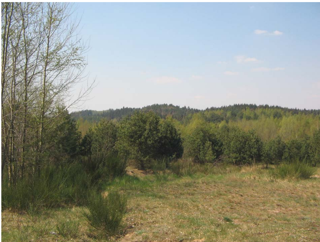
Zespół przyrodniczo-krajobrazowy „Dolina Strzyży”