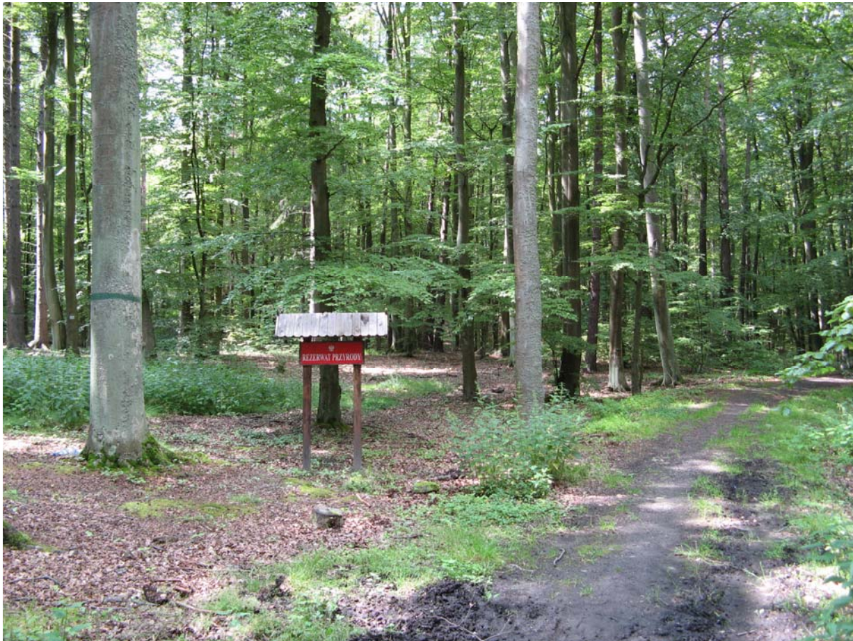
Rezerwat w TPK