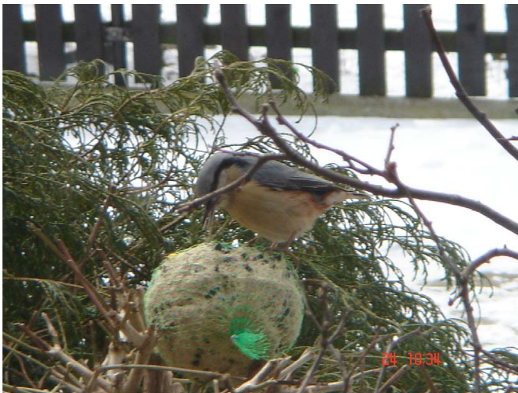
„Ptasia pyza” Kiełpino

16. Przeprowadzono akcję pn.: „Ptasia pyza” polegającą na dokarmianiu ptaków w okresie zimowym. Kule ziarna do zawieszenia na drzewach rozdawano głównie młodzieży szkolnej.