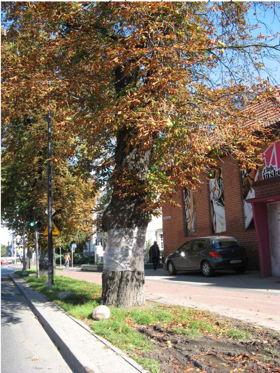
Opaska lepowa Wrzeszcz