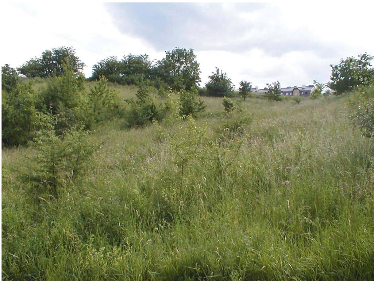
Zespół przyrodniczo-krajobrazowy „Dolina Potoku Oruńskiego”