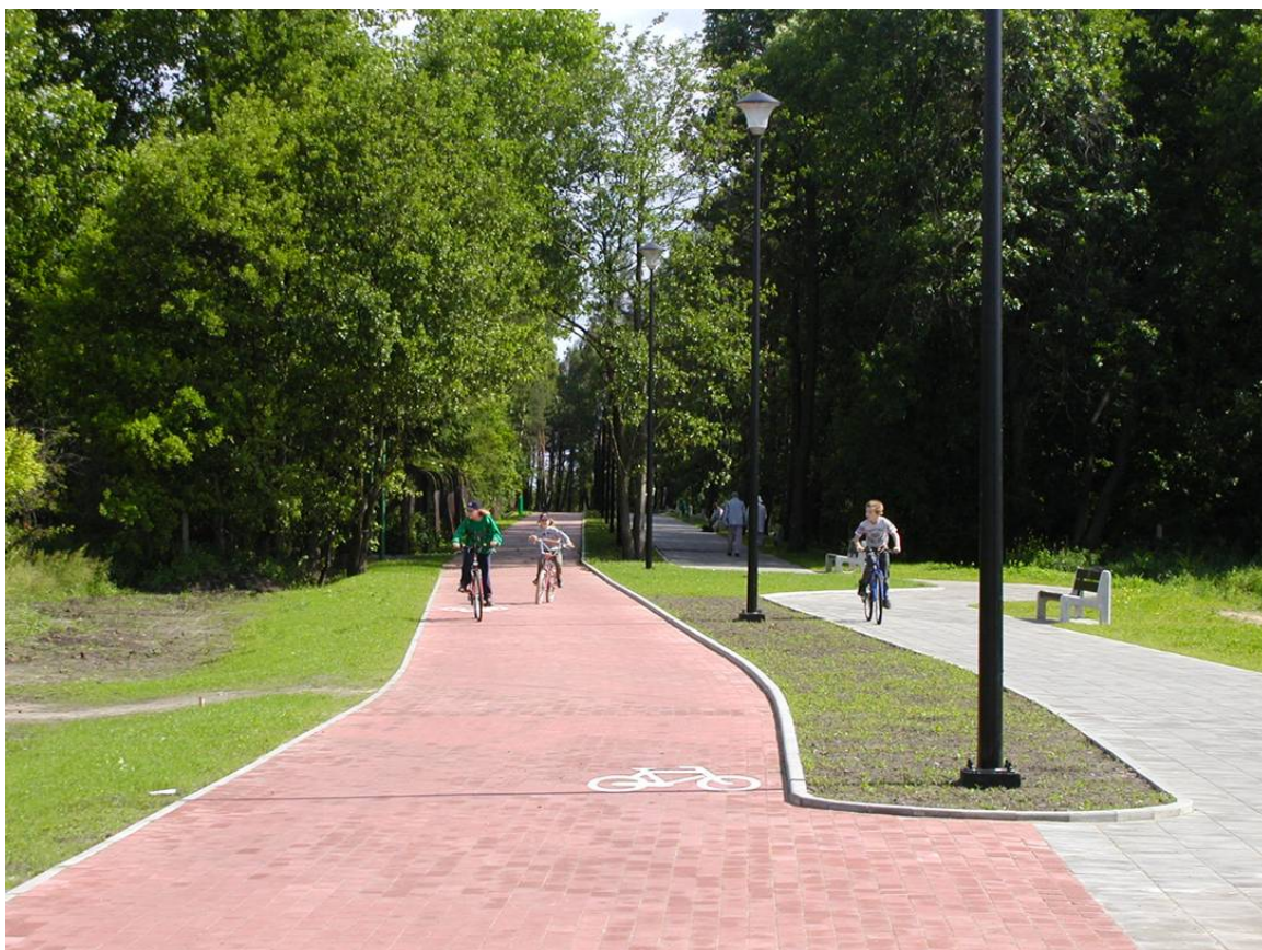
Ścieżka pieszo rowerowa w Parku Nadmorskim