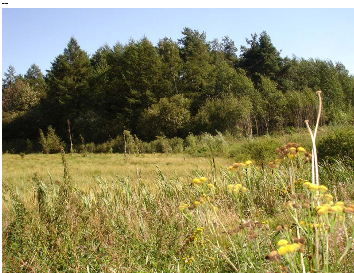
Użytek ekologiczny „Migowska Bielawa”