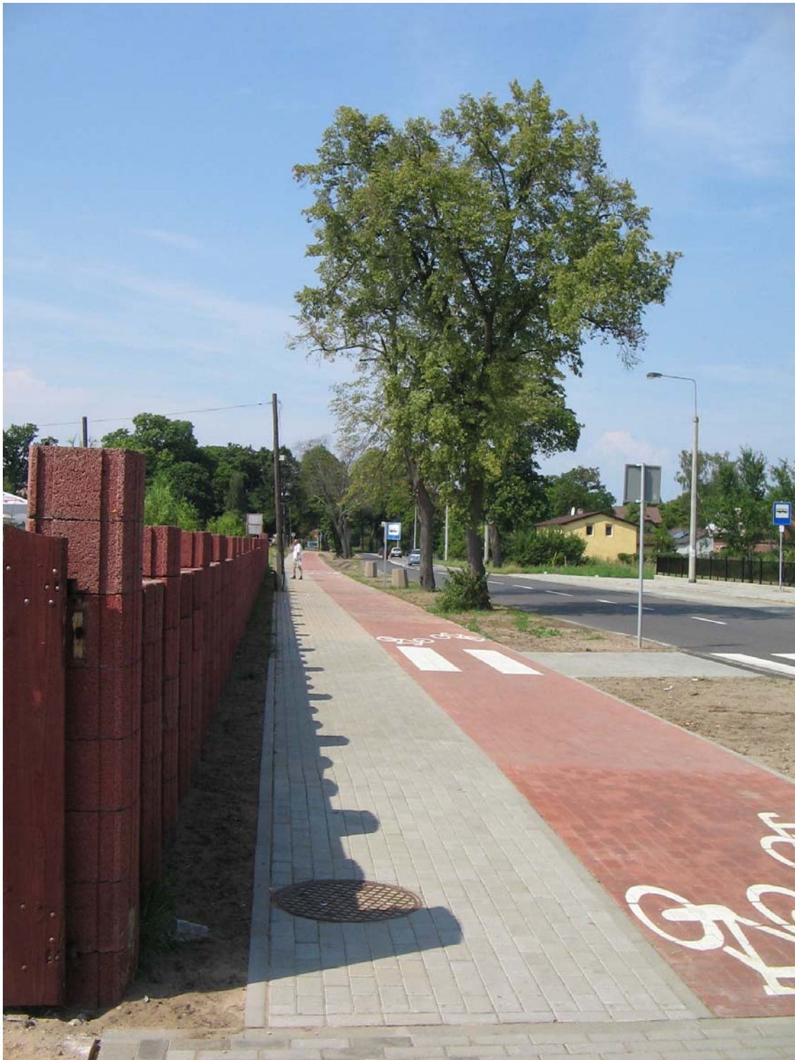
Ścieżka pieszo - rowerowa w rejonie Świbna