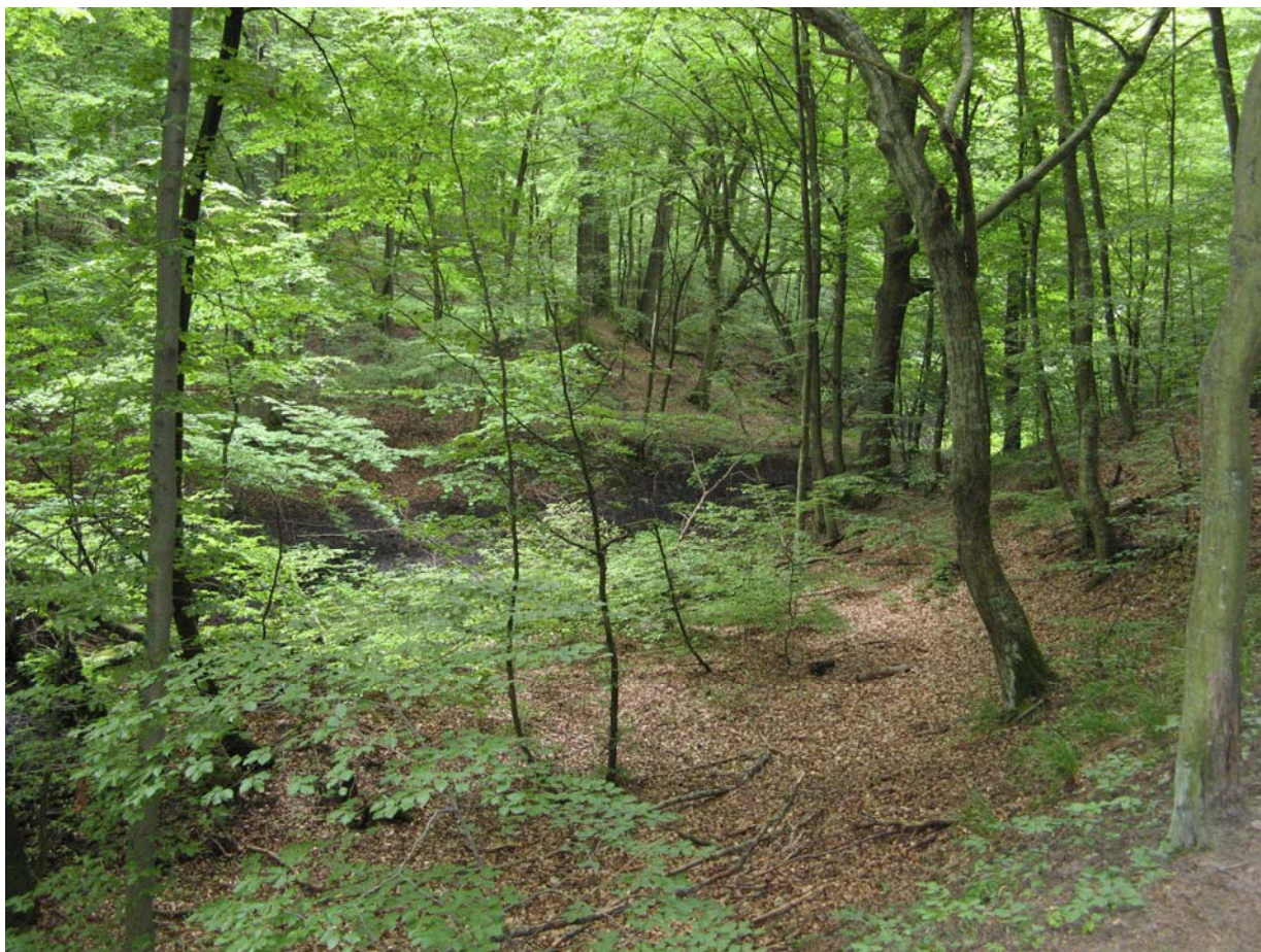
Rezerwat „Wąwóz Huzarów” TPK