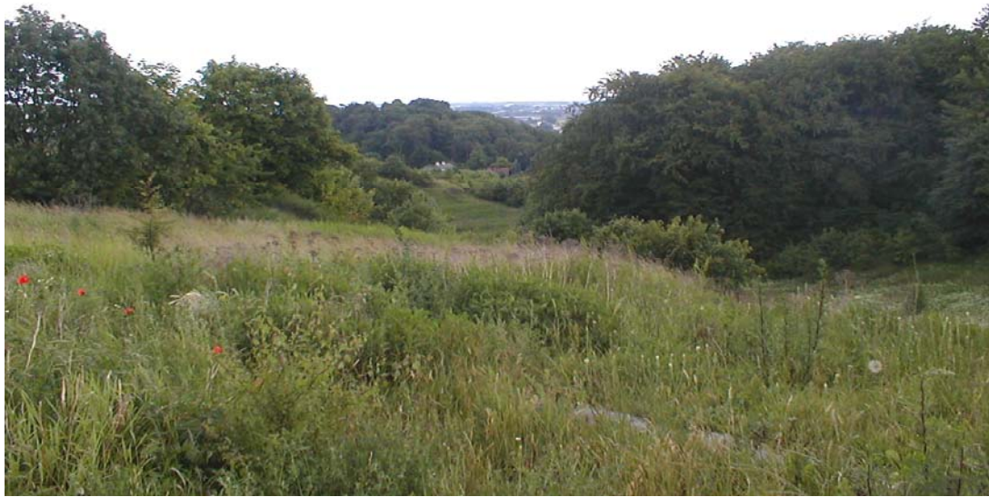
„Murawy kserotermiczne” w „Dolinie Potoku Oruńskiego”