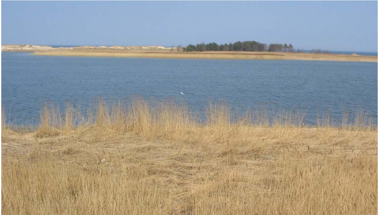
„Ptasi Raj”. Wyspa Sobieszewska.