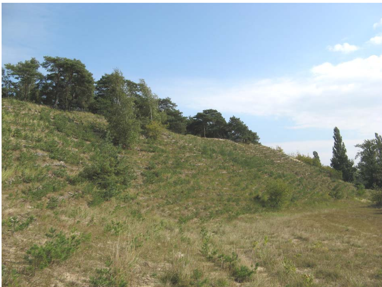
Uprawa leśna na południowym stoku wydmy. Górki Zachodnie