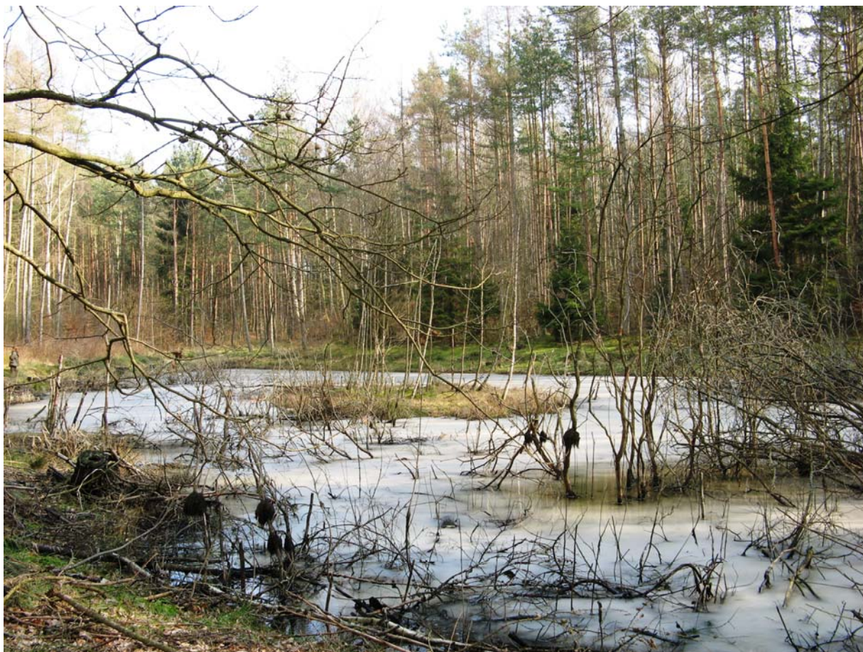
Otomiński Obszar Chronionego Krajobrazu.