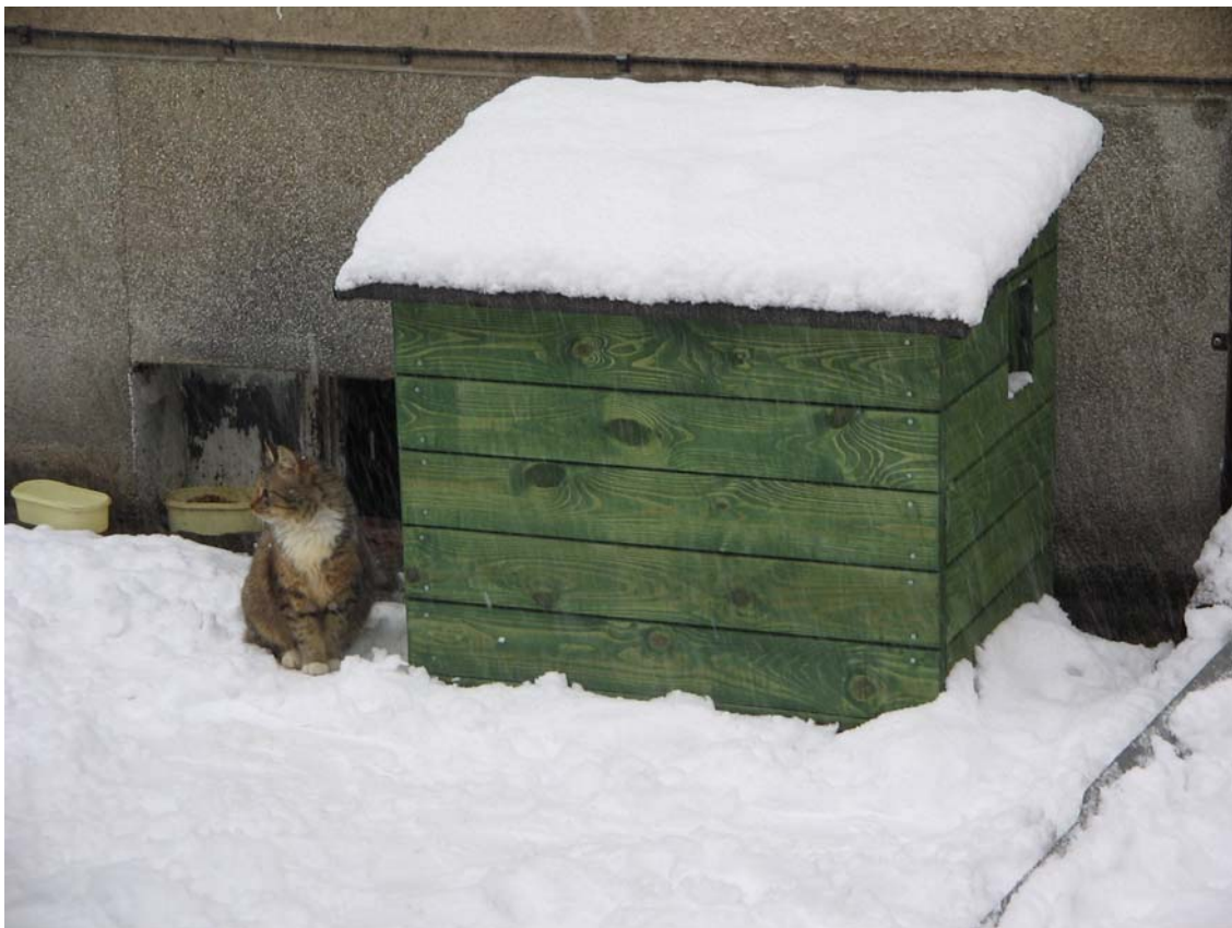
Oliwa. Koci domek

W związku z apelami mieszkańców Gdańska w sprawie pomocy bezdomnym kotom, z budżetu miasta zakupiono 57 domków dla kotów. Domki przekazano nieodpłatnie za pośrednictwem Gdańskiego Zarządu Nieruchomości Komunalnych w Gdańsku we współpracy z Wydziałem Gospodarki Komunalnej, Gdańskim Zarządem Nieruchomości Komunalnych, Powiatowym Lekarzem Weterynarii, Towarzystwami Opieki nad Zwierzętami. Za utrzymanie budek odpowiedzialny jest administrator osiedla oraz osoby opiekujące się kotami. Ponadto Wydział Gospodarki Komunalnej realizuje program sterylizacji kotów.