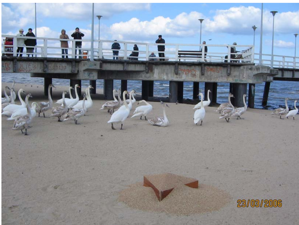
Dokarmianie łabędzi. Brzeźno

W ramach akcji zimowego dokarmiania ptaków przeprowadzono również dokarmianie ptactwa wodnego w pasie Nadmorskim.