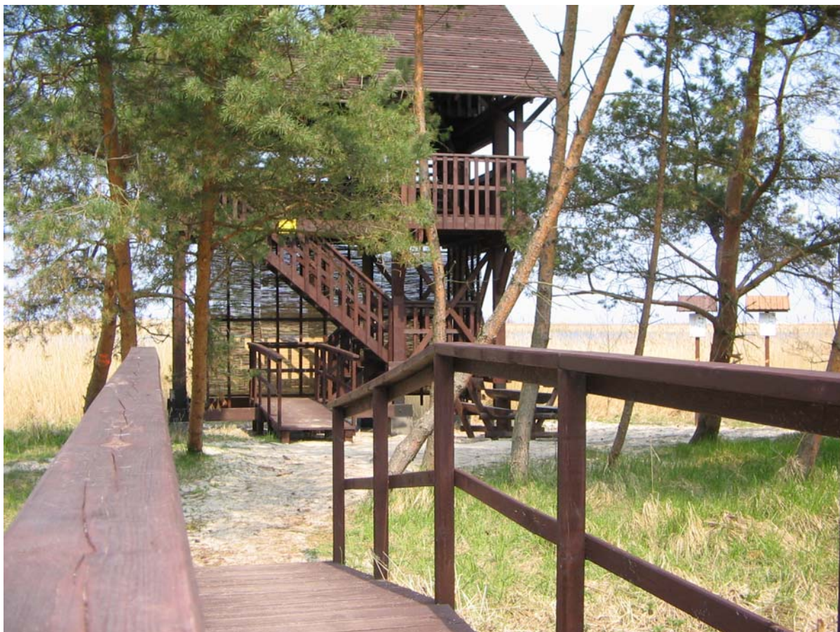
Wieża widokowa na Wyspie Sobieszewskiej.