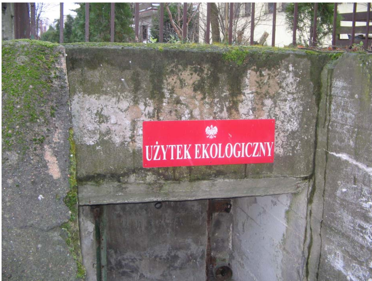
Użytek „Oliwskie Nocki” wejście do bunkra