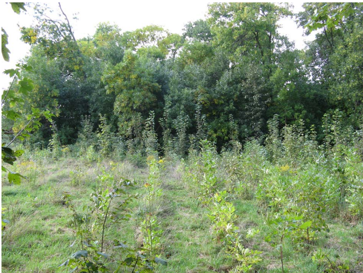
Uprawa leśna w Pasie Nadmorskim