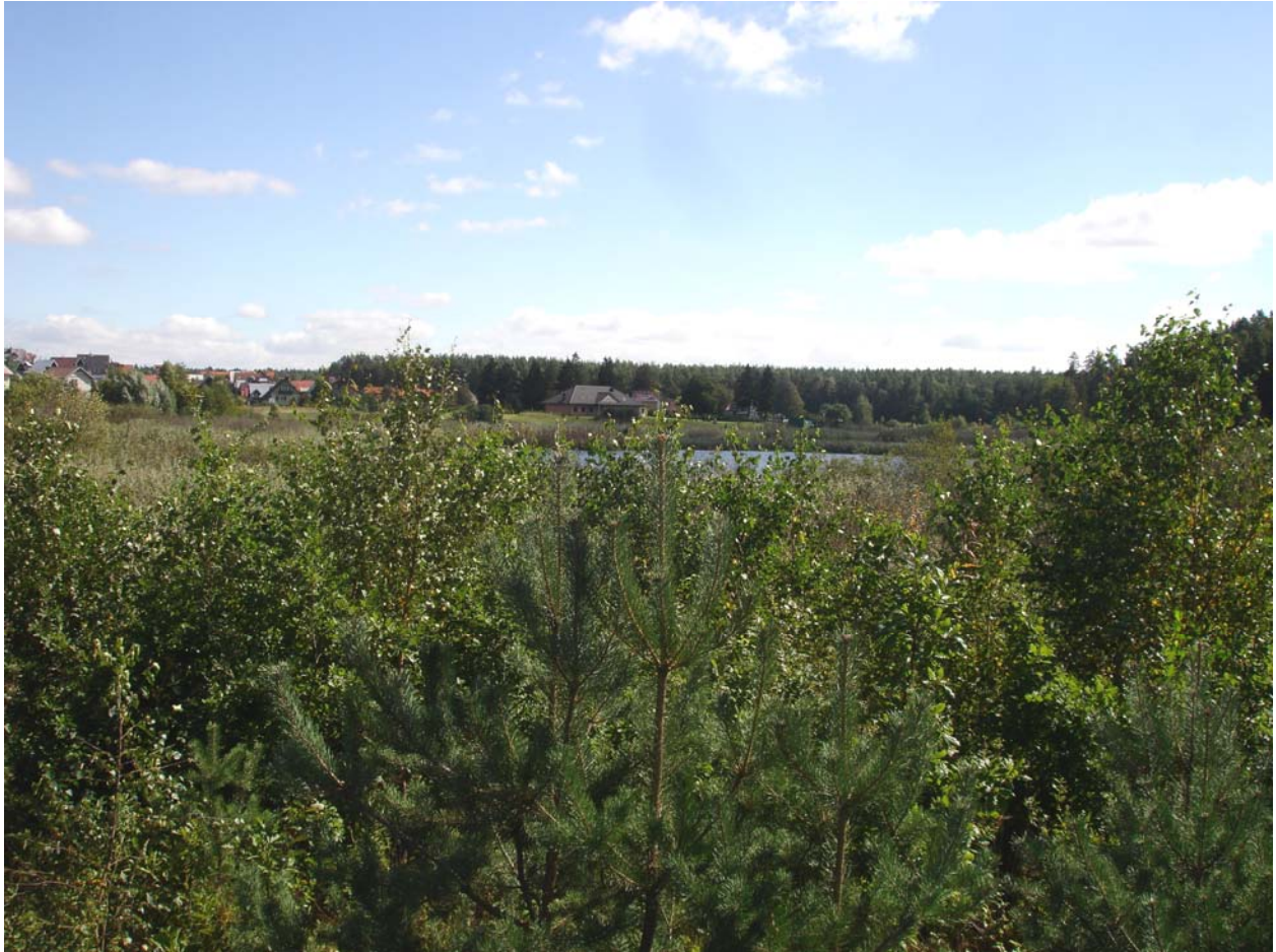
Użytek ekologiczny „Łozy w Kiełpinie”