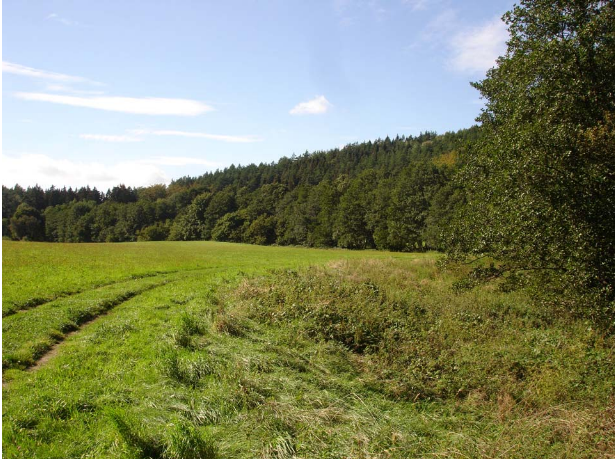
Użytek ekologiczny „Dolina Czystej Wody”