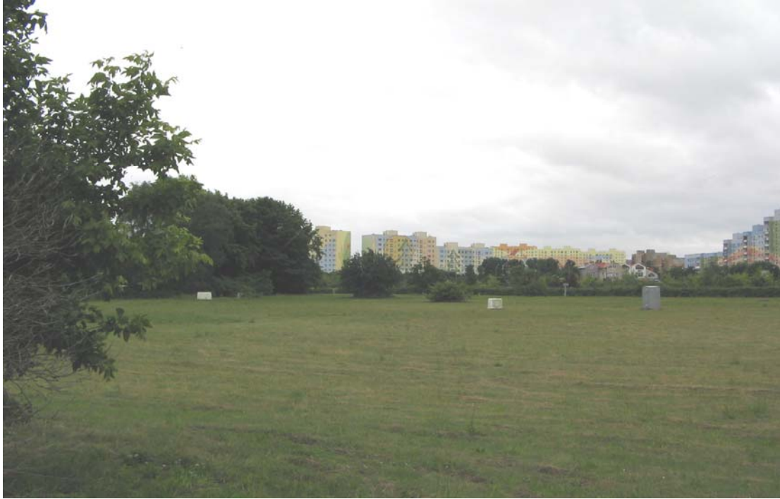
Zaspa. Strefa ujęć wody

Wykonano pielęgnację trawników na powierzchni 19 ha.