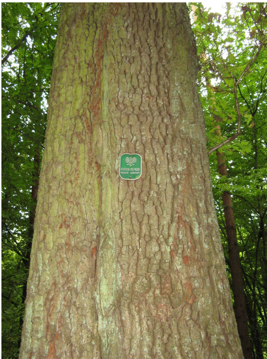
Pomnik przyrody na terenie TPK