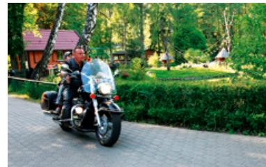
Dzieci mogły przejechać się na Harley'u.

A przejażdżka Harley'em to dopiero początek niesamowitego „Wieczoru marzeń”, jaki dla niepełnosprawnych dzieci zorganizowało oliwskie ZOO w pierwszy piątek czerwca. Tradycyjnie już gośćmi ogrodu zoologicznego były ciężko chore i niepełnosprawne dzieci, które na co dzień nie mają możliwości zwiedzania tego miejsca. „Wieczór marzeń” był imprezą przygotowaną specjalnie dla nich. Przewodnikami po ogrodzie byli opiekunowie zwierząt, którzy opowiadali o swoich podopiecznych i cierpliwie odpowiadali na najtrudniejsze pytania małych gości.