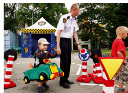
„Autochodzik” na placu edukacyjnym dla najmłodszych.