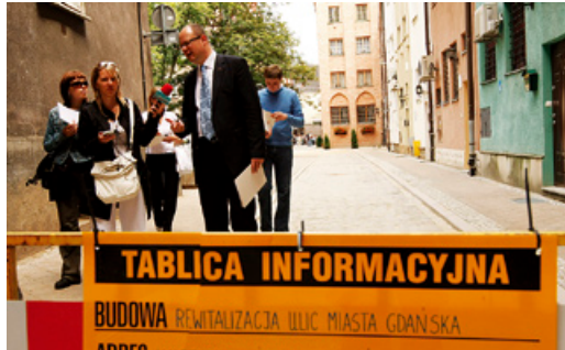
Prezydent i dziennikarze podczas spaceru po odnowionych uliczkach.

Spotkanie odbyło się z okazji zakończenia prac na ulicy Kuśnierskiej, Bosmańskiej, Kaletniczej, Mydlarskiej oraz placu przed Bramą Św. Ducha. - Bruk najbardziej oddaje charakter Gdańska sprzed setek lat. Chcemy zachować stylowy wygląd Głównego Miasta, ale pragniemy także, by było ono bardziej przyjazne