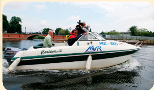
20 czerwca odbył się Komisyjny Odbiór Kąpielisk strzeżonych i przegląd gdańskich plaż pod względem czystości. Wzięli w nim udział także dziennikarze, którzy podróżowali między miejskimi plażami na dwóch łodziach motorowych.