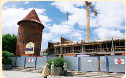
Gdańsk jest trzecim polskim miastem, w którym wkrótce powstanie hotel globalnej sieci Hilton. 11 czerwca podpisano akt erekcyjny i wmurowano kamień węgielny pod budowę gdańskiego obiektu, który powstaje nad brzegiem Motławy. Gdański „Hilton” zostanie otwarty w 2010 roku.