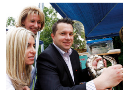
Wielką atrakcją były pokazy egzotycznych zwierząt z oliwskiego ZOO – w tym węży.