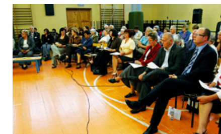
Urzednicy i mieszkańcy na sali gimnastycznej Szkół Elektrycznych i Elektronicznych.

Tematem dominującym był problem śmieci i braku porządku w dzielnicach. Mieszkańców interesowało też, kiedy w dzielnicy Strzyża zostanie zakończona akcja wymiany ołowianych przyłączy, czy istnieje możliwość wprowadzenia osobnych śmietników przy al. Grunwaldzkiej 24 oraz czy możliwe jest wydzielenie parkingów i jednoczesne zabezpieczenie trawników przy al. Grunwaldzkiej. Pytania mieszkańców dotyczyły planów zagospodarowania przestrzennego dla obu dzielnic i ewentualnych wyburzeń w związku z budową nowej ul. Abrahama. Poruszono także kwestię braku boiska przy szkole szermierczej w dzielnicy VII Dwór oraz lepszego zagospodarowania Placu Piłsudskiego.