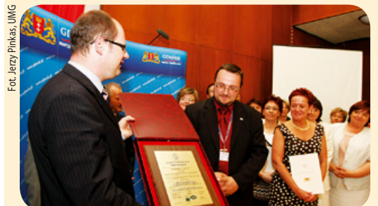
Certyfikat ISO 9001:2001 to międzynarodowa norma określająca wymagania, które powinien spełniać system zarządzania jakością w danej organizacji (instytucji). Urząd Miejski w Gdańsku po raz pierwszy otrzymał certyfikat w 2002 roku, a w czerwcu br. oficjalnie go przedłużył, potwierdzając wysoką jakość obsługi klienta i procedur urzędowych.