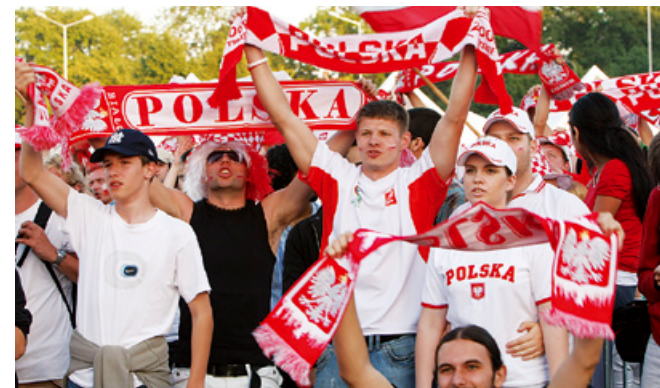
Gdańscy kibice podczas meczu Polska – Niemcy.

Jeszcze nie w Polsce i na Ukrainie, ale w Austrii i Szwajcarii. Jednak piłkarskie święto miało też swoje miejsce w Gdańsku – mieście, które będzie współgospodarzem kolejnych Mistrzostw Europy. Gdańszczanie mogli oglądać transmisje meczów na największym w Polsce ekranie diodowym o powierzchni 26 m 2 , który stanął w utworzonym na ten czas Parku Kibica – zlokalizowanym przy Bramie Oliwskiej (dawny Plac Zebrań Ludowych). Miasto Gdańsk wykupiło licencję na transmisje meczów.