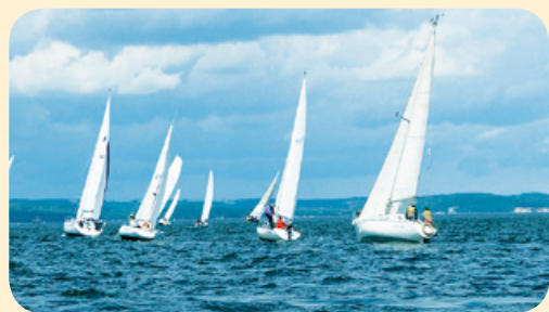
W weekend 21-22 czerwca na wodach Zatoki Gdańskiej rozegrano Regaty o Puchar Mariny Gdańsk. To druga edycja imprezy, która debiutowała w ubiegłym roku (z okazji obchodów 10. rocznicy działalności gdańskiej przystani jachtowej). Na liście startowej znalazły się jachty z Polski, Szwecji i Norwegii.