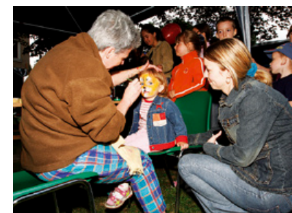
Dzieci mogły pomalować twarze i zjeść wate cukrową.