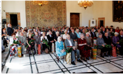
Dostojni Jubilanci przed spotkaniem z prezydentem.