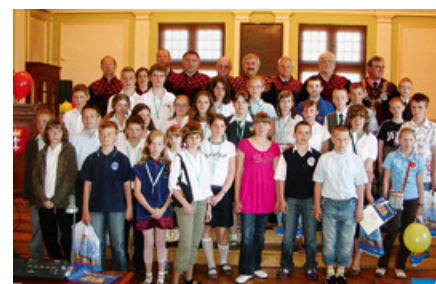
Pamiątkowe zdjęcie radnych młodszych i nieco starszych.

nie zaaprobowano propozycji zmiany nazwy Baltic Areny na Stadion Bałtycki.