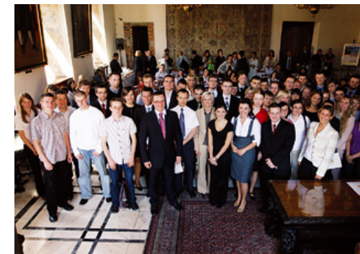
Na uroczystym finale akcji, ze stażystami spotkał się Marcin Szpak – zastępca prezydenta Gdańska.

Akcja została zorganizowana przez Gdańskie Centrum Obsługi Przedsiębiorcy Urzędu Miejskiego w Gdańsku. Oferta skierowana była do studentów i bezrobotnych absolwentów. Na apel prezydenta Gdańska, o umożliwienie stażu młodym ludziom, odpowiedziało 50 firm i instytucji, które zaoferowały 316 miejsc na płatnych wakacyjnych stażach.