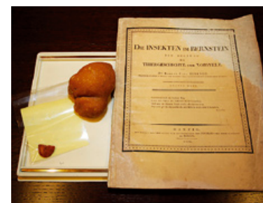
Muzeum Bursztynu otrzymało m.in. ten okaz przypominający ślimaka i starą niemiecką broszurę „Insekty w bursztynie”. Na zdjęciu także pół bursztynowego guzika.

nowych eksponatów, które wzbogacą zbiory gdańskiego Muzeum Bursztynu. Wśród nich znalazły się, m.in. naukowa broszura „Insekty w bursztynie” w języku niemieckim z 1830 roku, naciękowy okaz bursztynowego sopła o wadze 128 gram (przypominający ślimaka) i wykonana ok. 100 lat temu brosza z bursztynem „Kłos”.