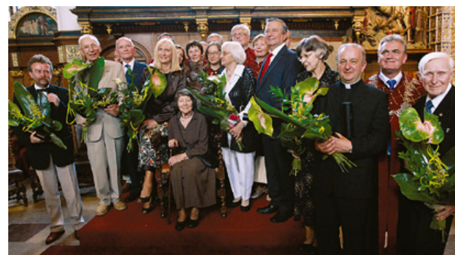
Lureaci tegorocznych nagród z gdańskimi rajcami.

Medale św. Wojciecha i księcia Mściwoja II wręczono po raz dwunasty.