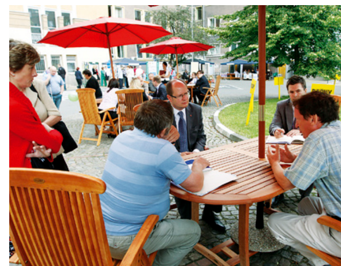
„Rozmowy pod parasolem” z prezydentem Gdańska.