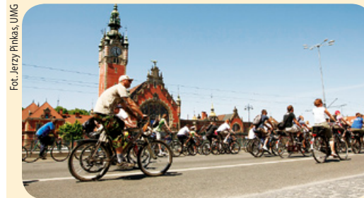
1 czerwca odbył się w Gdańsku XII Wielki Przejazd Rowerowy, który w tym roku towarzyszył VI Bałtyckiemu Festiwalowi Nauki. Obchody święta rowerowego w Gdańsku rozpoczęły się w samo południe na Targu Węglowym. Na zdjęciu: przejazd rowerzystów w pobliżu Dworca Głównego PKP.