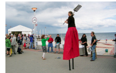
Do budowania smoka zachęcali szczudlarze.