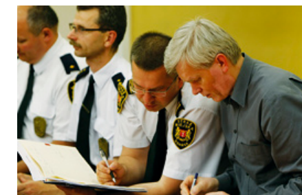
Przed i po spotkaniu była możliwość, by porozmawiać z urzędnikami o konkretnych problemach. Na zdjęciu: komendant Straży Miejskiej Leszek Walczak w rozmowie z mieszkańcem.