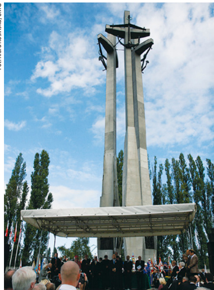
Główne uroczystości odbyły się pod Pomnikiem Poległych Stoczniovców.