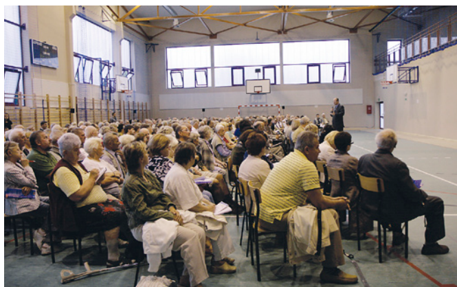
Na spotkanie z prezydentem przybyło wielu mieszkańców Brzeźna.