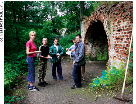
Mieszkańcy przed rozpoczęciem akcji.

Tym razem porządkowane były okolice zabytkowej muszli i schodów prowadzących do niej w lesie miejskim przy ul. Polanki (na wysokości ul. Tetmajera). Sprzątanie rozpoczęło się w samo południe. Na prośbę organizatorów, gdański magistrat zapewnił sprzątającym worki, rękawice oraz zorganizował wywóz zebranych śmieci.