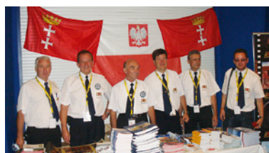
Polska delegacja na zlocie w Austrii.

Zadaniem naszej delegacji była promocja miasta, prezentacja programu zlotu na 2009 rok oraz zaproszenie delegatów do Gdańska. Międzynarodowe Motorowe Stowarzyszenie Policji powierzyło bowiem Polsce zorganizowanie w 2009 roku 63. Międzynarodowego Motorowego Zlotu Gwiazdzistego Policji. Zlot odbędzie się w Gdańsku w dniach 21 – 25 lip-