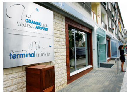
Terminal mieści się w centrum Gdańska, przy ulicy Heweliusza.