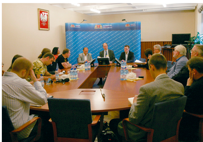
Prezydent Paweł Adamowicz poinformował podczas konferencji prasowej o powstaniu nowej spółki. Obok prezydenta (z lewej) jej nowo wybrany prezes – Romuald Nietupski.

W wyniku dokonanej analizy kosztów zarządzania projektami inwestycyjnymi w Polsce, w Europie i na Świecie wstępny koszt działalności spółki oszacowany został na poziomie 50 mln zł - na przestrzeni lat 2008 - 2012, a planowane zatrudnienie wyniesie ok.