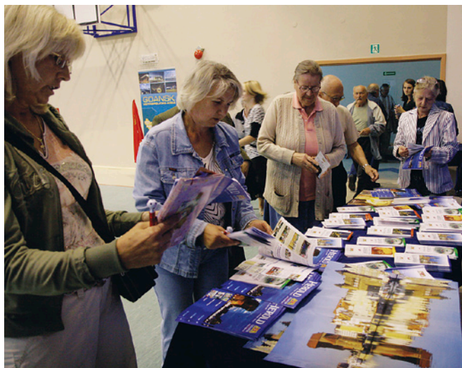
Duże zainteresowanie wzbudzały publikacje miejskie – w tym „Herold”.

- Tuż obok Was, po sąsiedztwie, stanie jeden z najnowocześniejszych stadionów piłkarskich w Europie. Dziś możecie się zastanawiać, czy to jest potrzebna inwestycja, ale przekonacie się,