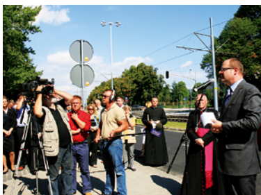
Uroczyste otwarcie ulicy Hallera.