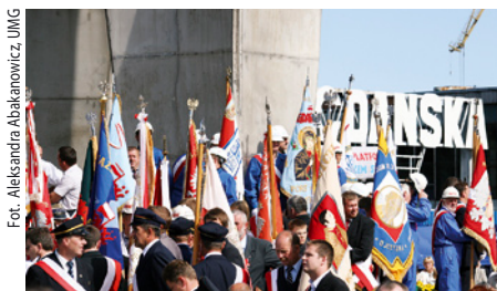
Pod bramą nr 2 Stoczni Gdańskiej zebrały się poczty sztandarowe trójmiejskich zakładów pracy.

Gości powitał przewodniczący Solidarności Janusz Śniadek. Aktor Jerzy Kizkisz przypomniał słowa Jana Pawła II o Solidarności, a prezydent RP wręczył kilkudziesięciu osobom odznacze-