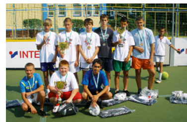
„Jagiellońska” – zwycięzcy w grupie starszych roczników.