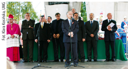
Przemówienie prezydenta RP.

Uroczystości odbywały się 30 i 31 sierpnia w Gdańsku i Sopocie. Punktem kulminacyjnym było spotkanie pod Pomnikiem Poległych Stoczniovców, z udziałem m.in. prezydenta RP Lecha Kaczyńskiego, Marszałka Senatu Bogdana Borusewicza, abp. Sławoja Leszka Głódzia. Wojewody Pomorskiego, Marszałka Województwa Pomorskiego i Prezydenta Gdańska.