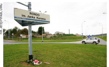
Rondo imienia Jacka Kuronia.