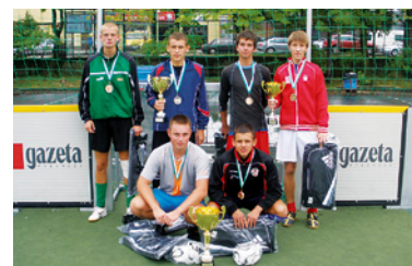
„Pokemony” – zwycięzcy rocznika 1993 i młodszych.