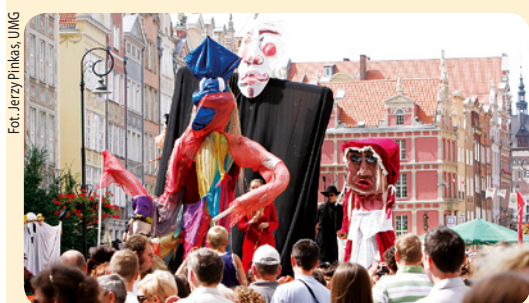
Podczas XII edycji Festiwalu Szekspirowskiego, który odbywał się w dniach 2-9 sierpnia w Trójmieście, zaprezentowano spektakle z Wielkiej Brytanii, Japonii, Hiszpanii, USA, Rumunii, Ukrainy, Armenii i Polski. Na zdjęciu: uliczna parada na ulicach Gdańska z okazji zakończenia Festiwalu.