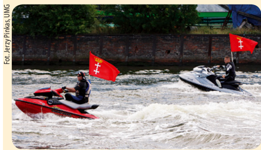
9 sierpnia odbyły się w Gdańsku (obok mostu wantowego) II Otwarte Mistrzostwa Polski w Skuterach Wodnych. Są to jedyne w Polsce zawody, w których udział mogą brać tylko zawodnicy bez licencji sportowej. Także jedyne zawody prowadzone bez podziału i ograniczenia wiekowego. A przy tym bardzo widowiskowe!