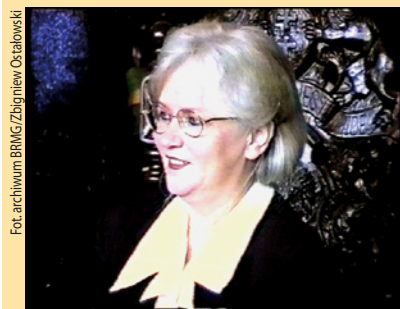
Na zdjęciu Alina Pienkowska podczas odbierania tytułu Honorowego Obywatela Miasta Gdańska w 2000 r.

Alina Pienkowska z wykształcenia była dyplomowaną pielęgniarką, współorganizatorem Wolnych Związków Zawodowych Wybrzeża, sygnatariuszem porozumień sierpniowych, współautorką 21 postulatów, Senatorem RP II Kadencji oraz Honorowym Obywatel Miasta Gdańska. Zmarła po ciężkiej chorobie 17 października 2002 r. W roku 2006 odznaczona została pośmiertnie Krzyżem Wielkim Orderu Odrodzenia Polski.