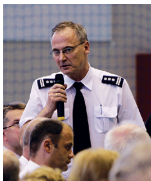
Na pytania dotyczące bezpieczeństwa w dzielnicy odpowiadali policjanci.

że uczestnictwo w organizacji Mistrzostw Europy opłaci się i Wam, i całemu miastu – przekonywał Prezydent Adamowicz.