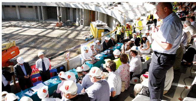
Wspólne obrady rajców Gdańska i Sopotu na terenie powstającej hali.