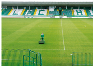
Nowa płyta boiska Lechii Gdańsk.

Michał Piotrowski