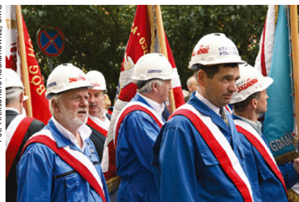
Pracownicy trójmiejskich stoczni podczas przemarszu.

tofa Pendereckiego specjalnie dla ECS. Wystąpił także m.in. Stanisława Soyka i zespół Perfect.