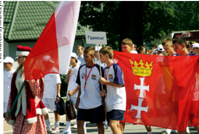
Gdańsk drużyna na oficjalnym rozpoczęciu zawodów.