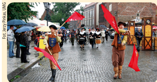
Ostatnie dni Jarmarku św. Dominika były deszczowe. W niedzielę 17 sierpnia, podczas oficjalnej ceremonii zamknięcia Jarmarku na Targu Węglowym, organizatorzy wręczyli nagrody najlepszym wystawcom i podsumowali tegoroczną imprezę. W tym roku Jarmark św. Dominika odwiedziło około 7,5 mln osób, czyli o milion mniej niż przed rokiem.