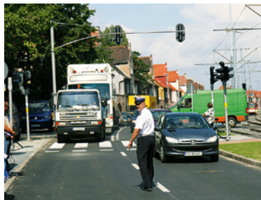
Ulica Generała Hallera po generalnym remoncie.

GPKM jest kontynuacją działań inwestycyjno-modernizacyjnych rozpoczętych przez Miasto w 1999 roku. Projekt obejmował w sumie 26 inwestycji: zmodernizowano m.in. 20 km torów wraz z całą infrastrukturą, wybudowano 48 rozjazdów, przebudowano 41 przejść dla pieszych. Zbudowano i przebudowano 55 przystanków