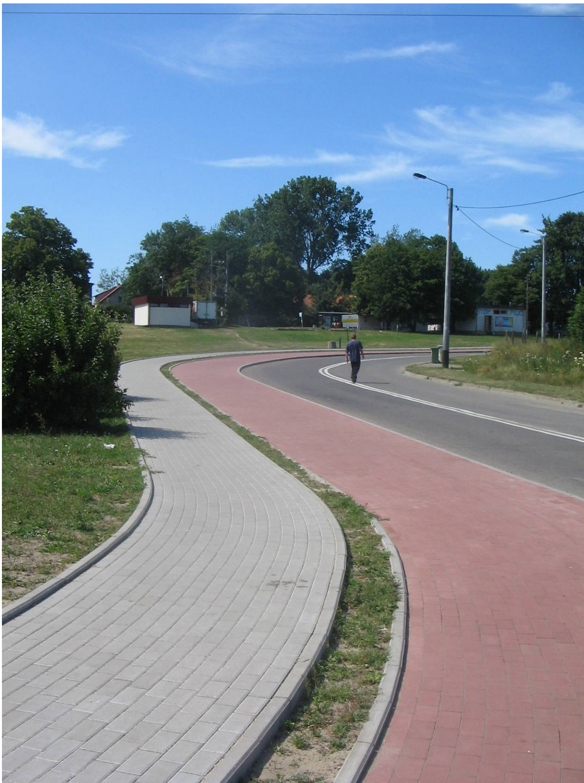
Ścieżka pieszo - rowerowa w rejonie Świbna