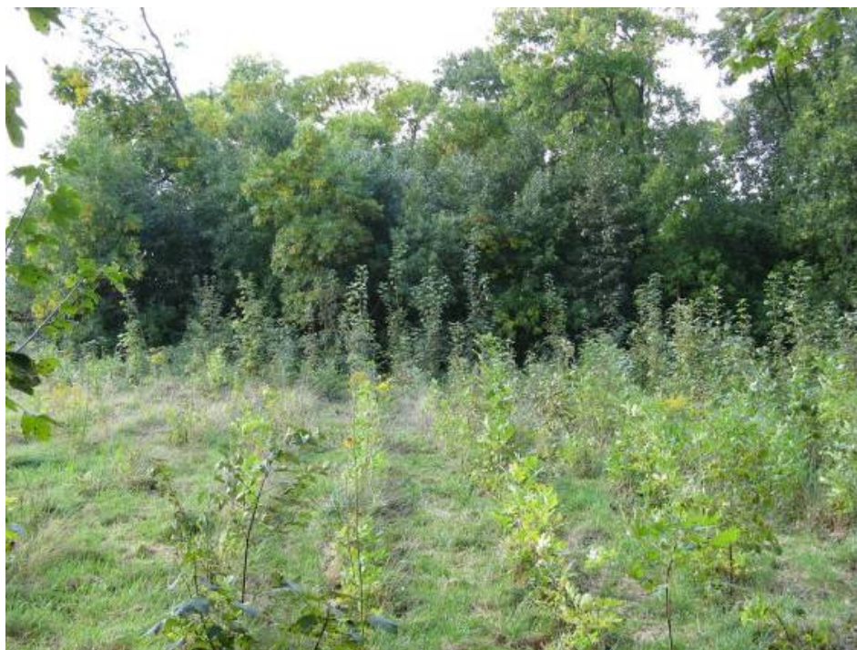
Uprawa leśna w Pasie Nadmorskim