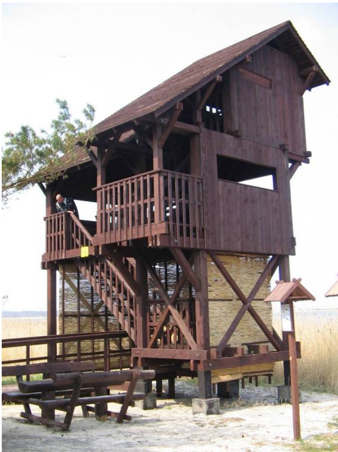
Wieża widokowa w rezerwacie na Wyspie Sobieszewskiej.