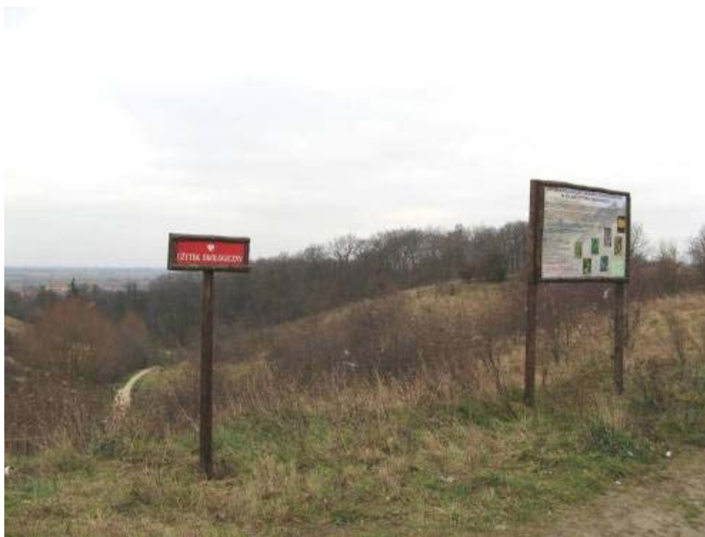
„Murawy kserotermiczne” w „Dolinie Potoku Oruńskiego”

Użytek ekologiczny „Murawy kserotermiczne w Dolinie Potoku Oruńskiego” o powierzchni 2,88 ha, utworzony w 1999 r., na terenie fragmentu doliny Potoku Oruńskiego, wyniesiony do 49 m n.p.m. Użytek powołano w celu zabezpieczenia muraw kserotermicznych, wraz z bogactwem ich flory i fauny. Z dwóch stron ograniczony przez erozyjne rozcięcia z drogami gruntowymi i zaroślami. Zbocza osiągają nachylenie do 40 stopni. Na terenie muraw stwierdzono występowanie dobrze wykształconych płatów muraw kserotermicznych, 232 gatunków roślin naczyniowych, w tym liczną grupę roślin ciepłolubnych niewystępujących na innych terenach naszego regionu.