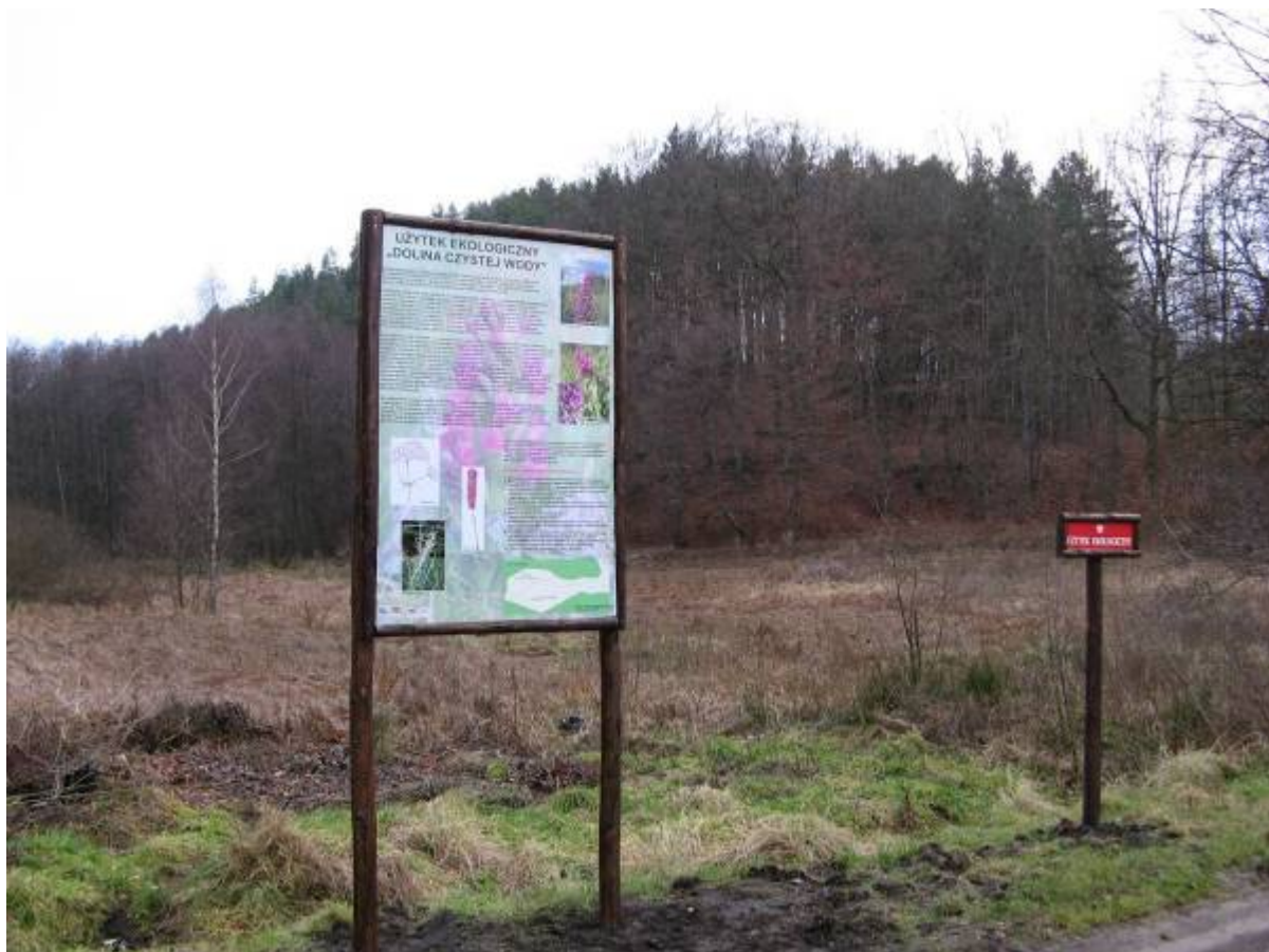
Użytek ekologiczny „Dolina Czystej Wody”

Użytek ekologiczny „Dolina Czystej Wody” o powierzchni 2,73 ha, utworzony w 2006 r. zlokalizowany na terenie Doliny Czystej Wody w Trójmiejskim Parku Krajobrazowym. Celem ochrony jest zabezpieczenie istnienia stanowisk chronionych oraz wzmożona ochrona siedlisk hydrogenicznych i zbiorowisk roślinnych związanych z ciekami strefy krawędziowej wysoczyzny morenowej oraz w szczególności ochrona stanowiska situ tępokwiatowego Juncus subnodulosus – najdalej na wschód położonego stanowiska tego gatunku w Polsce.