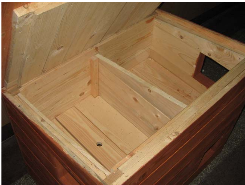
Wnętrze „kociego domku”

W związku z dużym sukcesem i zainteresowaniem społecznym w roku 2007 wzorem roku 2006 kontynuowano akcję pomocy bezdomnym kotom. Zakupiono 120 domków dla kotów, które przekazano nieodpłatnie mieszkańcom. Domki wykonane są z impregnowanego drewna. Każdy domek jest ocieplony i zawiera 4 pomieszczenia z niezależnymi wejściami. Dachy domków są unoszone, co umożliwia ich sprząatanie. Domki znajdują się pod opieką wolontariuszy, którzy otrzymali je od administratorów osiedla.