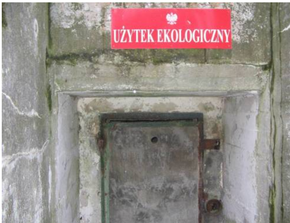
Nietoperze występujące na terenie użytku „Oliwskie Nocki”

Użytek ekologiczny „Oliwskie Nocki” o powierzchni 0,07 ha zlokalizowany przy ul. Podhalańskiej 13 w Oliwie, utworzony w 2001 r., w celu zabezpieczenia stanowiska hibernacji nietoperzy. Stanowi największe zimowisko nietoperzy w Gdańsku. Co roku na terenie użytku hibernuje ok. 70-80 skrzydlatych ssaków - głównie nocków rudych ( Myotis daubentonii ) i nocków Natterera ( Myotis nattereri ), jak również kilkanaście nocków dużych ( Myotis myotis ) i kilka gacków brunatnych.