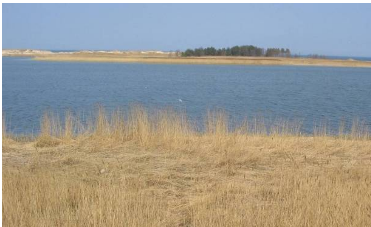
„Ptasi Raj”. Wyspa Sobieszewska.

Obszar Chronionego Krajobrazu Wyspy Sobieszewskiej - powierzchnia 1384 ha, obejmujący fragment Mierzei Wiślanej na całej jej szerokości. Najcenniejsze fragmenty obszaru objęto ochroną rezerwatową (rezerwaty Ptasi Raj i Mewia Łacha). Obszar Chronionego Krajobrazu Wyspa Sobieszewska, jako część Mierzei Wiślanej, stanowi fragment ważnego przymorskiego ciągu zieleni Gdańska oraz regionalnego systemu przyrodniczego strefy nadmorskiej rejonu Zatoki Gdańskiej.