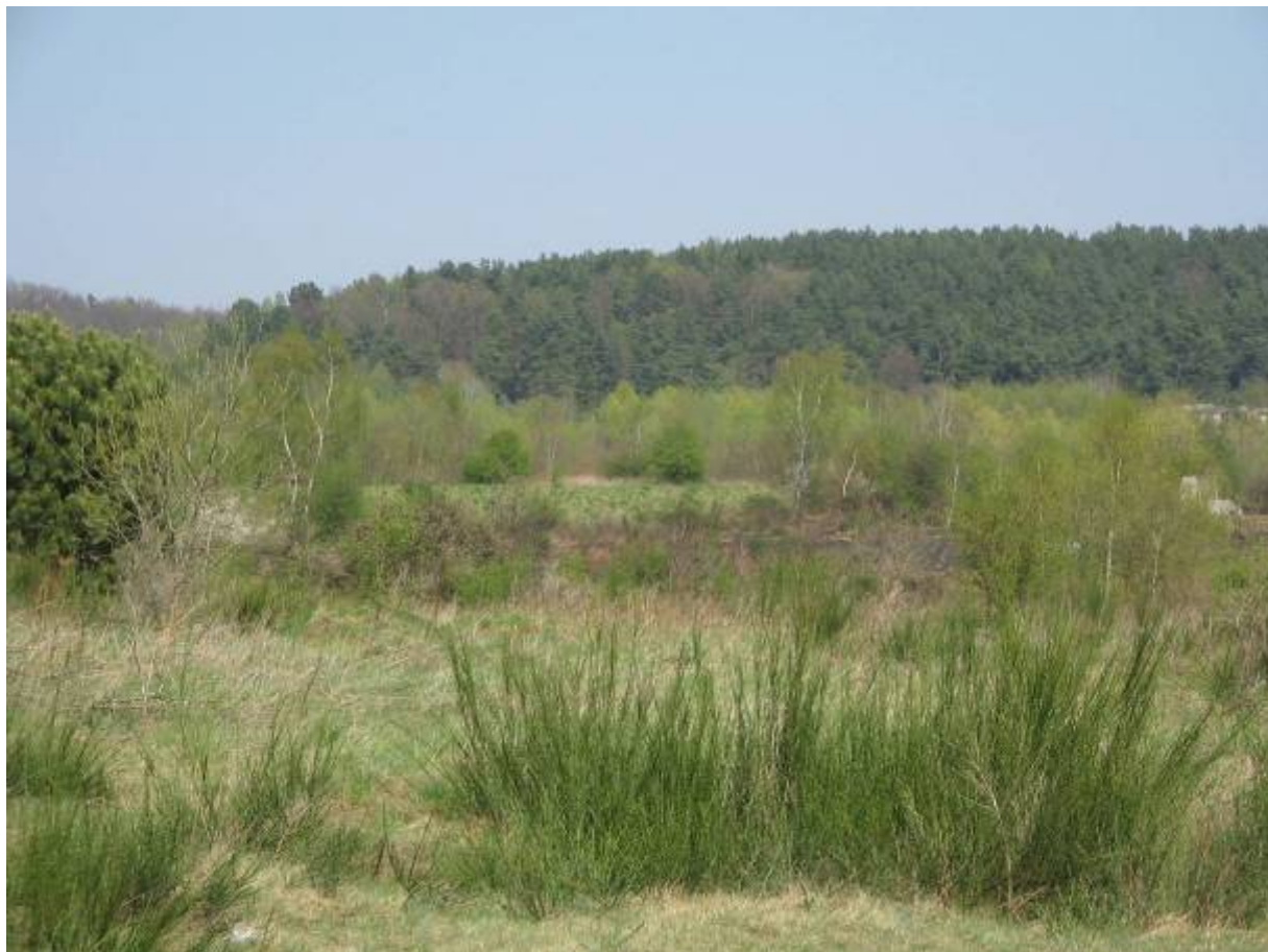
Zespół przyrodniczo-krajobrazowy „Dolina Strzyży”

Zespół przyrodniczo-krajobrazowy „Dolina Strzyży” o powierzchni 375,45 ha położony w otulinie Trójmiejskiego Parku Krajobrazowego, utworzony w 2001 r., w celu zachowania wyjątkowych walorów krajobrazowych terenu oraz bogatej szaty roślinnej, przy jednoczesnym wdrażaniu zasady budowania ciągłości struktur przyrodniczych.