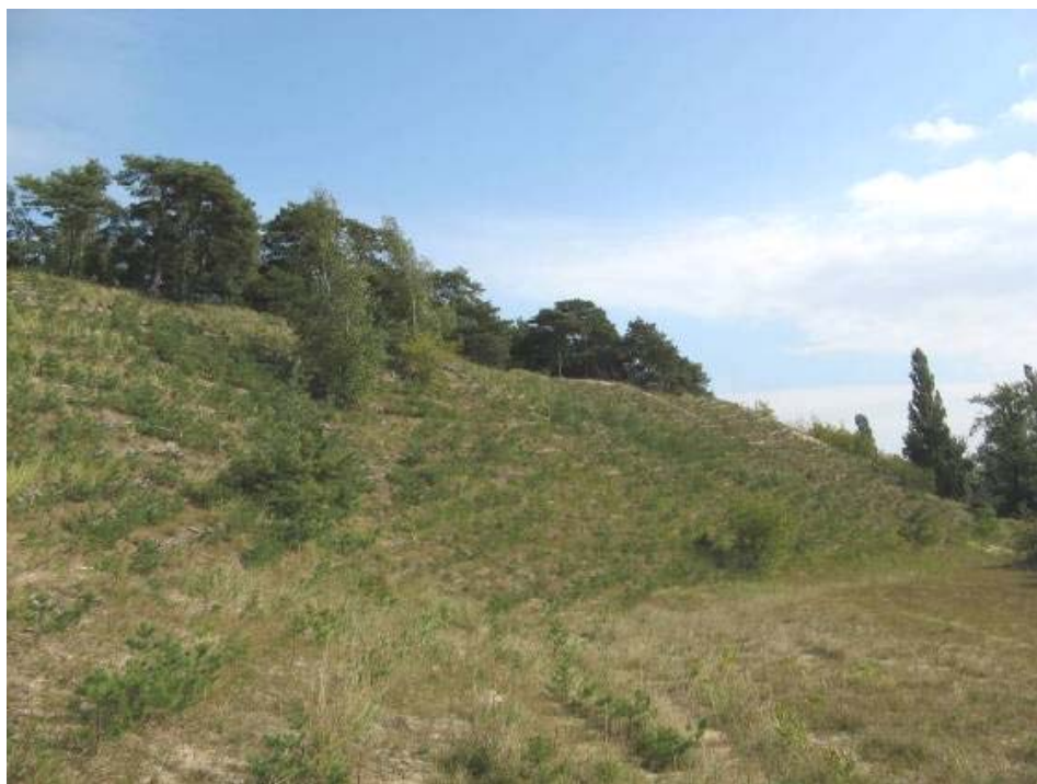
Uprawa leśna na południowym stoku wydmy. Górkach Zachodnie

Nowe uprawy leśne zostały założone na terenach następujących lasów miejskich: w Pasie Nadmorskim, w Brzeźnie w rejonie ul. Łozy, a także w Gdańsku Stogach i Górkach Zachodnich. W uprawach założonych w latach poprzednich prowadzono systematycznie prace pielęgnacyjne. Wykonano nawożenie mineralne, wykaszanie chwastów w międzyrzędach i w rzędach sadzonek, uzupełniono nasadzenia w miejscach, w których wcześniejsze sadzonki się nie przyjęły. Dużym wyzwaniem było założenie uprawy leśnej na południowym stoku wydmy w Górkach Zachodnich, w szczególnie trudnych warunkach. Aktualnie widać już pozytywne efekty tego działania.