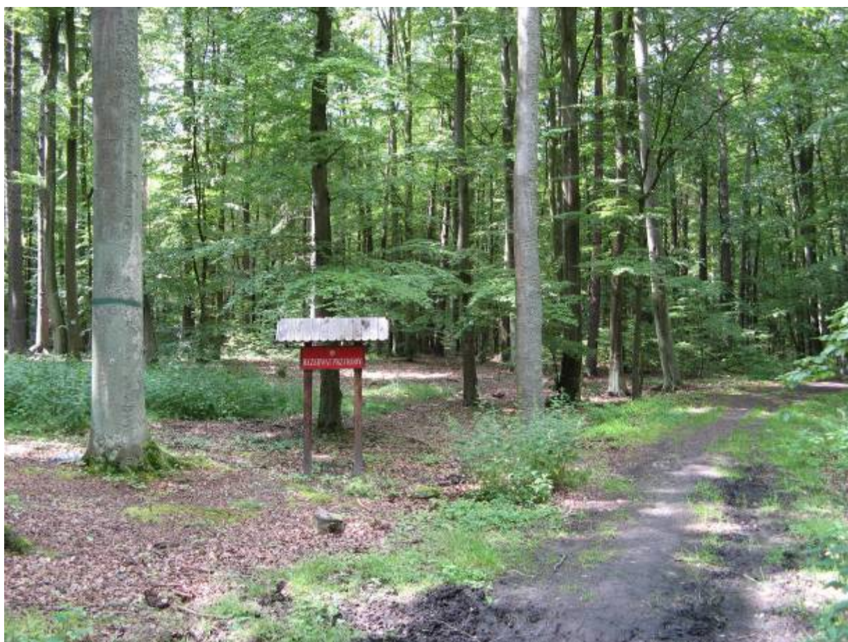
Rezerwat „Wąwóz Huzarów” TPK

Rezerwat przyrody „Wąwóz Huzarów” o powierzchni 2,8 ha utworzony w 2005 r., w celu ochrony roślin rzadkich i chronionych. Obejmuje wąskie rozcięcie erozyjne o stromych zboczach oraz część przylegającej wierzchołkowej w strefie krawędziowej Pojezierza Kaszubskiego. W rezerwacie stwierdzono występowanie 117 gatunków roślin naczyniowych, w tym trzech gatunków podlegających ochronie ścisłej ( bluszcz pospolity , podrzeń żebrowiec i widłak jałowcowaty ) oraz czterech podlegających ochronie częściowej ( bluszcz pospolity , konwalia majowa , kruszyna pospolita i marzanka wonna ).