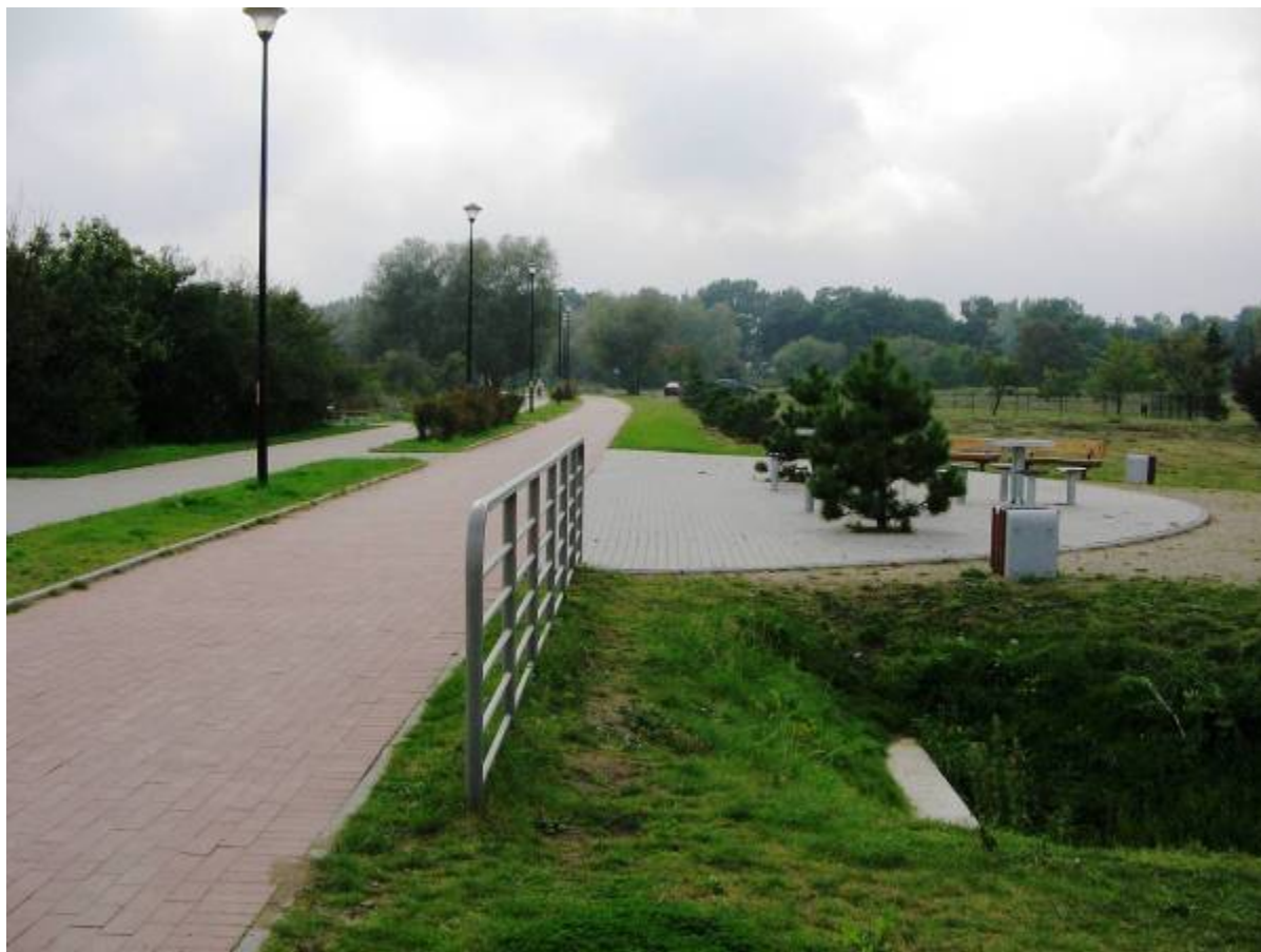
Ścieżka pieszo rowerowa w Parku Nadmorskim

Zakończono budowę pierwszego odcinka ścieżki pieszo – rowerowej o dł. ok. 1,5 km wzdłuż ul. Boguckiego. Wykonano nawierzchnię jezdnią i ciąg pieszy na odcinku promu w Świbnie do ul. Klimatycznej. Łącznie projekt zakłada budowę ok. 8,5 km ścieżki od przeprawy promowej do ul. Modrzejewskiej i dalej w kierunku do mostu w Sobieszewie.