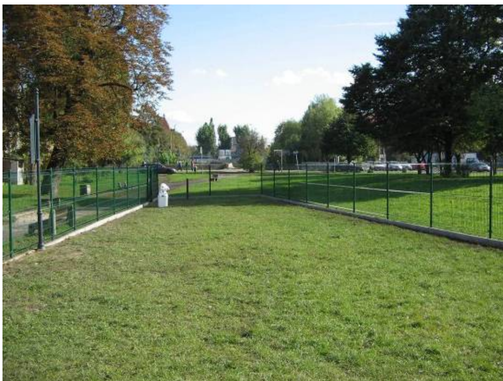
Gdańsk „Za Murami” Wybieg dla psów