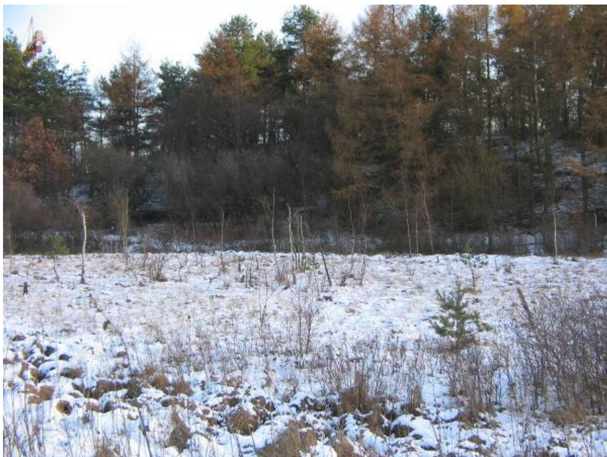
Użytek ekologiczny „Migowska Bielawa”

Użytek ekologiczny „Migowska Bielawa” o powierzchni 0,51 ha, utworzony w 2006 r. zlokalizowany pomiędzy ul. Myśliwską i osiedlem Jasień. Celem powołania użytku jest ochrona torfowiska przejściowego z masową obecnością torfowców i wełnianek. Miąższość złoża torfu wynosi ok. 4 m, co pozwala określić wiek obiektu na ok. 2 – 3 tys. lat. Na obszarze użytku stwierdzono występowanie następujących gatunków chronionych: rosiczki okrągłolistnej Drosera rotundifolia oraz brzoza karłowata Betula nana oraz kilku zagrożonych w tym w szczególności turzycę bagienną Carex limosa , której obecność we florze Gdańska jest cenną wartością.