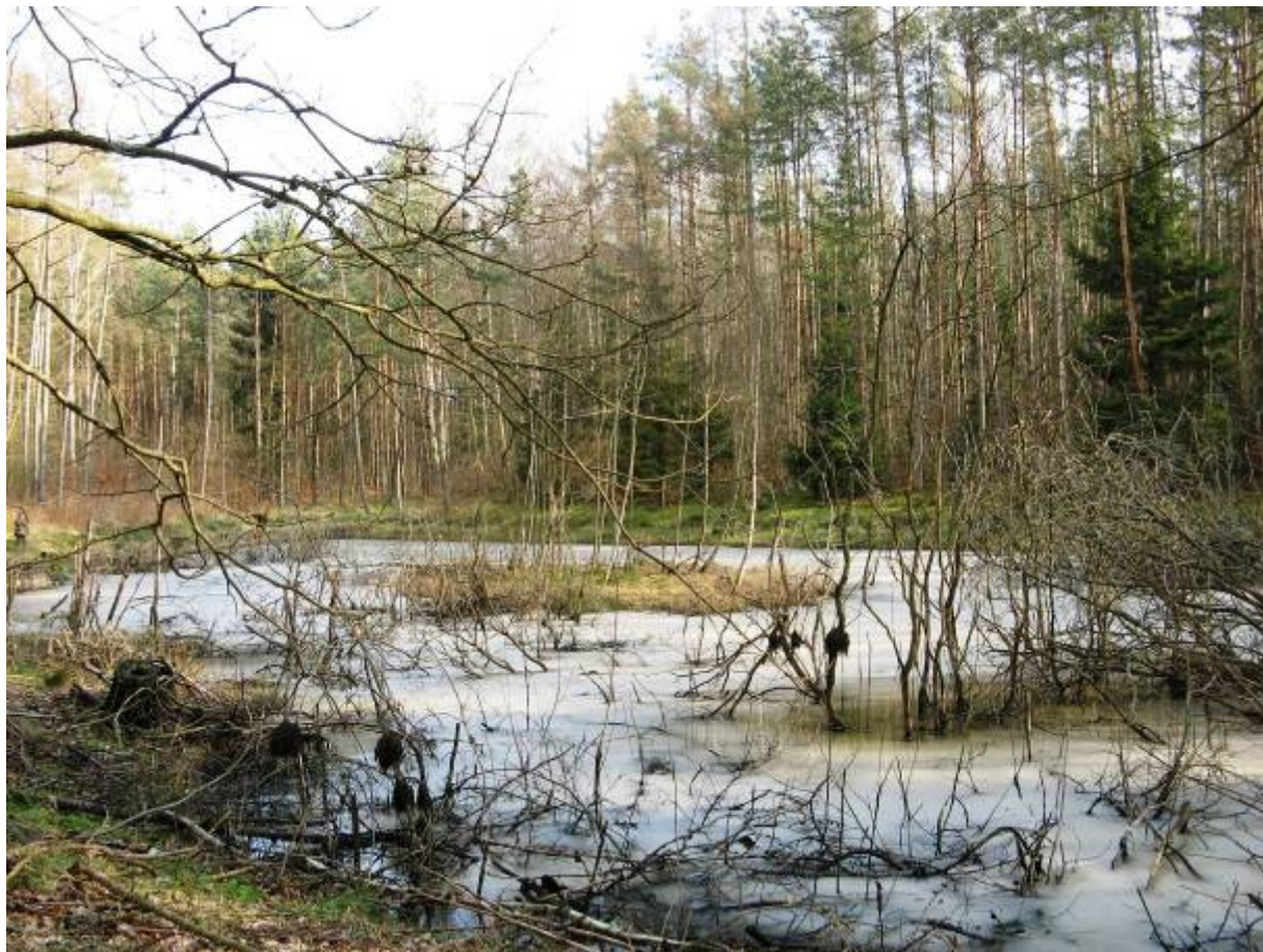
Otomiński Obszar Chronionego Krajobrazu.

Otomiński Obszar Chronionego Krajobrazu - powierzchnia 2 072 ha, częściowo obejmujący tereny położone w Gminie Gdańsk. W granicach miasta znajduje się północno-zachodnia część obszaru o powierzchni 1 762 ha, obejmująca kompleks tzw. lasów smęgorzyńskich (położonych pomiędzy terenami rolniczymi i zabudową osiedli Kiełpino Górne i Smęgorzyno oraz Sulmin i Niestępowo).