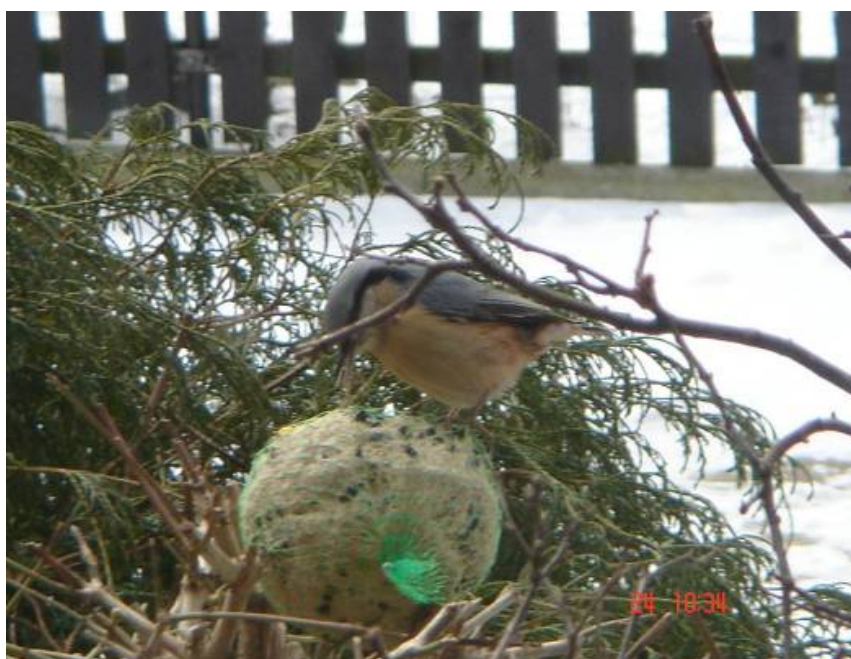
Kielcino „Ptasia pyza”

Akcja polega na rozwieszaniu kul zawierających sprasowane ziarna w okresie zimowym. Rozdano 940 kul ziarna o łącznej wadze 540 kg. Głównymi odbiorcami karmy była młodzież szkolna, której przekazano również 80 szt. karmników dozujących oraz 60 szt. zwykłych karmników z daszkiem.