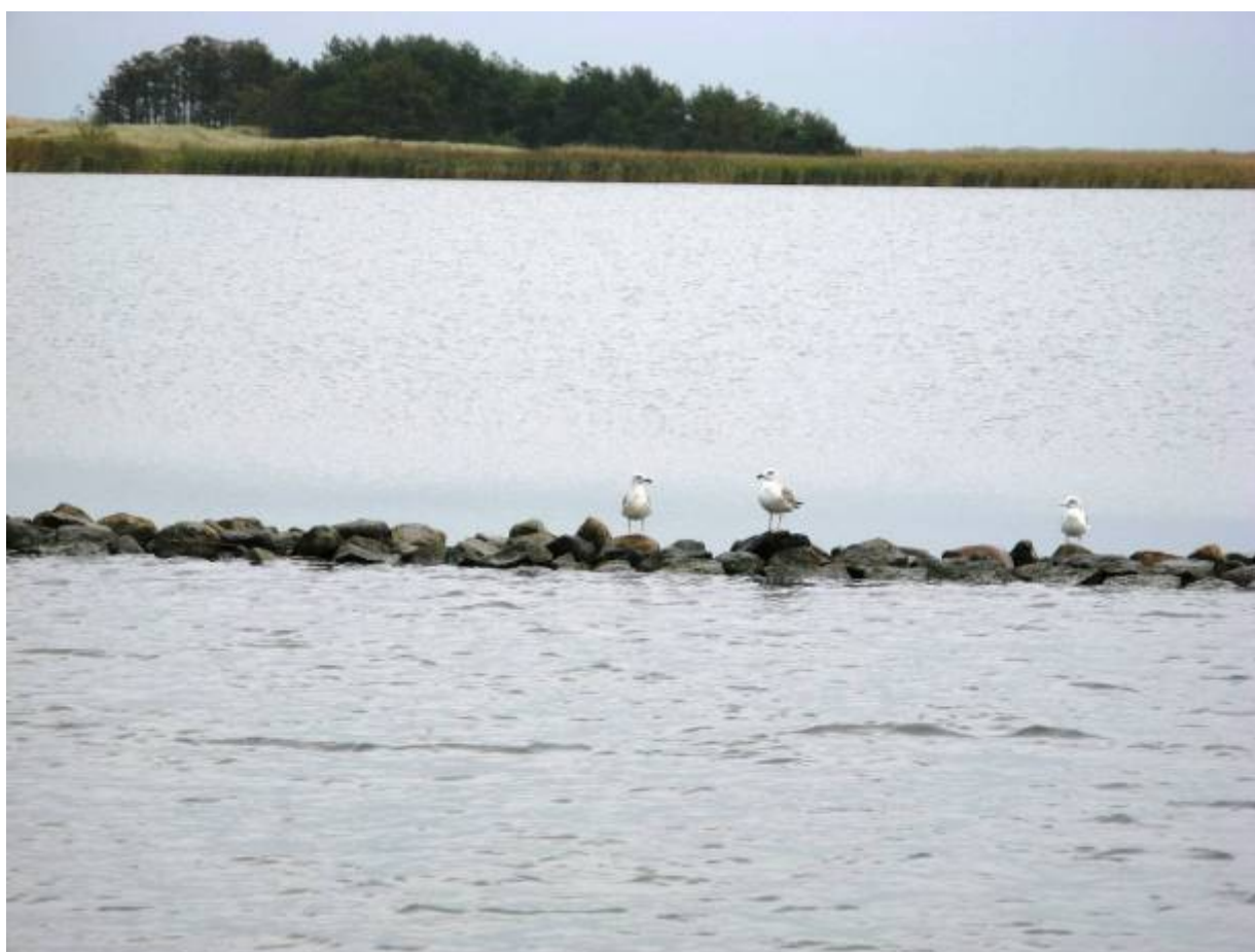
Rezerwat „Ptasi Raj”.

Rezerwat przyrody „Ptasi Raj” utworzony w 1959 r. jako rezerwat faunistyczny, w celu ochrony ostoi ptactwa wodnego i błotnego. Położony u ujścia Wisły Śmiałej na terenie Wyspy Sobieszewskiej, wchodzący w granice Obszaru Chronionego Krajobrazu Wyspy Sobieszewskiej. Powierzchnia rezerwatu wynosi 188,80 ha. Główny charakter roślinności bezpośredniego otoczenia jezior nadają szuwary trzcinowe, miejscami występują szuwary turzycowe. W południowej części rezerwatu występują kultury sosny i olszy czarnej. Na terenie mierzei obserwuje się pozostałości nieleśnej napiaskowej roślinności wydmowej – zbiorowiska wydmy białej i szarej. Ze względu na walory awifaunistyczne rezerwat ma znaczenie o randze międzynarodowej.