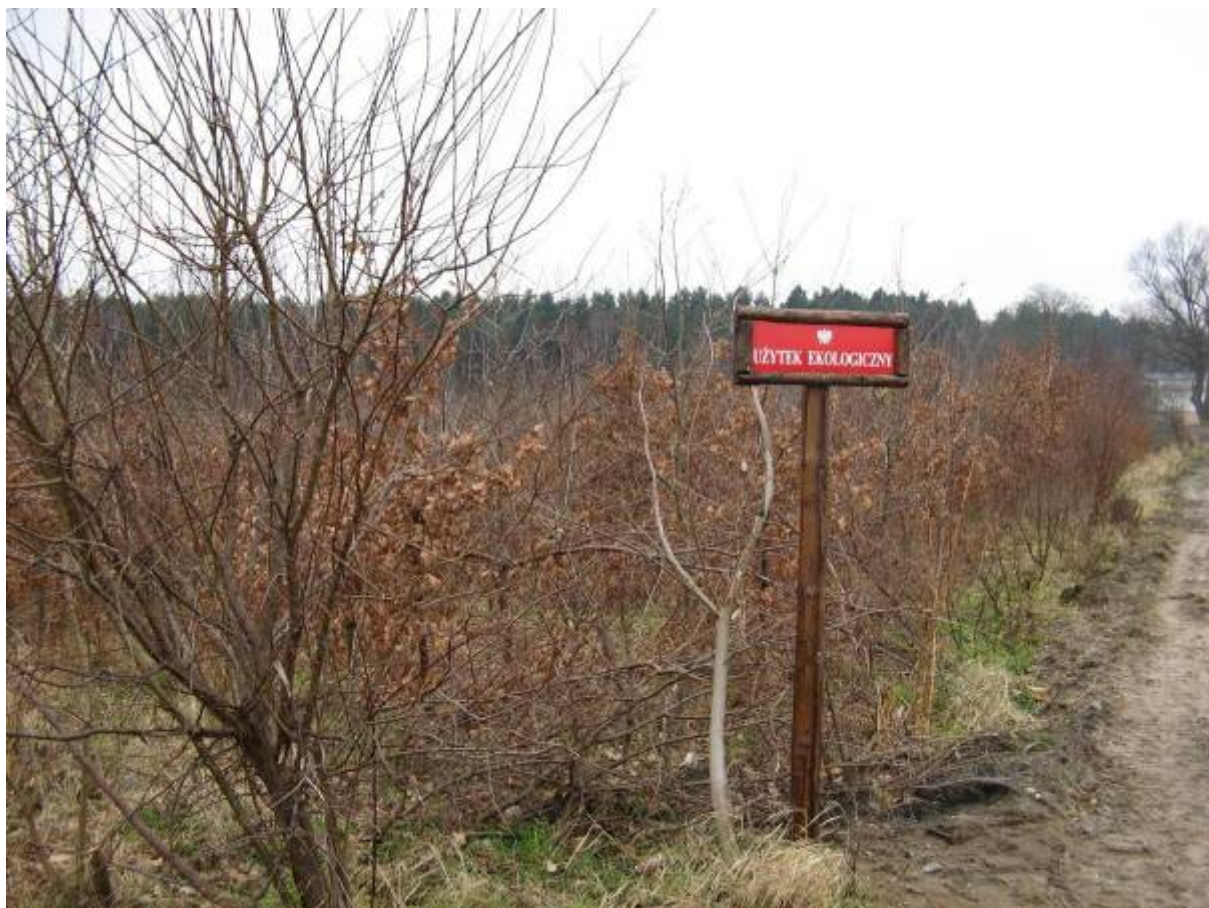
Użytek ekologiczny „Łozy w Kielpinie”

Użytek ekologiczny „Łozy w Kielpinie” o powierzchni 6,29 ha, utworzony w 2006 r. zlokalizowany w okolicy Kielpina Górnego. Celem ustanowienia użytku jest wzmożona ochrona siedlisk hydrogenicznych i związanych z nimi zbiorowisk roślinnych, a w szczególności zabezpieczenie istnienia stanowisk wierzby szarej – rozległych zarośli łozy wraz z szuwarami, położonych we wschodniej części wysoczyzny morenowej na południowy zachód od Kielpina Górnego.