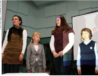
Nagrodzeni w konkursie.