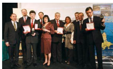
Laureaci II edycji „Firma z przyszłością”.

W konkursie, którego organizatorem jest Pomorska Izba Rzemieślnicza Małych