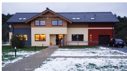
Nowe ośrodki są nowoczesne i dobrze wyposażone.

Wszystkie są filiami dotychczasowej placówki na Orunii. Spotkanie rozpoczęło się w pierwszym nowym domku przy ul. Turystycznej 26A, następnie goście przejechali do dwóch kolejnych, które powstały przy ul. Wiosłowej 23 oraz Wiosłowej 25 w Gdańsku. W każdym z nowych domów zamieszka czternaścioro podopiecznych, w tym dzieci młodsze, w wieku szkoły podstawowej i gimnazjum. Placówki są nowocześnie wyposażone, a do dyspozycji dzieci są m.in. salony, pokoje dzienne, kuchnie, sale zabaw. W każdym domu całodobową opiekę sprawuje sześciu wychowawców. Dzieci mogą pozostać w placówkach do czasu usamodzielnienia się.