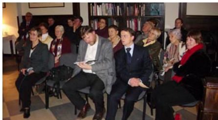
W trakcie wieczoru można było nabyć najnowszy tom wierszy poetki pt. „Maj to łagodny miesiąc”.

Elżbieta Lipińska zwyciężyła w tegorocznej edycji Konkursu Literackiego Miasta Gdańska im. Bolesława Faca.