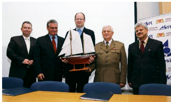
Po podpisaniu porozumienia z Ligą Obrony Kraju.

floty, będzie służyć młodym gdańszczanom do celów edukacji żeglarskiej. Wzorem innych miast hanzeatyckich, Gdańsk będzie właścicielem żaglowca „Generał Zaruski”, który po rewitalizacji będzie pełnił funkcję flagowej jednostki Miasta Gdańska. Zaczumowany przy Centralnym Muzeum Morskim stanowić będzie atrakcję turystyczną i dumę Gdańska, jako aktywny obiekt muzealny.