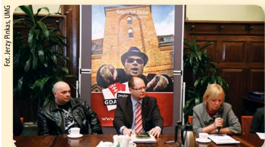
Z końcem listopada rozpoczęła się na kampania outdoorowa „Jestem z Gdańska”, przygotowana przez Biuro Prezydenta ds. Promocji Miasta, a skierowana do mieszkańców Gdańska. Na 100 citylightach i 53 billboardach eksponowanych jest 12 różnych zdjęć znanych i mniej znanych gdańszczan. Kampania ma na celu wzmocnienie identyfikacji z miastem oraz pokazanie, że miasto to przede wszystkim niezwykły ludzie.