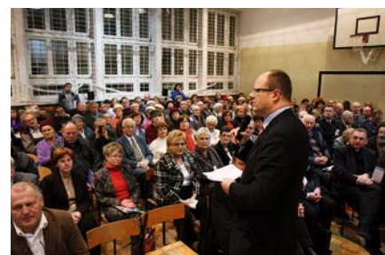
Cała sala gimnastyczna SP 11 była wypełniona.

powiedzi na pytania mieszkańców udzielał osobiście dyrektorzy wydziałów i jednostek organizacyjnych Miasta Gdańska.