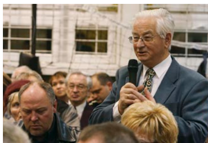
Pytania zadawali też przedstawiciele lokalnej społeczności.