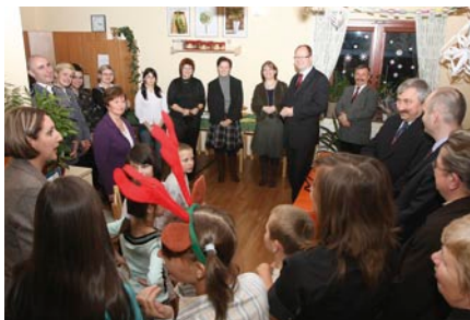
Uroczyste przekazanie jednego z domków.

26 listopada prezydent Gdańska Paweł Adamowicz otworzył aż trzy nowe, rodzinne domy dziecka.