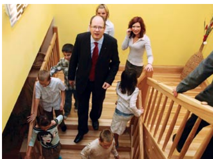
Prezydent osobiście odwiedził każdą placówkę.

Wszystkie są filiami dotychczasowej placówki na Orunii. Spotkanie rozpoczęło się w pierwszym nowym domku przy ul. Turystycznej 26A, następnie goście przejechali do dwóch kolejnych, które powstały przy ul. Wiosłowej 23 oraz Wiosłowej 25 w Gdańsku. W każdym z nowych domów zamieszka czternaścioro podopiecznych, w tym dzieci młodsze, w wieku szkoły podstawowej i gimnazjum. Placówki są nowocześnie wyposażone, a do dyspozycji dzieci są m.in. salony, pokoje dzienne, kuchnie, sale zabaw. W każdym domu całodobową opiekę sprawuje sześciu wychowawców. Dzieci mogą pozostać w placówkach do czasu usamodzielnienia się.