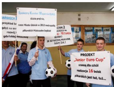
W tak oryginalny sposób radość manifestowali uczniowie.