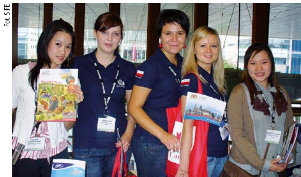
Drużyna Uniwersytetu Gdańskiego w Singapurze.