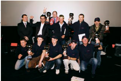
Prezydent świętował awans z żuźłowcami.