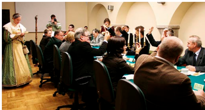
Pracownicy Muzeum przebrani byli w stroje z epoki.

Monika Kryger Dariusz Wołodźko