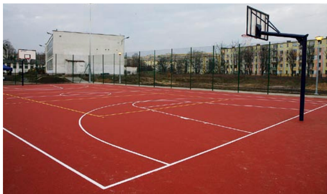
Na boisku wielofunkcyjnym można grać w różne gry zespołowe.

W skład gdańskiego kompleksu wchodzi boisko piłkarskie oraz boisko wielofunkcyjne wraz z niezbędną infrastrukturą techniczną. Całkowity