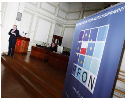
Prezydent rozpoczął konferencję.