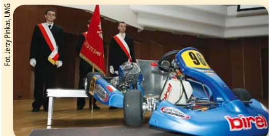
21 listopada świętowano 50 lat gdańskiej „samochodówki” – Zespołu Szkół Samochodowych im. 1 Brygady Pancerniej im. Bohaterów Westerplatte w Gdańsku. W ciągu półwiecza działalności szkoła wykształciła dwaście tysięcy absolwentów. Podczas obchodów prezydent Gdańska uhonorował placówkę Medalem Prezydenta Gdańska.