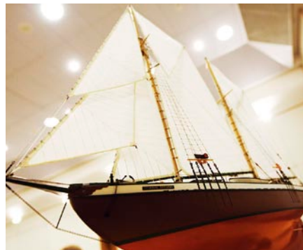
Tak będzie wyglądał zrewitalizowany żaglowiec.

Akcję można już dziś wesprzeć finansowo. Działa już specjalne konto, na którym będą gromadzone środki pochodzące ze społecznej składki: „Generał Zaruski” Bank Millennium