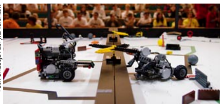
Eliminacje regionalne „First Lego League” odbywały się na Politechnice Gdańskiej.