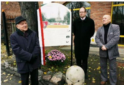
Pamiątkową tablicę odsonił prezydent Gdańska, a historię Oruni przybliżył prof. Andrzej Januszajtis.

kaniec dzielnicy, historyk Krzysztof Kosik. Na skrawku zieleni przy ul. Gościnniej udało mu się zebrać niezwykle kamienne eksponaty. Oprócz kamienia granicznego, młyńskiego żarna i fragmentów kamiennych przedprozy, jest tu również kulista osłona zbiornika wodnego umiejscowionego na jednym z oruńskich wzgórz, a nawet... płyta chodnikowa z najstarszego oruńskiego cmentarza i barokowy maszkaron. 5 listopada odbyło się uroczyste otwarcie Oruńskiego Lapidarium przy ul. Gościnniej 3.