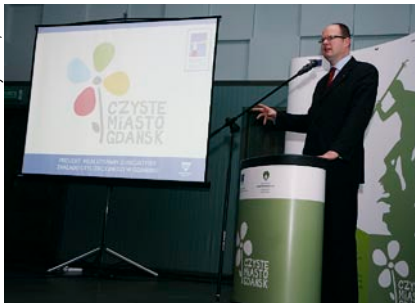
Niesegregowanie śmieci jest droższe – podkreślał prezydent Gdańska.