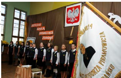
Sztandar z wizerunkiem patrona – Grzegorza Piramowicza.