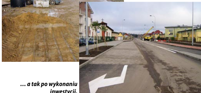
... a tak po wykonaniu inwestycji.