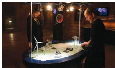
Znakomity pomysł na popularyzowanie nauk ścisłych.

Program Hewelianum, obejmujący wszystkie przedsięwzięcia zaplanowane na lata 2007-2011, opiewa na kwotę ok. 100 mln zł. Projekt finansowany jest z budżetu Miasta Gdańska, przy udziale dofinansowania ze środków UE.