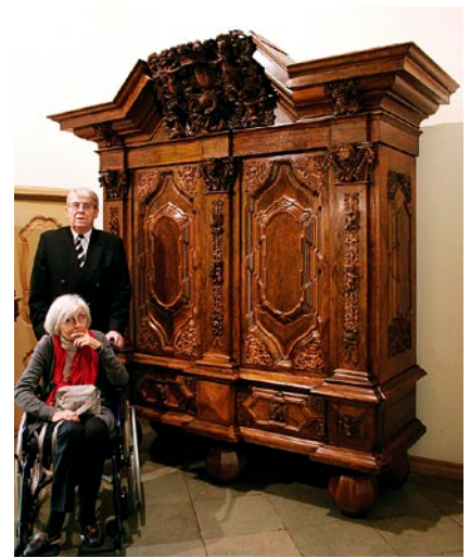
Szafę można oglądać w Domu Uphagena przy ul. Długiej 12.