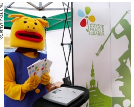
Eko-ludek rozdawał zeszyty za makulaturę.

Akcja, której organizatorem Zakład Utylizacyjny w Gdańsku, cieszyła się dużym powodzeniem wśród gdańszczan.