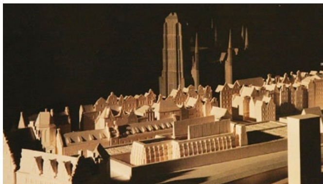
Makieta Gdańskiego Teatru Szekspirowskiego.

dla zwiększenia atrakcyjności Polski. Budowa Gdańskiego Teatru Szekspirowskiego będzie nawiązaniem do budynku pierwszego publicznego teatru istniejącego w Gdańsku od XVII do XIX wieku. Idea odbudowy Gdańskiej Szkoły Fechtunku - Teatru Elżbietańskiego jest żywa od prawie dwudziestu lat. Jej inicjatorami byli założyciele Fundacji Theatrum Gedanense.