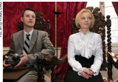
Najlepsi młodzi naukowcy Gdańska.