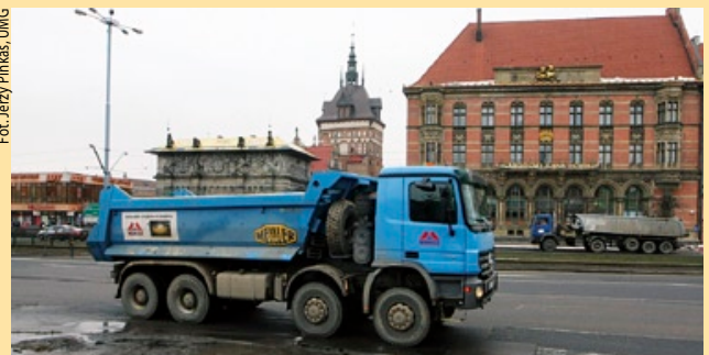
Jedna z ciężarówek wywożących torf z terenu budowy.