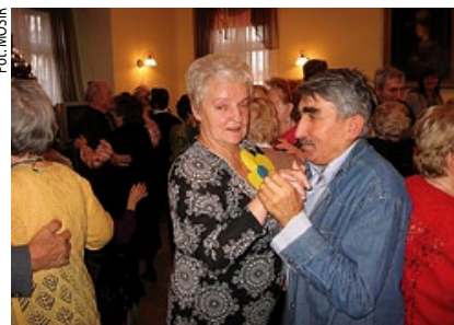
Tak bawili się seniorzy.

12 lutego w Dziennym Domu Pomocy „Pod Cisem” MOPS w Gdańsku przy ul. Sternicznej 2 odbyło się „Karnawałowe spotkanie seniorów” w formule tańca i zabawy. W imprezie udział wzięli uczestnicy ośrodków wsparcia dla osób w podeszłym wieku, czyli dziennych domów pomocy, klubów samopomocy, klubów seniora z Gdańska oraz osoby ze środowiska lokalnego. Na zabawę przybyło ok. 100 osób. W radosnym nastroju seniorzy bawili się w rytm karnawałowych przebojów. Taneczne spotkanie wzbogacone było w konkursy i zabawy integracyjne. Impreza była okazją do integracji osób starszych poprzez aktywne formy spędzania czasu wolnego w formule wspólnej zabawy i tańca. Organizator imprezy to Miejski Ośrodek Pomocy Społecznej w Gdańsku.