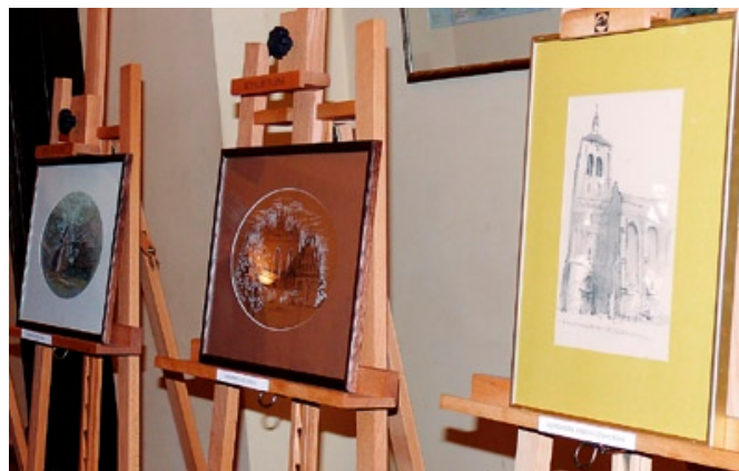
Trzy z prezentowanych obrazów.