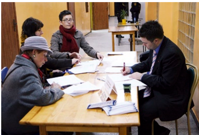
Dyżurujący przedstawiciel magistratu przyjmował wnioski od mieszkańców.

nadmorskiego. Wiesław Bielawski – zastępca prezydenta poinformował, iż kwestie związane z budową „wysokościowców” w tych rejonach będą omawiane z mieszkańcami dzielnicy. Poruszony został też problem „dzikich parkingów”, stworzonych przez samych mieszkańców. Tu komendant Straży Miejskiej przyjął zgłoszenie i zobowiązał się do podjęcia interwencji.