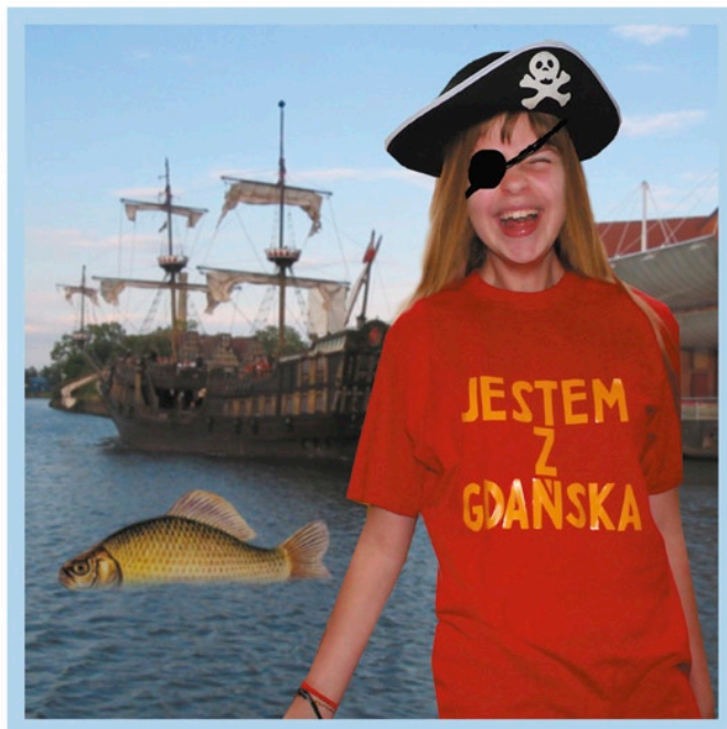
Tak wygląda okładka miniencyklopedii.

„Jestem z Gdańska” to kontynuacja cyklu komiksów – odpowiedników, które gdański MOPS wydał w roku ubiegłym przede wszystkim z myślą o osobach niepełnosprawnych intelektualnie. Służą one aktywizacji tej grupy zagrożonej wykluczeniem społecznym, mają ułatwić komunikację społeczną, samodzielne funkcjonowanie w społeczności