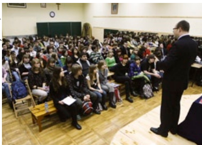
Uczniowie II LO na spotkaniu z prezydentem.