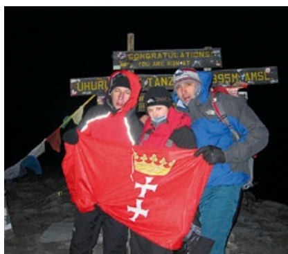
Gdańska flaga na szczycie Kilimandżaro.

Wyprawa gdańskich podróżników do Tanzanii trwała trzy tygodnie. Herb Gdańska towarzyszył im nie tylko na samym szczycie,