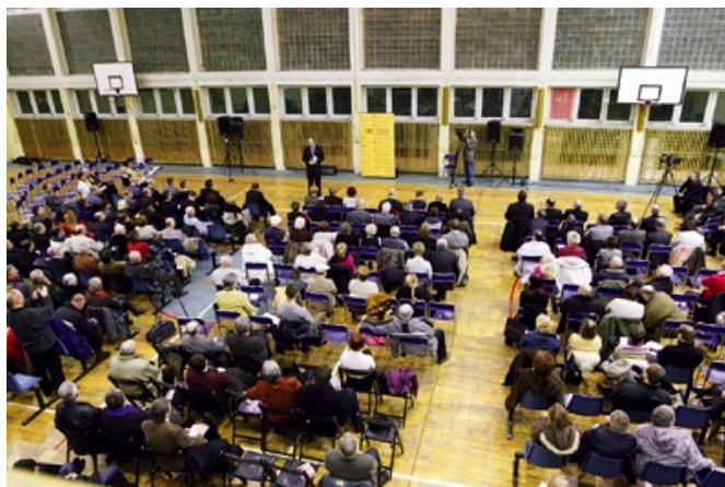
Na spotkanie przybyło wielu mieszkańców Zaspą.

Jedna z mieszkanki Zaspą zgłosiła zastrzeżenia do modyfikacji Wieloletniego Planu Inwestycyjnego, w rezultacie czego z listy planowanych inwestycji skreślono inwestycję na Zaspie. Prezydent porównując budżet miasta do budżetu domowego poinformował, iż WPI jest planem, który realizowany jest w miarę możliwości finansowych i potrzeb. W każdym domu zdarza się, że z jakiegoś