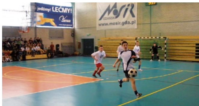
Halowy turniej piłki nożnej.

7 lutego młodzież po raz kolejny miała okazję zagrać na boisku ze sztuczną nawierzchnią przy ul. Traugutta 29 w turnieju promującym EURO 2012 w Gdańsku, z cyklu