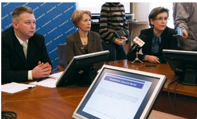
Stanowisko miasta w sprawie powołania spółki „Lechia Gdańsk SA” przedstawiono na briefingu 17 lutego.