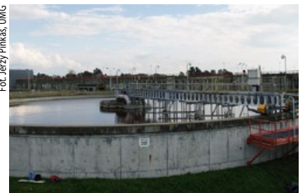
W ubiegłym roku obiekt odwiedziło 730 uczniów.