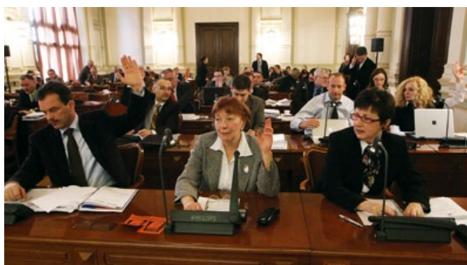
Radni Platformy Obywatelskiej podczas głosowania.