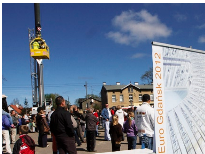
Na Letnicy specjalna platforma na dźwigu unosiła chętnych na wysokość 40 metrów!

nad 2 tysiące osób, w tym gwiazdy sportu, artystów i polityków.