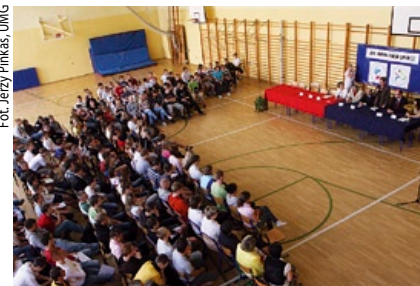
Debata odbyła się 30 kwietnia w ZSSO w Gdańsku.

Debata była zwieńczeniem projektu realizowanego przez szkołę w partnerstwie z Fundacją Roberta Schumanna. W ramach przedsięwzięcia uczniowie szkoły brali udział w marcowej sesji Rady Miasta Gdańska oraz w konkursie wiedzy o samorządach.