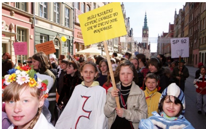
Barwny korowód młodych czytelników na ulicach Gdańska.