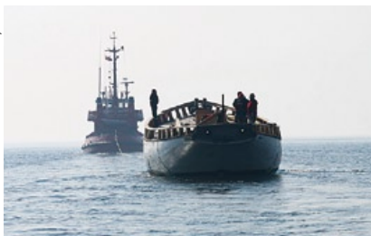
Podczas holowania z Władysławowa.