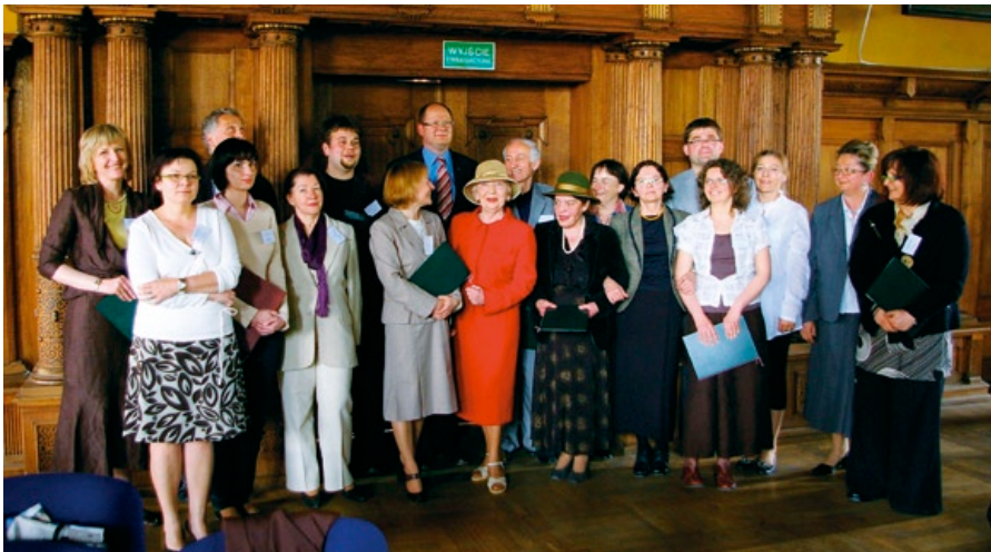
Sygnatariusze Porozumienia, które jest pierwszym takim dokumentem w naszym kraju. Gdańsk po raz kolejny jest pionierem w budowie społeczeństwa obywatelskiego.

Intencją partnerstwa jest działanie na rzecz ożywienia aktywności społecznej w obszarze dzielnic, budowanie tożsamości lokalnej i mechanizmów dialogu obywatelskiego. Przyczyni się ono do realizacji wspólnych działań i upowszechniania modelowych praktyk oraz rozwoju współpracy między samorządem lokalnym, organizacjami pozarządowymi i przedsiębiorcami.