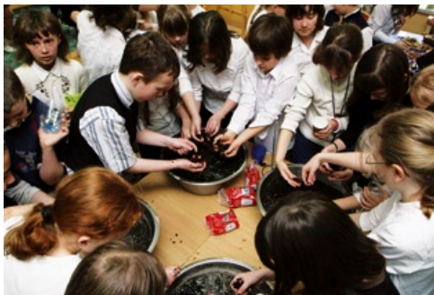
Poszukiwanie bursztynu w „solance”.

Do konkursu „Szkoła na bursztynowym szlaku” zgłosiło się w tym roku 30 szkół z całej Polski. Wśród nich Szkoła Podstawowa nr 86 z Gdańska, w której 1 kwietnia nastąpiła uroczysta inauguracja koła wiedzy o bursztynie. Wziął w niej udział m.in. Prezydent Miasta Gdańska.