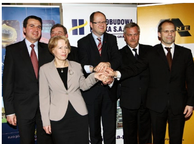
Pamiątkowe zdjęcie sygnatariuszy umowy na budowę gdańskiego stadionu w Letnicy.

Sprawną komunikacją i współpracą Biura Inwestycji Euro Gdańsk 2012 (spółka miejska odpowiedzialna za przeprowadzenie inwestycji) z gdańskim magistratem, Urzędem Wojewódzkim, Urzędem Marszałkowskim oraz wszystkimi instytucjami, których decyzje były niezbędne – pozwoliły na rozpo-