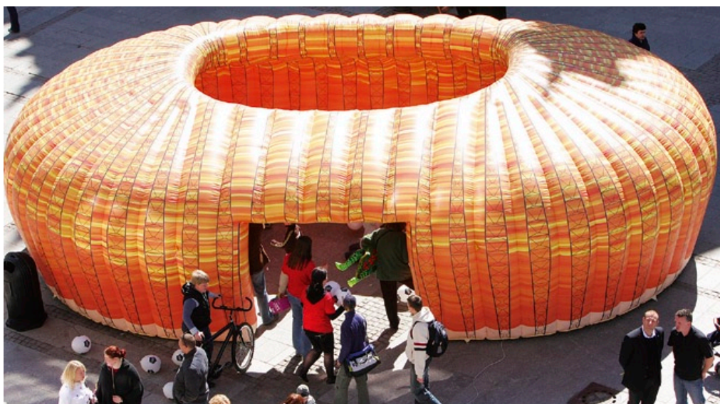
Na Długim Targu na czas festynu ustawiono namiot w kształcie stadionu.

Drugi festyn zgromadził tysiące gdańszczan na Długim Targu. Także tam czekało wiele atrakcji. Zagrały zespoły Mjut i Ptaki, rozegrano mecz Kibice Lechii vs. Lechia a patron medialny („Dziennik Bałtycki”) przeprowadził turniej piłkarzyków o puchar Redaktora Naczelnego. Niemalą atrakcją był również pokaz małych helikopte-