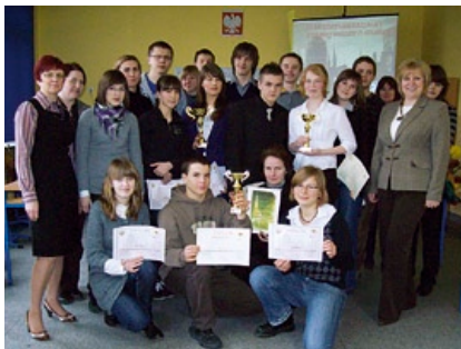
Zwycięzcy IV Turnieju Wiedzy o Gdańsku.