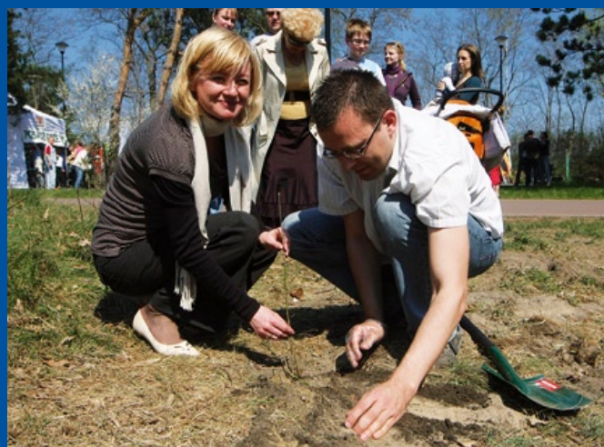
Każdy, kto posadził drzewko w Pasie Nadmorskim, mógł uzyskać potwierdzający to certyfikat.

Biuletyn Informacyjny Rady i Prezydenta Miasta Gdańska „HEROLD” dostępny jest także w na stronie www.gdansk.pl w zakładce Publikacje i Multimedia .