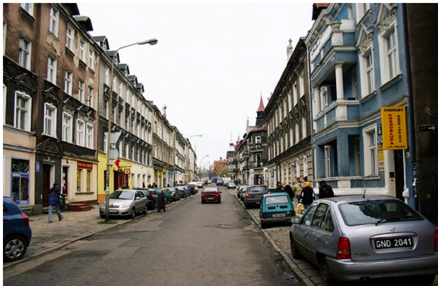
Ulica Wajdeloty we Wrzeszczu.

Od ponad roku w Urzędzie Miejskim w Gdańsku, w strukturach Wydziału Urbanistyki, Architektury i Ochrony Zabytków istnieje Referat Rewitalizacji.