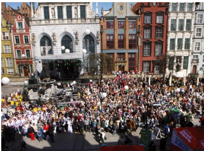
Wspólne zdjęcie gdańszczan przed Dworem Artusa.

Kulminacją imprezy było wspólne zdjęcie gdańszczan, które zgromadziło przed Dworem Artusa po-