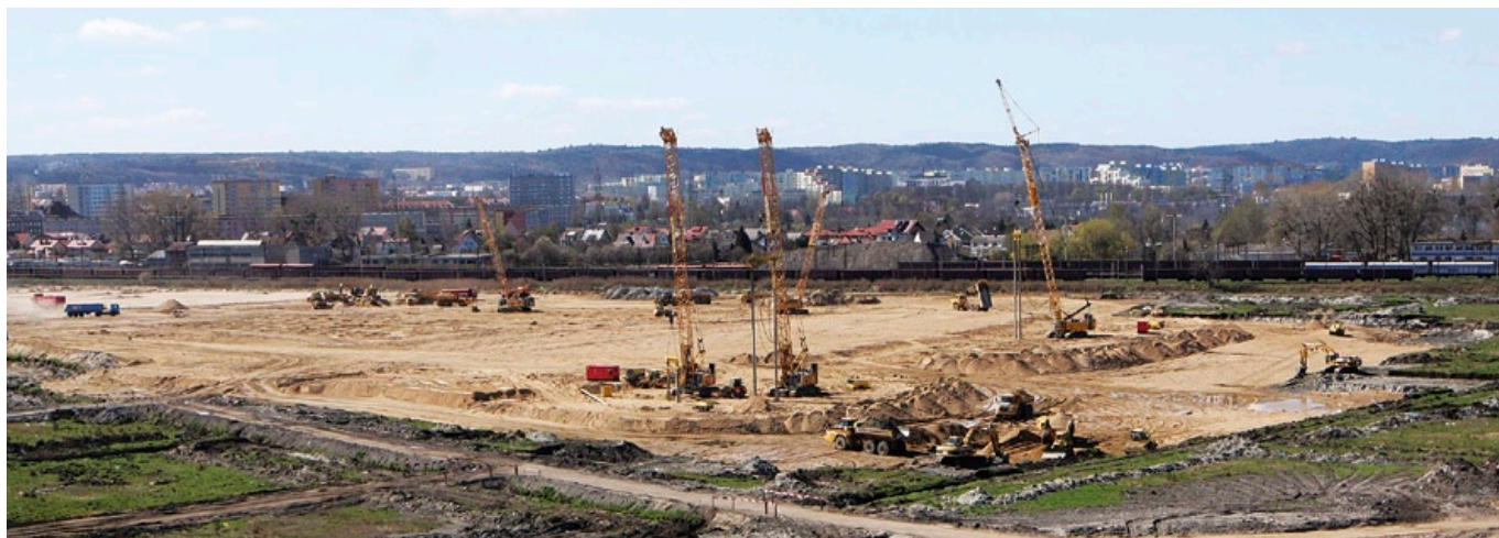
Na placu budowy.

Michał Kruszyński