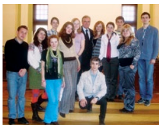
Zagraniczni goście z przewodniczącym Rady Miasta.

W ramach projektu Polskę odwiedzają wyróżniający się studenci z sąsiadujących państw. Ich zadaniem jest poznanie polskich doświadczeń w zakresie transformacji ustrojowych, sukcesów i porażek demokracji w Polsce. Podczas dwunastodniowego pobytu stażyci odwiedzili ośrodki życia akademickiego, jednostki administracji samorządowej i rządowej, redakcje mediów krajowych i lokalnych. Spotkali się także z przedstawicie-