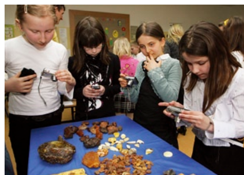
Takie okazy trzeba było sfotografować!