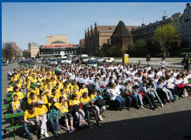
Rekordowa lekcja ekologii na Targu Węglowym.

ogrodowych – te liczby to wynik uczciwej wymiany – Drzewko za makulaturę. Akcja zorganizowana w ramach plenerowej imprezy Gdański Dzień Ziemi cieszyła się wielkim powodzeniem u Gdańszczan. Za każde pięć kilogramów surowca do recyklingu organizatorzy wydawali jedną sadzonkę. Na Targu Węglowym działało się naprawdę dużo, ponad zbiórkę makulatury - były występy artystyczne i konkursy. Gdański Dzień