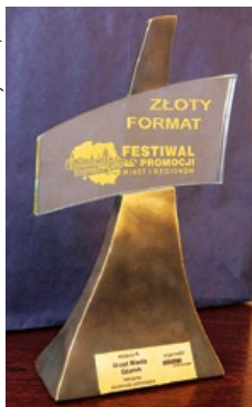
„Złoty Format” za zajęcie III miejsca.

Ostatecznie Gdańsk zajął trzecie miejsce w kategorii Grand Prix, ustępując miejsca jedynie Szczecinowi i Lublinowi. Nasze miasto wygrało tym samym kampanię reklamową o wartości 30 tys. zł na nośnikach Infoscreen w Warszawskim Metrze przyznanej przez firmę Ströer. Gdańsk znalazł się również w gronie miejsc, którym przy padła Nagroda Specjalna magazynu „Elle” – artykuł z cyklu „Zoom na miasto”.