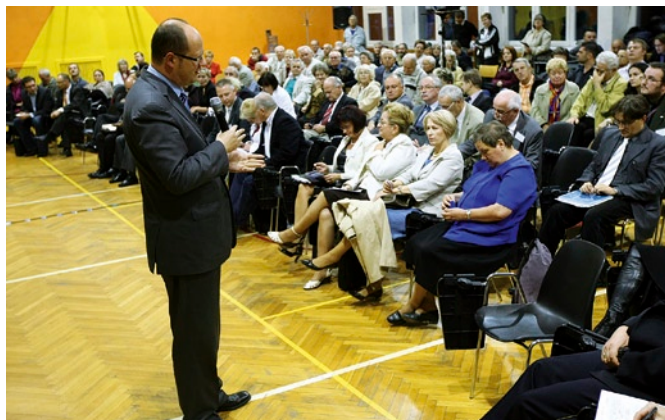
Prezydent omówił najważniejsze inwestycje w mieście i w dzielnicach.

odwiedził 22 z 30 dzielnic miasta. Spotkania nabrały stałej formuły: krótka prezentacja informująca o inwestycjach w mieście i w dzielnicach, prezentacja sondy ulicznej i – pytania mieszkańców.