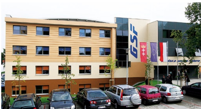
Gdańska Szkoła Floretu przy ulicy VII Dwór 6.