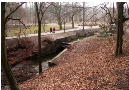
Jaz przed remontem...

W lipcu zakończono prace związane z regulacją Potoku Oruńskiego. Uregulowany został odcinek potoku o długości 650 m, licząc od ujścia do Kanału Raduni, znajdujący się w granicach Parku Oruńskiego.