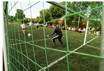
...i w Zespole Szkół Budownictwa Okrętowego.