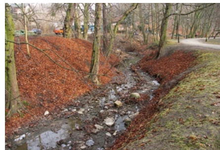
Odcinek środkowy potoku przed regulacją.