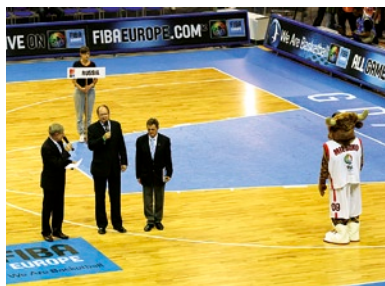
Oficjalne otwarcie EuroBasket 2009 odbyło się w Gdańsku.