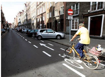
Już od pierwszego dnia z kontrapasa korzystali rowerzyści.