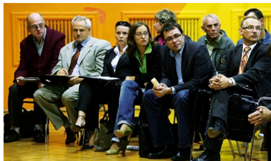
Na spotkaniu obecni byli radni z okręgu wyborczego Przymorza.

Jak powtarza prezydent Adamowicz: „wciąż jesteśmy społeczeństwem na dorobku i jeszcze długo nie będzie nas stać na remont każdej drogi i chodnika”. Z drugiej strony, mieszkańcy nie zawsze zdają sobie sprawę, że nie każdy problem może być rozwiązany przez Miasto. Wiele inwestycji zależy od prywatnych właścicieli terenów, często są to spółdzielnie mieszkaniowe. To kolejna wartość spotkania: informowanie mieszkańców, że w mieście nie wszystkie przedsięwzięcia podlegają urzędnikom.