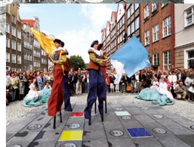
W czterech rogach Fontanny czuwają lwy.