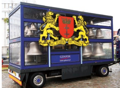
Mobilny carillon składa się z 48 dzwonów.

Mimo deszczowej pogody, wydarzenie to zgromadziło ponad tysiąc uczestników. Dzień Otwartej Rady Miasta to już tradycyjne spotkanie gdańskich radnych z mieszkańcami Miasta, które zapoczątkowano w 2004 roku. Poza możliwością bliższego zapoznania się ze specyfiką ich pracy, uczestniczący w wydarzeniu mieli okazję skorzysta z wielu dodatkowych atrakcji.