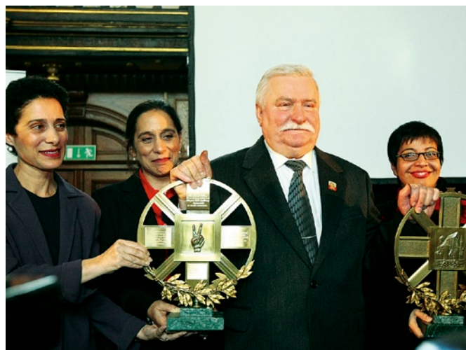
Lech Wałęsa z tegorocznymi laureatkami Nagrody jego imienia.