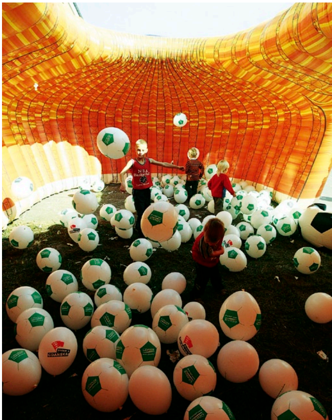
Dmuchała makieta stadionu sprawiła wiele frajdy najmłodszym.

Roboty na budowie idą zgodnie z harmonogramem. 460 osób pracuje od 7.00 do 22.00. Wylano już ponad 20 tysięcy z 70 tysięcy metrów sześciennych betonu, zużyto ponad 2,5 tysiąca z 6 tysięcy ton stali do tworzenia konstrukcji żelbetonowych. Z tworzeniem konstrukcji żelbetonowych budowniczy doszli do drugiej kondygnacji (wliczając piwnice i płytę boiska, stadion będzie liczył siedem poziomów).