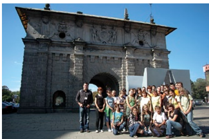
Gościom z Ukrainy podobało się nasze miasto.