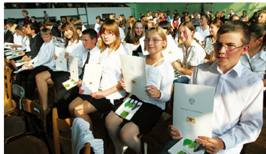
Najmłodszy uczniowie po przyznaniu stypendiów.