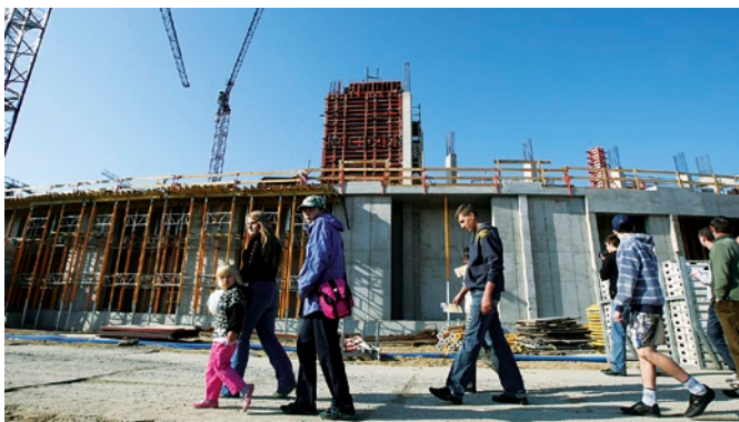
Z możliwości zobaczenia budowy skorzystało wielu gdańszczan.

scy mogli obejrzeć także siedzibę Biura Inwestycji Euro Gdańsk 2012, a na najmłodszych czekało całe mnóstwo atrakcji, m.in. zjeżdżalnie „Tor Wyścigowy”, „Dżungla”, boisko do piłkarzyków, bramka radarowo-