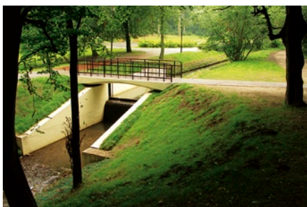
... i po remoncie.

Wyremontowano także istniejący jaz piętrzący wody dla potrzeb pobliskich stawów parkowych i wybudowano kładkę dla pieszych nad jazem. Regulacja zabezpieczy brzegi potoku przed rozmyciem i erozją, zmniejszy zamulenie Kanału Raduni w rejonie ujścia potoku, poprawiając stan zabezpieczenia przeciwpowodziowego w rejonie kanału. Zwiększeniu przepustowości koryta cieku ułatwi swobodny przepływ wody i przyczyni się do bezpiecznego odprowadzenia wód opadowych i roztopowych ze zlewni potoku do Kanału Raduni.