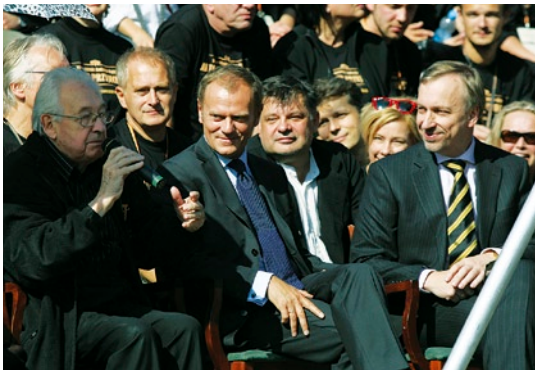
Honorowym patronem Fundacji Theatrum Gedanense jest Andrzej Wajda.

Przez godzinę raczyli zgromadzonych widzów z wybranymi przez siebie monologami i dialogami autorstwa Williama Szekspira. Aktorzy przyjechali do Gdańska na zaproszenie Andrzeja Wajdy – honorowego patrona Fundacji