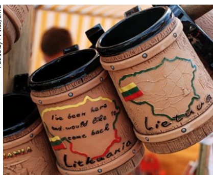
Na Targu Węglowym odbył się tradycyjny jarmark z produktami z Wilna.