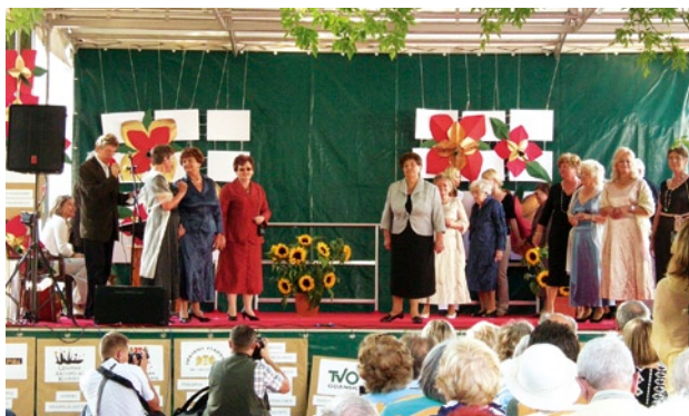
DPS „Ostoja” miał świetny pomysł na obchody piętnastolecia swojego istnienia.