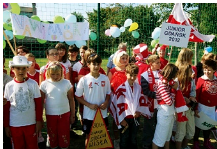
... w Szkole Podstawowej nr 80...