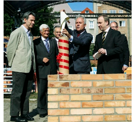
Wmurowanie kamienia węgielnego pod Gdański Teatr Szekspirowski.