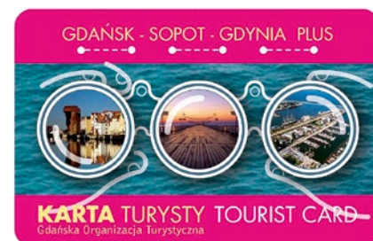
Karta Turysty została wyróżniona przez ekspertów.

Jest to pierwszy konkurs, w którym wyróżniono produkt Gdańskiej Organizacji Turystycznej. Karta Turysty „Gdańsk - Sopot - Gdynia - Plus” została więc zauważona i doceniona nie tylko przez turystów, ale też przez grono branżowych ekspertów. Przypomnijmy, że jest to pierwsza w kraju w pełni elektroniczna karta, która oprócz bezpłatnych wejść do trójmiejskich muzeów, zawiera bilet metropolitalny i turystyczny. Jej posiadacz może więc bez ograniczeń poruszać się środkami komunikacji miejskiej w Gdyni, Gdańsku i Sopocie oraz korzystać ze zniżek i rabatów w 150 punktach na terenie całego województwa pomorskiego. Kartę Turysty można nabyć w gdańskich i gdyńskich punktach Informacji Turystycznej.