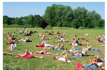
Wyginywanie ciała w Parku Nadmorskim.

Środki na wakacyjną rekreację w Parku Nadmorskim pochodziły z Gminnego Funduszu Ochrony Środowiska i Gospodarki Wodnej, a koszt przedsięwzięcia to ok. 20 000 złotych.