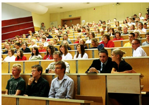
Przyszłorocznym maturzyści debatowali z prezydentem blisko dwie godziny.

Nie zabrakło też pytań bardziej osobistych: czy prezydent drugi raz także