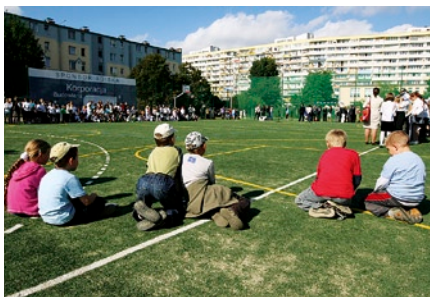
Nowe boisko w Szkole Podstawowej nr 79...