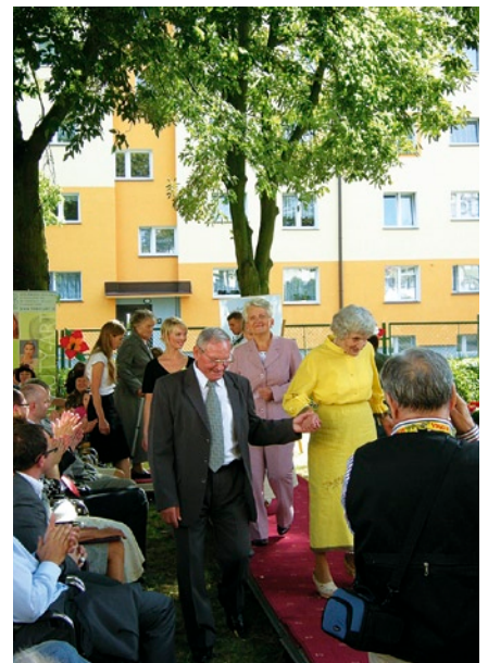
Seniorzy na wybiegu!

Celem przedsięwzięcia było rzucenie wyzwania stereotypom dotyczącym osób starszych i niepełnosprawnych oraz zwrócenie uwagi na ich potrzeby. Gratulujemy pomysłu, a cel został osiągnięty: wydarzenie relacjonowały prawie wszystkie trójmiejskie media.