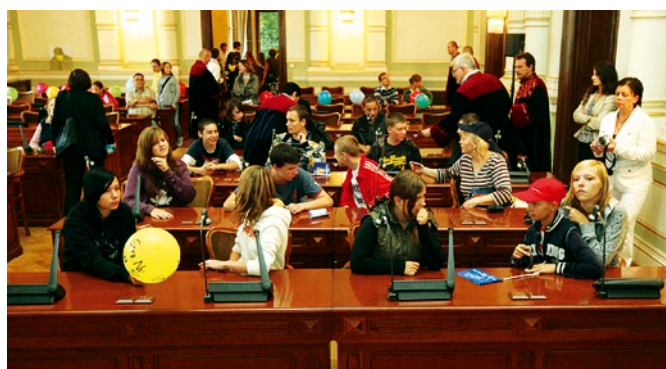
W Wielkiej Sali Obrad radni zaprezentowali m.in. system do głosowania.