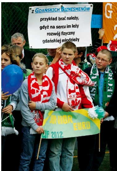
Wiele mówiący transparent uczniów Gimnazjum nr 2.

Oprac. Dariusz Wołodźko