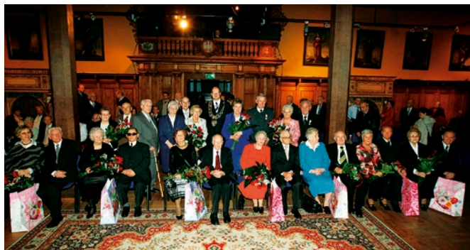
Jubilaci z prezydentem Gdańska.