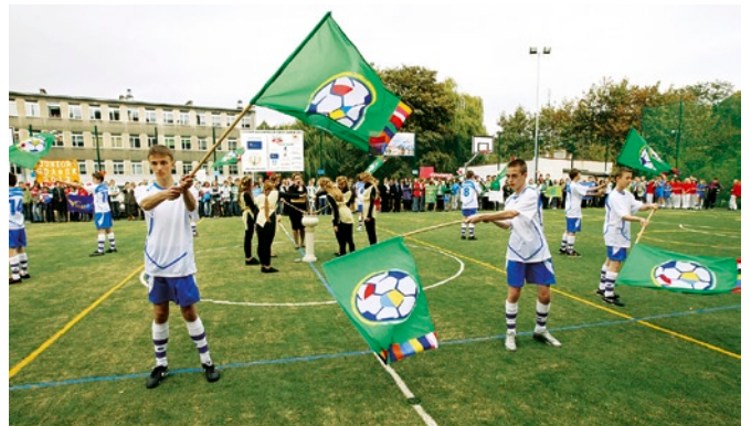
Feta z okazji otwarcia boiska przy Gimnazjum nr 2.