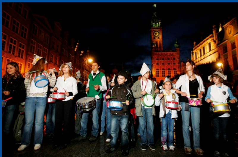
Otwarcie Galerii poprzedził przemarsz kilkudziesięciu „błaznawych bębenców” ulicami miasta.