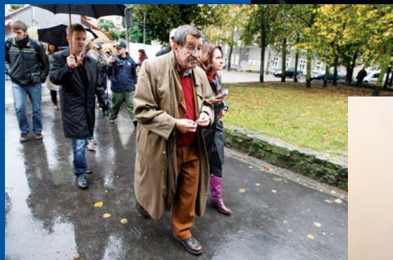
Spacer ulicami Wrzeszcza.