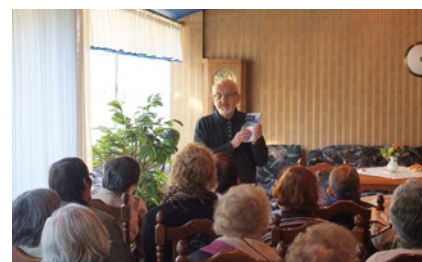
W spotkaniu z poetą wzięło udział 50 seniorów.

6 października w Domu Pomocy Społecznej przy ul. Polanki 121 odbyło się otwarte spotkanie ze Zbigniewem Jankowskim, autorem blisko 30 książek. Podczas spotkania poeta zaprezentował swoją twórczość oraz inspiracje, które miały na nią wpływ. Spotkanie było jednym z elementów kampanii społeczno-czytelniczej pod hasłem „Książka dla seniora”, którą od kilku lat prowadzą wspólnie Wojewódzka i Miejska Biblioteka Publiczna oraz Miejski Ośrodek Pomocy Społecznej w Gdańsku. Służy ona przede wszystkim aktywizacji sędziwych gdańszczan. W jej ramach znani mistrzowie pióra odwiedzają gdańskie domy pomocy społecznej i ich podopiecznych, czytają fragmenty ulubionych dzieł, dyskutują o współczesnej literaturze. Gośćmi seniorów byli już m.in. Krystyna Nepomucka, Andrzej Zaniewski, Lucyna Legut, Jerzy Samp, Olga Dębicka oraz Aleksander Jurewicz.