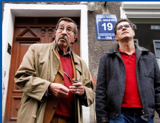
Günter Grass z synem przed kamienicą, w której się urodził i spędził dzieciństwo.

Biuletyn Informacyjny Rady i Prezydenta Miasta Gdańska „HEROLD” dostępny jest także w na stronie www.gdansk.pl w zakładce Publikacje i Multimedia .