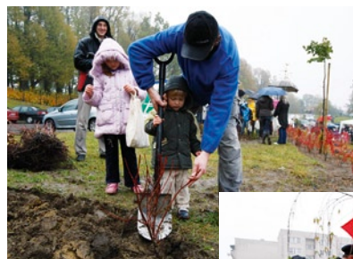
Drzewka sadzili i młodszy...