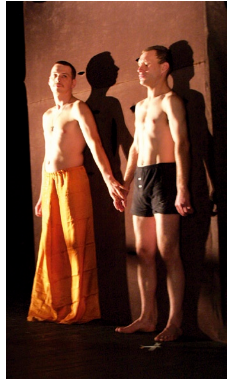
Na scenie zaprezentowało się siedem grup teatralnych.