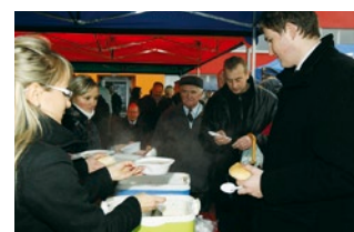
Integracja przy pysznej grochówce.

Michał Piotrowski