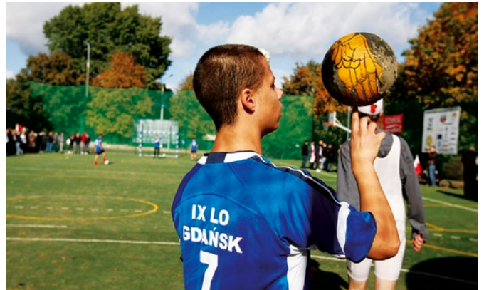
Nowe boisko przy IX LO w Gdańsku.