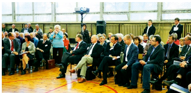
Spotkanie odbyło się 6 października w XV Liceum Ogólnokształcącym przy ulicy Pilotów 7.

Po kilkuminutowym wystąpieniu prezydenta Gdańska, mieszkańcy mieli możliwość zgłaszania problemów i uwag dotyczących życia w dzielnicy. Szczególnie interesowały ich kwestie związane z „pasem startowym”, który pozostaje niezagospodarowany. Prezydent przypomniał, że „pas startowy” nie jest własnością miasta, lecz należy