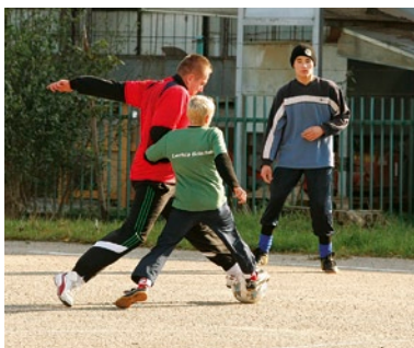
Najstarsi gracze turnieju urodzili się w latach siedemdziesiątych, a najmłodszy w latach dziewięćdziesiątych ubiegłego wieku.

Piłkarskiego ducha gdańszczan można było poczuć 17 października, gdy na boisku byłej szkoły podstawowej nr 22 przy ulicy Suchej w Gdańsku odbył się I Letnicki Turniej Piłki Nożnej.