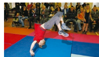
Uczniowie SP 16 przygotowali występy artystyczne.