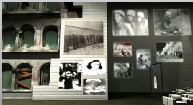
Zwycięski projekt pracowni Tempora SA.