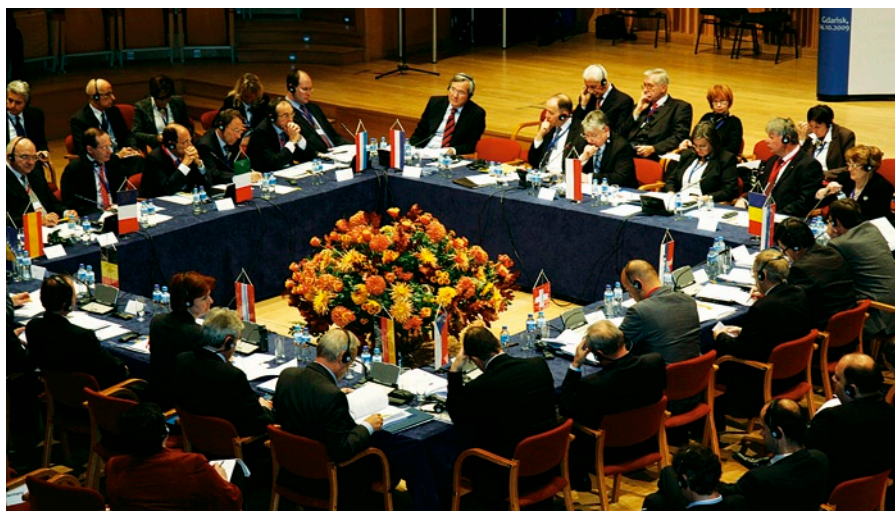
Uczestnicy spotkania wzięli udział w konferencji „Demokracja w Europie w dwadzieścia lat po pierwszych wolnych wyborach na wschód od Muru Berlińskiego - Europa w świecie w dwadzieścia lat po zimnej wojnie”. Konferencja odbyła się w Filharmonii Bałtyckiej.

Od złożenia kwiatów i zapalenia zniczy pod Pomnikiem Poległych Stoczniovców rozpoczęło się 23 października w Gdańsku „Nadzwyczajne Spotkanie Stowarzyszenia Senatów Europy”.