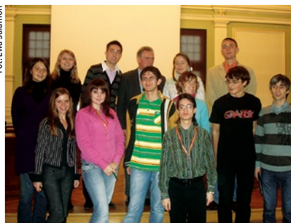
Przed studentami stoi teraz wyzwanie: zapoznać swoich rodaków z ideą samorządności

Tours to Poland, który został zainicjowany przez Polsko-Amerykańską Fundację Wolności i Fundację „Edukacja dla Demokracji”. W mieście opiekę nad studentami przejął Dom Pojednania i Spotkań, który od 2004 r. pełni rolę operatora przedsięwzięcia.