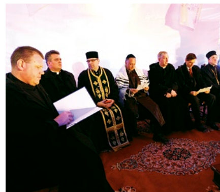
Wspólna, międzyreligijna modlitwa odbyła się na dziedzińcu franciszkańskiego kościoła pw. Świętej Trójcy w Gdańsku.

Edyta Tombarkiewicz