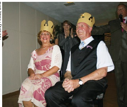
Tradycją jest wybór Króla i Królowej Balu.

5 października w Restauracji „Gospoda Gdańska” w budynku NOT odbył się IV Miejski Bal Seniora. Głównym organizatorem imprezy był Miejski Ośrodek Pomocy Społecznej w Gdańsku. Bal był także wspaniałą okazją, by podziękować aktywnym seniorom za ich udział i pracę na rzecz środowiska lokalnego. Pozwolił w sposób uroczysty świętować Międzynarodowy Dzień Seniora, przypadający 1 października. Uczestnikami przedsięwzięcia