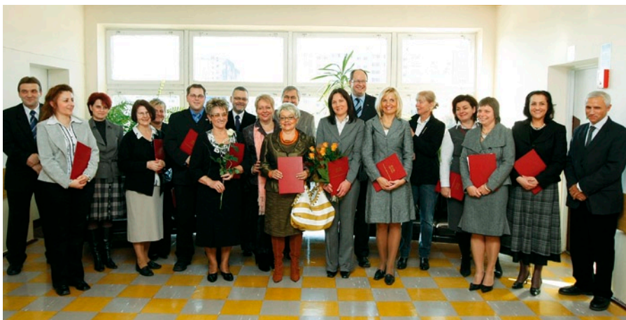
Laureaci pierwszej edycji „Nagrody Prezydenta Miasta Gdańska dla pracowników gdańskiej służby zdrowia”.

Jedenastu pracowników służby zdrowia otrzymało po raz pierwszy „Nagrodę Prezydenta Miasta Gdańska dla pracowników gdańskiej służby zdrowia”.