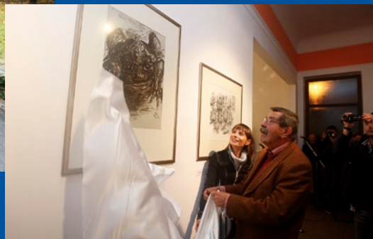
Noblista otworzył wernisaż swoich grafik podczas oficjalnego otwarcia Gdańskiej Galerii Güntera Grassa „4g”.