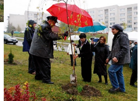
...i nieco starsi.