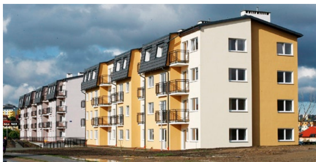
W nowo oddanych budynkach, oprócz mieszkań komunalnych, przewidziano również miejsce dla dwóch placówek opiekuńczo-wychowawczych.

Michał Piotrowski