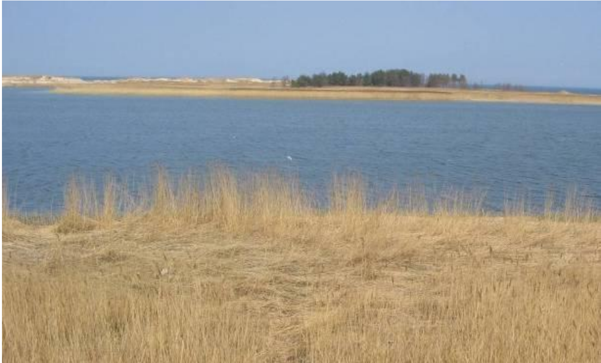
„Ptasi Raj”. Wyspa Sobieszewska

Obszar Chronionego Krajobrazu Wyspy Sobieszewskiej o powierzchni 1384 ha, obejmujący fragment Mierzei Wiślanej na całej jej szerokości. Najcenniejsze fragmenty obszaru objęto ochroną rezerwatową (rezerwaty Ptasi Raj i Mewia Łacha). Obszar Chronionego Krajobrazu Wyspa Sobieszewska, jako część Mierzei Wiślanej, stanowi fragment ważnego przymorskiego ciągu zieleni Gdańska oraz regionalnego systemu przyrodniczego strefy nadmorskiej rejonu Zatoki Gdańskiej.