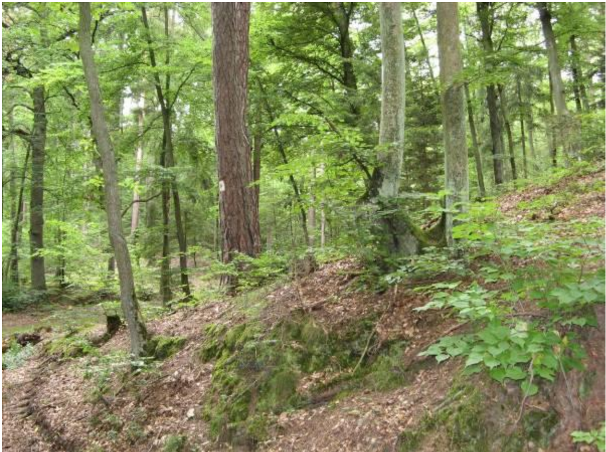
Trójmiejski Park Krajobrazowy

Trójmiejski Park Krajobrazowy utworzony w 1979 roku jako drugi w województwie gdańskim i jeden z pierwszych parków krajobrazowych w Polsce. Przedmiot ochrony stanowi specyficzna rzeźba terenu oraz szata roślinna. Powierzchnia TPK w granicach Miasta Gdańska 2341,8 ha, powierzchnia otuliny 2570,7 ha. Rozporządzenie Wojewody Gdańskiego z 8 listopada 1994 r. (Dz. Urz. Woj. Gdańskiego nr 27, poz. 139 z 1994 r.) szczegółowo określa przebieg granic parku oraz wprowadza zakazy, ograniczenia i obowiązki na terenie parku zgodnie z ustawą o ochronie przyrody.