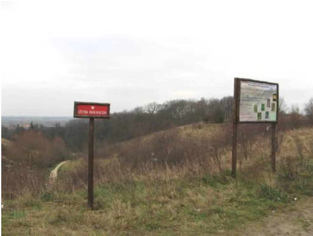
„Murawy kserotermiczne” w „Dolinie Potoku Oruńskiego”

Użytek ekologiczny „Murawy kserotermiczne w Dolinie Potoku Oruńskiego” o powierzchni 2,88 ha, utworzony w 1999 r., na terenie fragmentu doliny Potoku Oruńskiego, wyniesiony do 49 m n.p.m. Użytek powołano w celu zabezpieczenia muraw kserotermicznych, wraz z bogactwem ich flory i fauny. Z dwóch stron ograniczony przez erozyjne rozcięcia z drogami gruntowymi i zaroślami. Zbocza osiągają nachylenie do 40 stopni. Na terenie muraw stwierdzono występowanie dobrze wykształconych płatów muraw kserotermicznych, 232 gatunków roślin naczyniowych, w tym liczną grupę roślin ciepłolubnych niewystępujących na innych terenach naszego regionu.