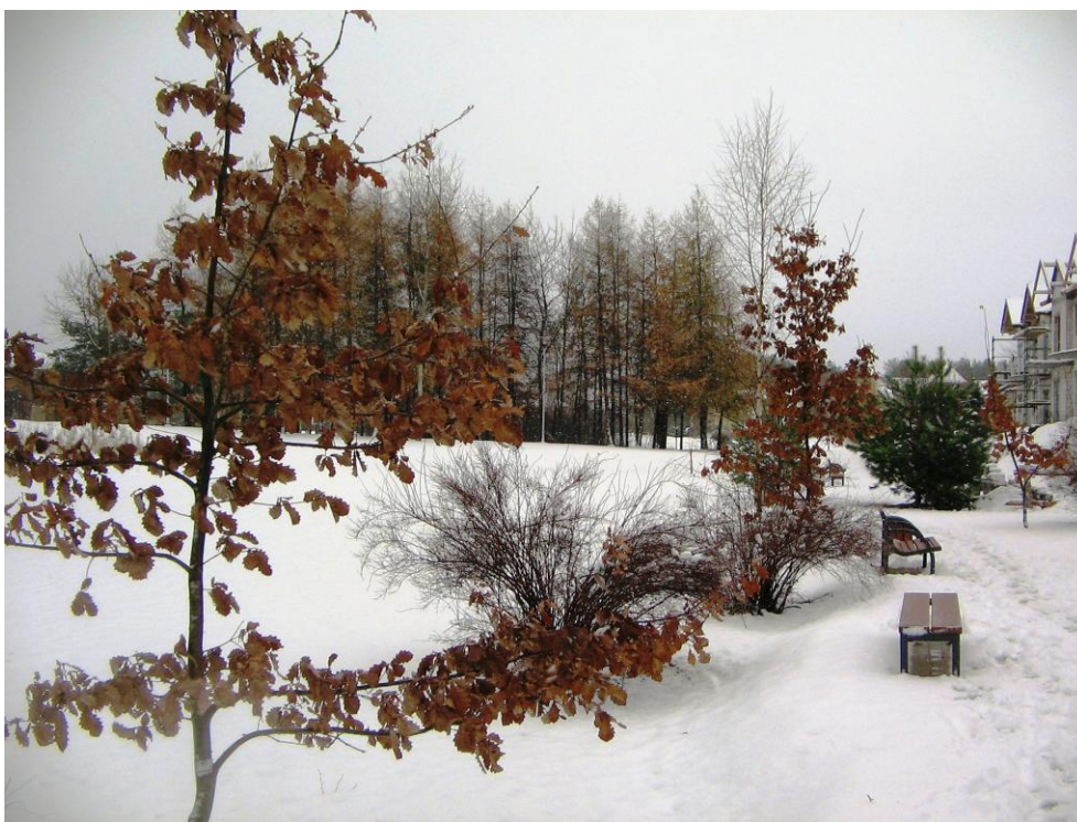
Zieleniec „Chirona” zimą