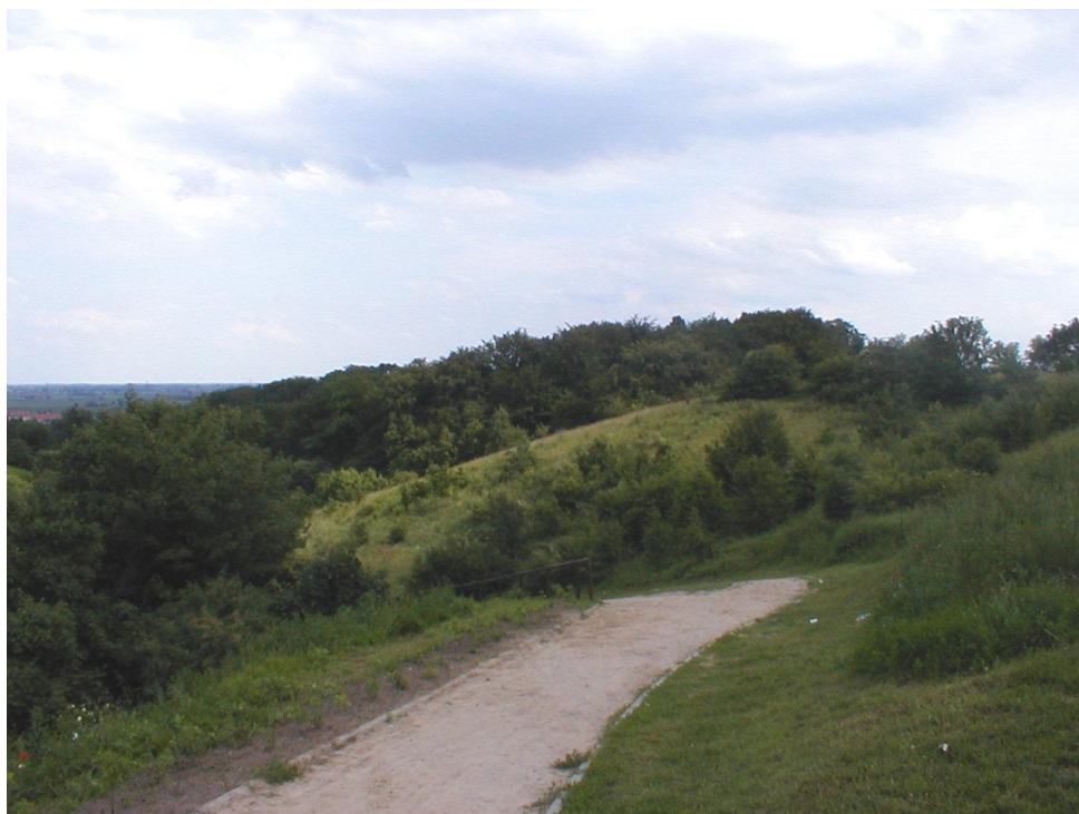
Ścieżka łącząca osiedle Orunia Górna z Parkiem Oruńskim