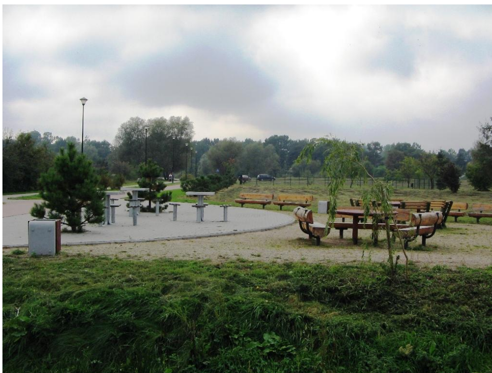
Miejsce do gry w szachy przy alei pieszo-rowerowej w parku im. R. Reagana