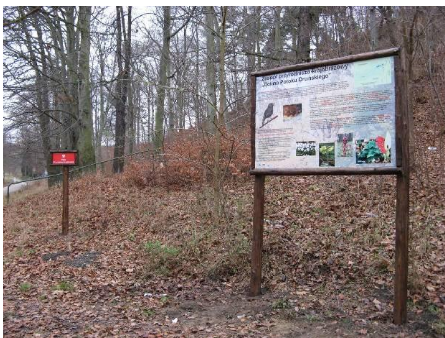
Zespół przyrodniczo-krajobrazowy „Dolina Potoku Oruńskiego”