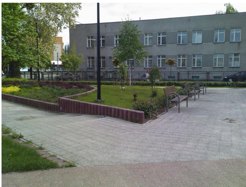
Stogi - zieleniec wypoczynkowy