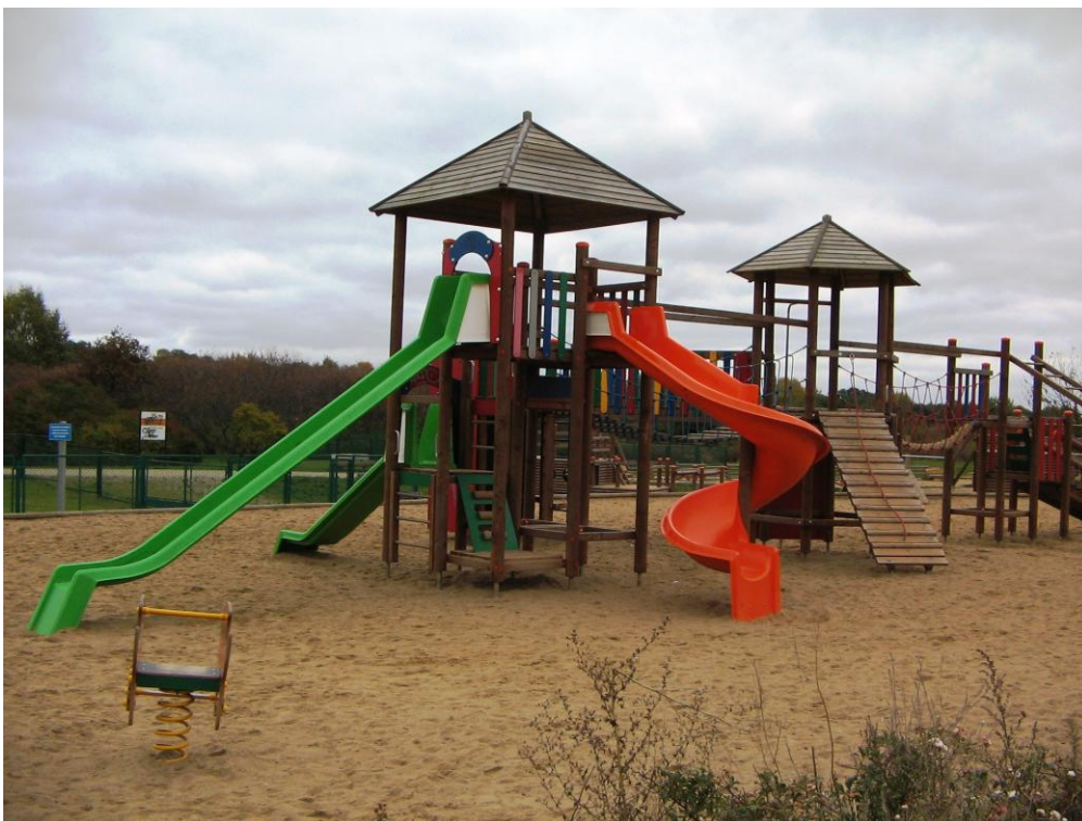
Urządzenia zabawowe w Pasie Nadmorskim