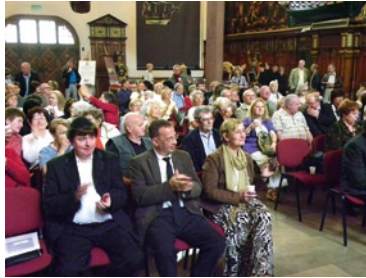
Dwór Artusa zgromadził pierwszego dnia liczną publiczność.