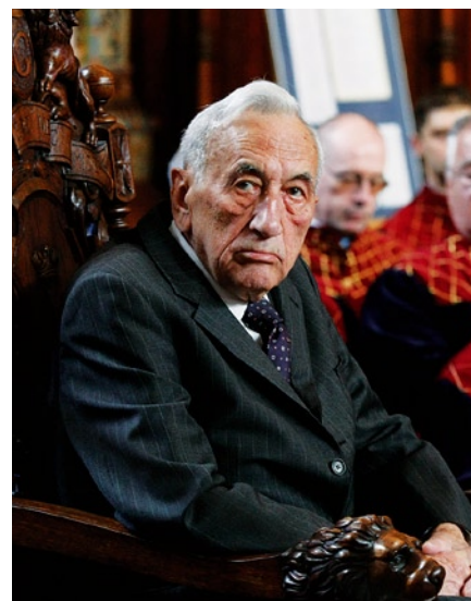
Tadeusz Mazowiecki podczas uroczystej sesji Rady Miasta Gdańska.

W uroczystości wzięli również udział prezydent Lech Wałęsa, Aleksander Hall, marszałek Senatu Bogdan Borusewicz, abp Tadeusz Gocłowski. Tadeusz Mazowiecki dziękując za