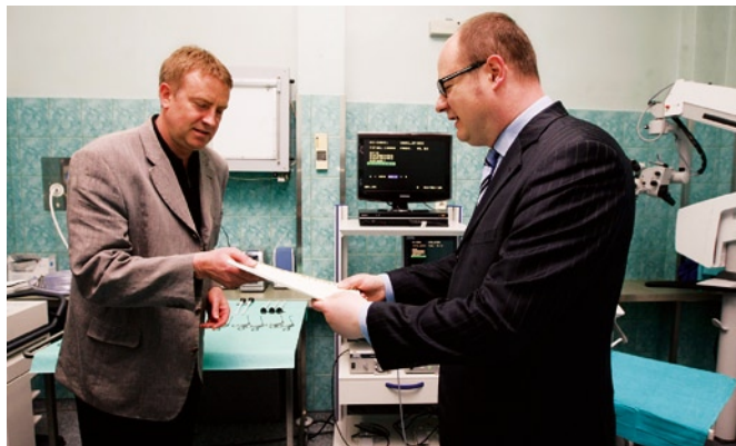
Prezydent Paweł Adamowicz przekazuje sprzęt medyczny doktorowi Piotrowi Zaorskiemu – ordynatorowi Oddziału Otolaryngologii.

Od roku 2001 na zakup sprzętu medycznego przeznaczone zostały środki w wysokości ponad 1 830 000 zł. Specjalistyczny sprzęt przekazany został do: