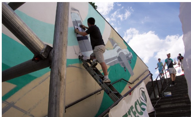
Pomalowano też zejścia do tunelu.