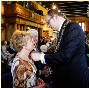
Prezydent odznaczył Jubilatów okolicznościowymi medalami.

16 czerwca w Nadbałtyckim Centrum Kultury w Gdańsku odbyły się uroczystości jubileuszowe par małżeńskich.