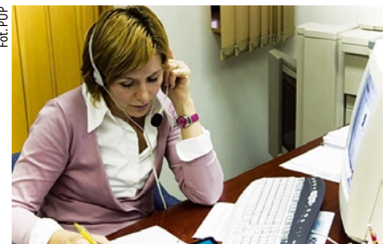
Umówić telefonicznie można się pod numerem 58 732-52-26, w godz. 12:00-15:00.

W ramach usługi osoba zainteresowana uzyskaniem zaświadczenia umawia się telefonicznie (tel. 58 732-52-26, w godz. 12:00-15:00) z pracownikiem PUP na dogodny termin odebrania pisma. W trakcie rozmowy osoba bezrobotna otrzymuje dokładny termin spotkania i także numer pokoju, w którym winna się stawić w celu odbioru zaświadczenia. Po zaświadczenia zgłasza się ponad 100 osób dziennie.