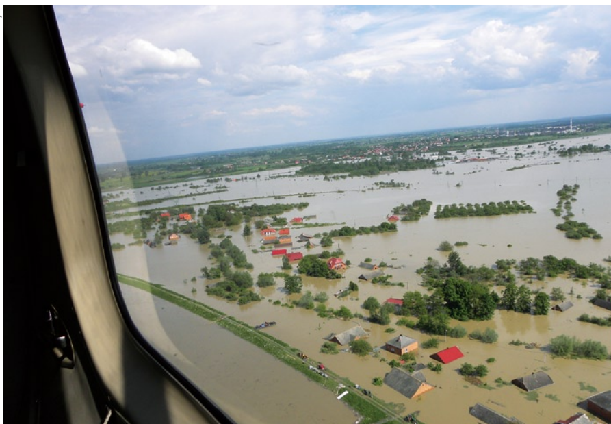
Spustoszenia wywołane przez powódź.