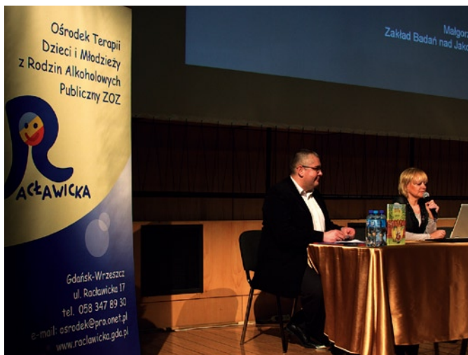
Konferencja odbyła się w Klubie „Żak”.

21 maja w „Żaku” odbyła się konferencja „Współczesne wyzwania dla rodziny”, zorganizowana przez Ośrodek Terapii Dzieci i Młodzieży z Rodzin Alkoholowych w Gdańsku, Fundację Psychologiczną oraz Wydawnictwo EneDueRabe.