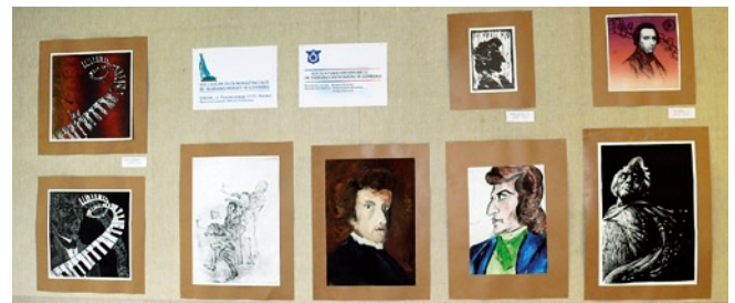
Galeria Sztuki Dziecięcej w Druskiennikach.

Oprac. Dariusz Wołodźko