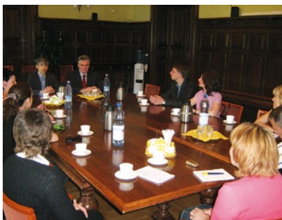
Program wizyty był realizowany w ramach „Study Tours to Poland” Polsko-Amerykańskiej Fundacji Wolności.