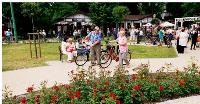
Założono nowe kwietniki i trawniki, wymieniono nawierzchnię alejek parkowych.

od 2001 roku i kosztowały budżet miasta łącznie ponad 8 mln zł. Park zyskał również taras wypoczyn-