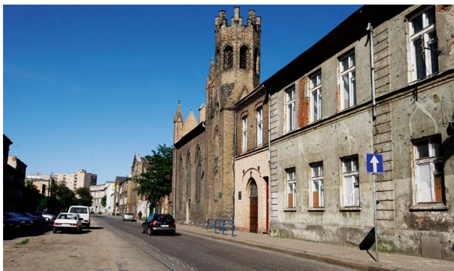
Projekt rewitalizacyjny obejmie także ulicę Łąkową.

Rewitalizacja Nowego Portu. Przedsięwzięcia realizowane na obszarze rewitalizowanego Nowego Portu to adaptacja, rewaloryzacja i przebudowa budynku dawnej Łaźni na potrzeby CSW „Łaźnia” przy ul. Strajku Dokerów 5, na Centrum Aktywizacji Kulturalnej na potrzeby prowadzenia działań artystycznych, kulturalnych i aktywizujących społeczność lokalną przez CSW Łaźnia oraz organizacje społeczne i mieszkańców dzielnicy. Ponadto planowana jest przebudowa i modernizacja Placu Ks. Jana Gustkowicza w zakresie m.in.: nowej nawierzchni placu i przestrzeni ulicznych, chodników, zieleni niskiej oraz zaaranżowania placu jako przestrzeni atrakcyjnej dla dzieci, młodzieży i osób dorosłych. Inwestycje te zwiększą bazę lokalową i przestrzenną dla działań społecznych, kulturalnych i artystycznych. Działania społeczne rozbudują i wzmocnią kapitał społeczny Nowego Portu poprzez aktywizację mieszkańców, zmniejszenie nasilających się problemów społecznych, zwiększenie liczby organizacji pozarządowych działających w dzielnicy, poszerzenie oferty społecznej, kulturalnej, rekreacyjnej, artystycznej itp. Planowany koszt realizacji to 20,6 mln zł, dofinansowanie wyniesie około 11,3 mln zł.