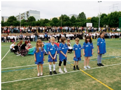
Dziesiąty „Junior” - boisko przy ZKPiG nr 20.