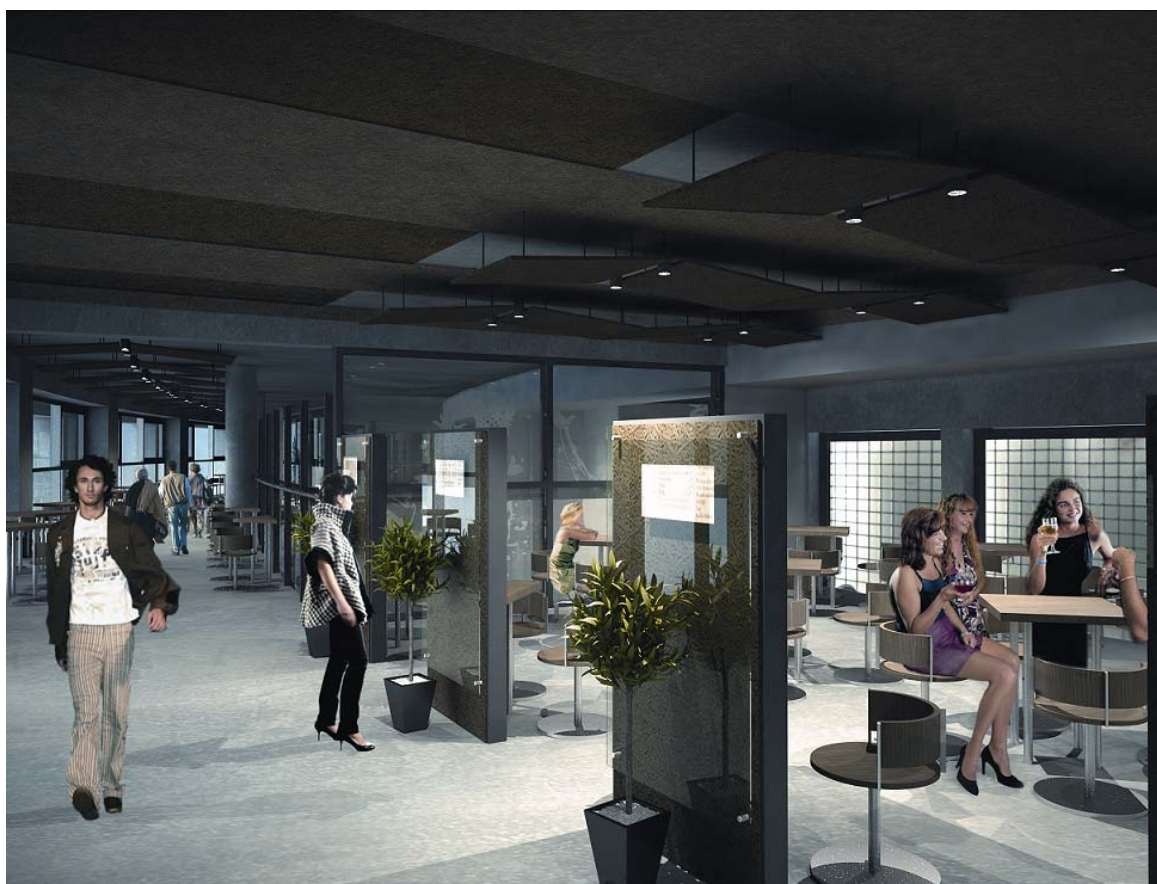
Wizualizacja wnętrza pubu w Hali

Obiekty te zaprojektowane są z przeznaczeniem na wynajem. Najemca w ramach swojego obszaru, zobowiązany będzie do całkowitego wykończenia i wyposażenia swojego obiektu i rozprowadzenia wszystkich mediów do poszczególnych punktów ich poboru.