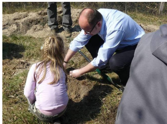
Znany Gdańszczanin sadzi drzewo.