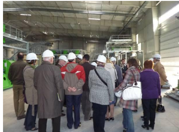
wizyta studyjna członków FLA21