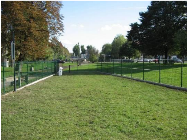
Gdańsk. Wybieg dla psów