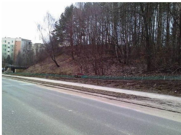
Niedźwiednik. Płotki przy ulicy Góralskiej