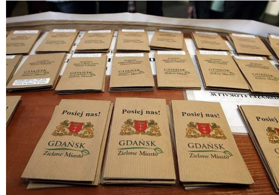
Prezydent miasta Gdańska rozdaje nasiona kwiatów wśród mieszkańców.