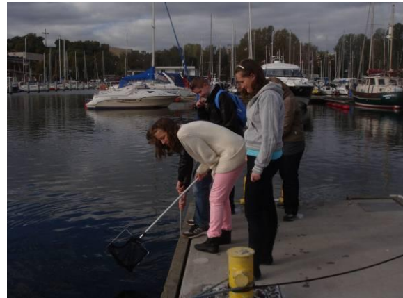
Zdjęcia z Akwarium Gdyńskiego Morskiego Instytutu Rybackiego w Gdyni