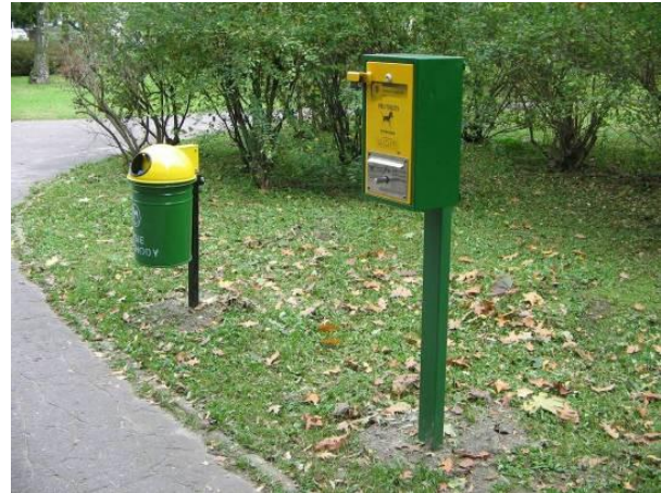
Strzyża „Psia toaleta”