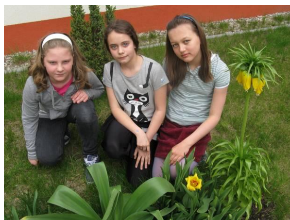
zdjęcia ze Szkoły Podstawowej Nr 44 i Szkoły Podstawowej Nr 12, uczestniczących w projekcie