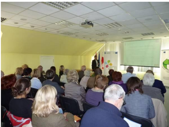
wizyta studyjna członków FLA21