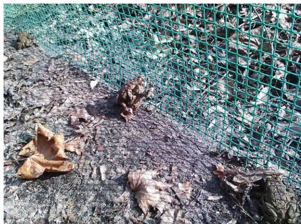
Wrzeszcz. Żaby na płotku w Dolinie Królewskiej