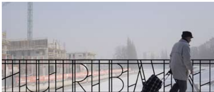
Praca autorstwa Berta Theisa

Dolne Miasto to wyjątkowa część Gdańska, nie tylko w skali Pomorza czy Polski, ale w skali Europy. Eklektyczne i secesyjne kamienice z XIX wieku i stare budynki przemysłowe sąsiadują tu z dwa wieki starszymi fortyfikacjami ziemno-wodnymi, rozlokowanymi wzdłuż opływu Motławy.