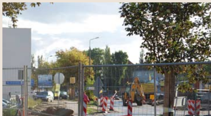
Trasa Słowackiego / ul. Hynka