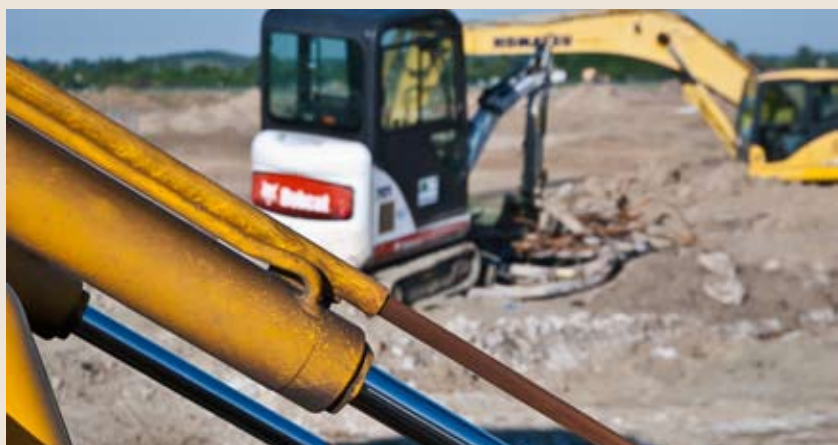
fol. Mateusz Ptak