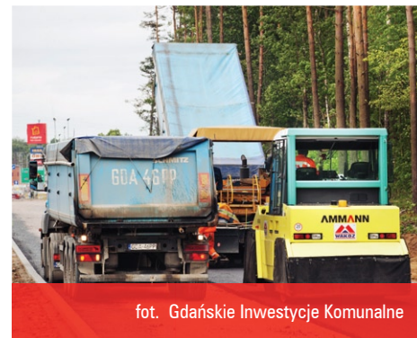
fol. Gdańskie Inwestycje Komunalne

We wrześniu 2011 roku stan zaawansowania prac przy budowie I zadania Trasy