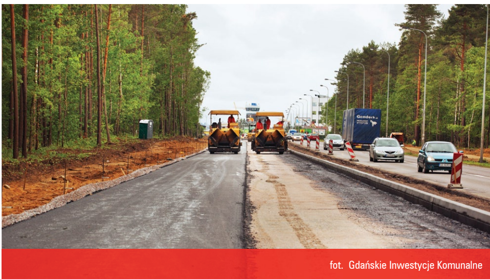
fol. Gdańskie Inwestycje Komunalne

powstają ekrany akustyczne na długości około 830 metrów. Część inwestycji to droga rowerowa, zlokalizowana po północnej stronie ulicy Słowackiego, z uwzględnieniem włączenia do ruchu w miejscach skrzyżowań z sąsiednimi drogami. Wzdłuż drogi powstają chodniki dla pieszych. Na odcinku od ulicy Spadochroniarzy do ulicy Budowlanych powstają nowe wiaty przystankowe w zatokach autobusowych. Wzdłuż planowanej trasy budowane są urządzenia bezpieczeństwa ruchu, w tym bariery energochłonne, oznakowanie i sygnalizacja świetlna.