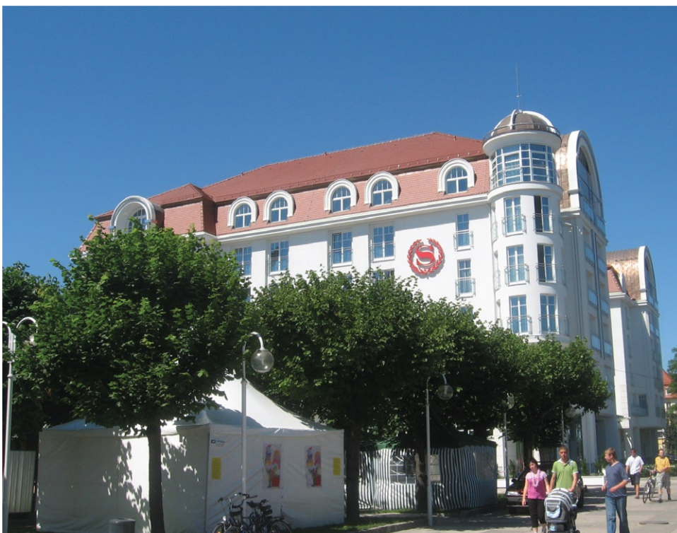
Sopot – miasto w Gdańskim Obszarze Metropolitalnym