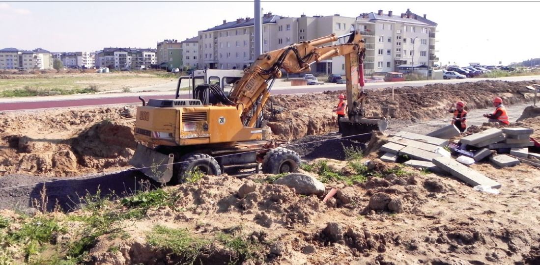
Okolice ulicy Rogalińskiej, układanie podbudowy pod nową linię tramwajową