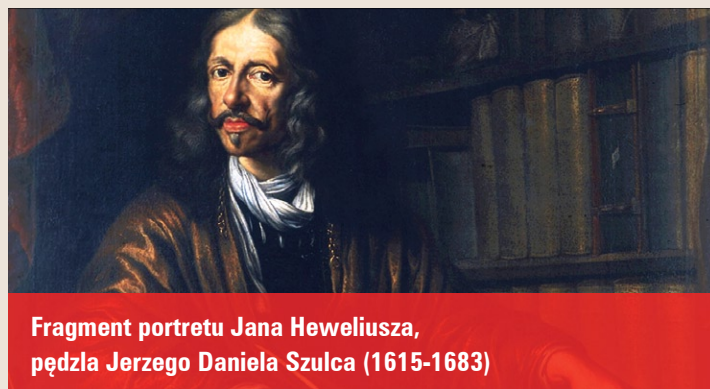
Fragment portretu Jana Heweliusza, pędzla Jerzego Daniela Szulca (1615-1683)

Heweliusz był protestantem, Kochański – katolikiem. Połączyło ich zamiłowanie do astronomii i matematyki. Korespondowali ze sobą, a Kochański, królewski matematyk, spędził siedem lat życia w grodzie nad Motławą, najpierw konferując z mistrzem, potem – już po jego śmierci – badając jego spuściznę, częściowo odtworzoną po pożarze, który wybuchł 26 września 1679 roku, 8 lat przed śmiercią wielkiego astronoma. Po pożarze uczeni nadal pisali do siebie na tematy naukowe, ale nie bez osobistych wątków. Kochański starał się pocieszyć i wesprzeć Jana, a Heweliusz – choć ubolewał nad poniesionymi stratami i szukał przezeń protekcji u króla, dzielił się także swoimi przemyśleniami. To wtedy napisał najpiękniejsze bodaj słowa, wyrażające całą jego osobowość.