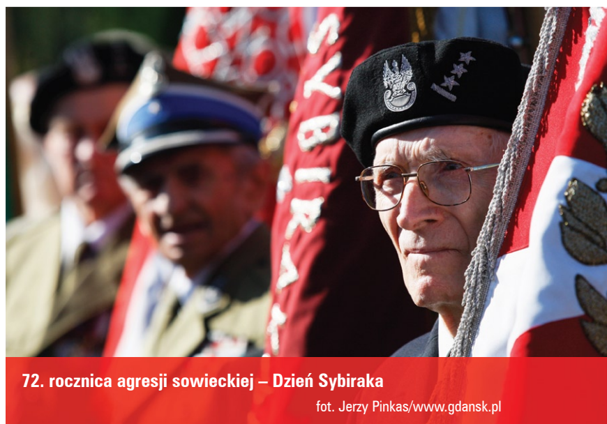
72. rocznica agresji sowieckiej – Dzień Sybiraka