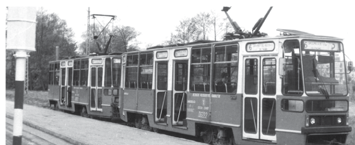
Tramwaje typu 105N pojawiły się w Gdańsku w roku 1975. Do roku 1990 dostarczone 228 nowych pojazdów. W roku 1990 stanowią wraz z wymienionymi za przegubowe 102Na – 46 dodatkowymi wagonami z Krakowa 100% taboru. Jeltkowo – 1978 rok