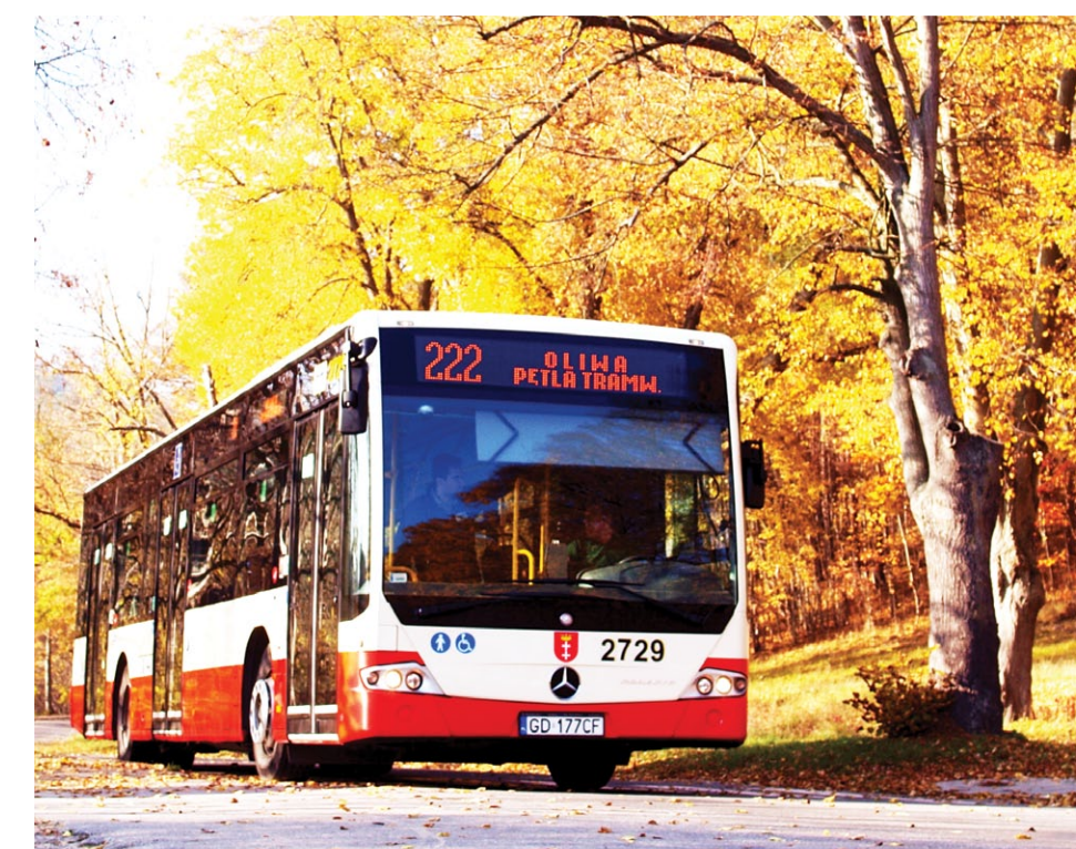
Mercedes Conecto LF. Gdańska flota autobusowa to ponad 200 pojazdów, w 100 proc. niskopodłogowa i w 80 proc. klimatyzowana. Jedna z najmłodszych w kraju

Z każdą dekadą następował coraz szybszy rozwój połączeń autobusowych i w latach 70-tych przewozy autobusami przewyższy-