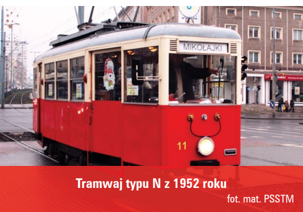
Tramwaj typu N z 1952 roku

Szczegółowe informacje oraz rozkład jazdy znajdują się na stronie www.zkm.gda.pl lub www.pssm.org.pl .