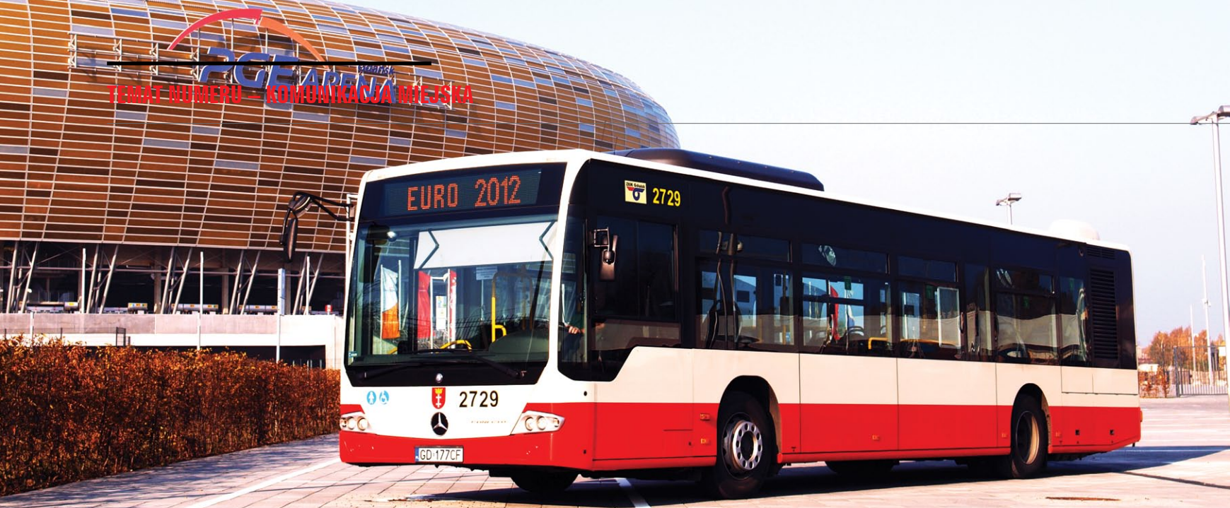
Mercedes Conecto LF pod stadionem PGE Arena w Gdańsku. Wszystkie autobusy ZKM są dziś niskopodłogowe

➔ Modernizację przeprowadza firma Modertrans Poznań. W gdańskim taborze są 4 niskopodłogowe Citadis Ngd99 (Michał Tusk w „Gazecie Wyborczej” z 29 października 2010 roku podaje, że są to najszybsze gdańskie tramwaje – rozpędzają się do 80 km/h, a pozostałe „tylko” do 70), 2 zestawy tramwajowe typu „114 Na” z chorzowskiego Konstalu i 36 uznawanych dziś przez niektórych za zabytkowe „105 Na” także z Konstalu. Te ostatnie parkują wyłącznie w zajezdni w Nowym Porcie. „105 Na” to konstrukcja z lat 70-tych XX wieku, ale myśl techniczna, na których oparto budowę tego pojazdu, sięga lat 30-tych. „105 Na” nie kursuje do południowych dzielnic, położonych wyżej, bo mógłby tam jedynie wjechać – zbyt słabe hamulce uniemożliwiłyby mu powrót.