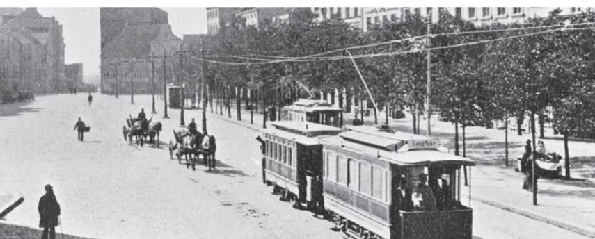
Pierwsze tramwaje elektryczne na Targu Węglowym. Jako doczepy dawne wagony tramwaju konnego. Rok 1899

Tę historię w obrazkach zawdzięczamy Mariuszowi Uziębło z ZKM Gdańsk Sp. z o.o. Dziękujemy. Dla pasjonatów – smaczek w „Heroldzie” elektronicznym na stronie www.gdansk.pl . Znajdziecie tam mapkę pokazującą rozwój sieci tramwajowej w Gdańsku od 1873 do 2011 roku. Gratka dla koneserów.