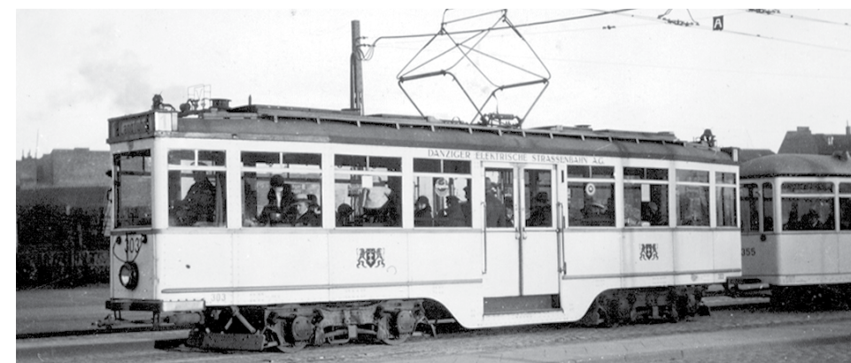
Błędnik – 1938 rok. Jeden z najnowocześniejszych wagonów tramwajowych Europy lat 30-tych XX wieku. Siedzenia wyłożone skórą, niskopodłogowe wejście i przedsiónek to znak nowych czasów przerwanych II wojną światową

Na terenie Gdańska działa trzech operatorów. Są to spółki, które wożą pasażerów. Największa to Zakład Komunikacji Miejskiej (ZKM) – spółka, w której Gdańsk ma 100% udziału. Pod szyldem ZKM jeżdżą w Gdańsku wszystkie tramwaje i ponad 80% autobusów – te, które poruszają się w granicach miasta. Do Chwaszczyna i Sopotu jeździ warszawska spółka Warbus (linie 117, 122,