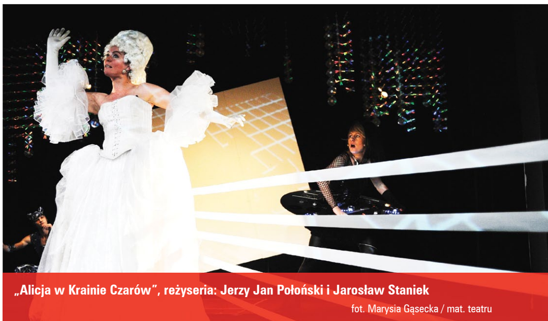
„Alicja w Krainie Czarów”, reżyseria: Jerzy Jan Połoński i Jarosław Staniek

H.G.: Czy mógłby Pan wypunktować najważniejsze dla Pana elementy w funkcjonowaniu teatru pod Pana zarządem?