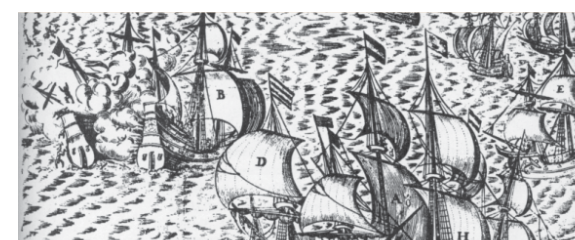
Bitwa pod Oliwą, autor nieznany