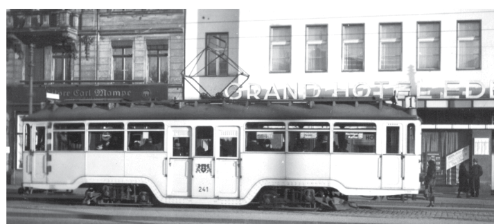
Podwale Grodzkie – 1936 rok. Pierwsze wagony niskopodłogowe pojawiły się w Gdańsku w 1925 roku. 5 wagonów silnikowych i 10 doczepnych zbudowała Gdańska Fabryka Wagonów