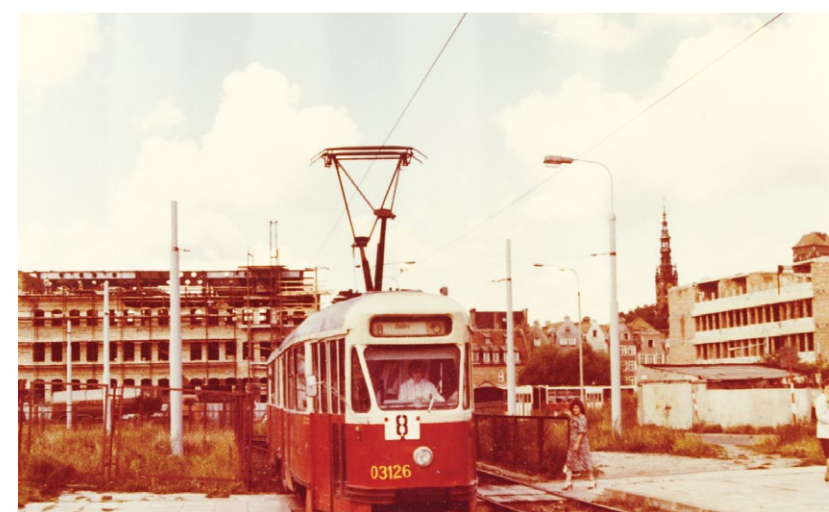
Wagon przegubowy 102Na. 55 tramwajów przegubowych z lat 1969-1973 sprawiło, że ostatecznie Gdańsk pożegnał wagony przedwojenne. Obok Hotel Novotel – 1988 rok