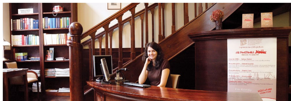
Biblioteka przy Mariackiej to piękne i wyjątkowe miejsce, w którym czytelnik znajdzie przede wszystkim książki, zdjęcia i multimedia o Gdańsku

Biblioteki w Gdańsku to także rosnący zbiór audiobooków. Ich pokazną liczbę ma już 20 z 30 gdańskich bibliotek. Niewielki zbiór starych druków jest obecnie w konserwacji.