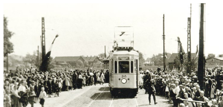
1 lipca 1927 roku otwarcie linii na Stogi (Heubude). Wagon 245 z Gdańskiej Fabryki Wagonów, siostrzany wagon dzisiejszego historycznego Bergamanna nr 266