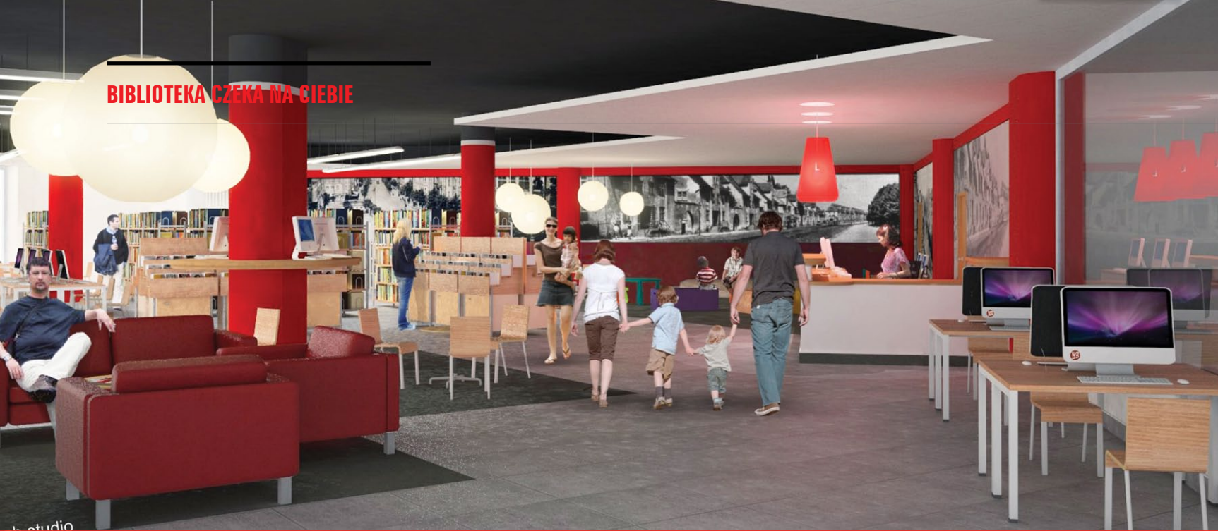
Biblioteka w Centrum Handlowym Manhattan w Gdańsku – wizualizacja. Otwarcie w I kwartale 2012 roku