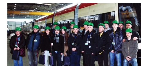
PSSTM z wizytą w bygdoskiej PESA w marcu 2011 roku. To z tej fabryki pochodzą najnowsze tramwaje w Gdańsku