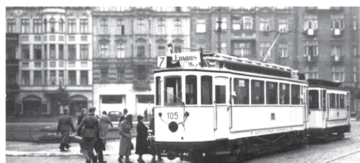
Wagon typu Maximum to czteroosiowe wagony, które w ilości 34 sztuk kursowały przed II wojną światową po gdańskich torach. Tramwaj do Siedlec – Hucisko 1942 rok