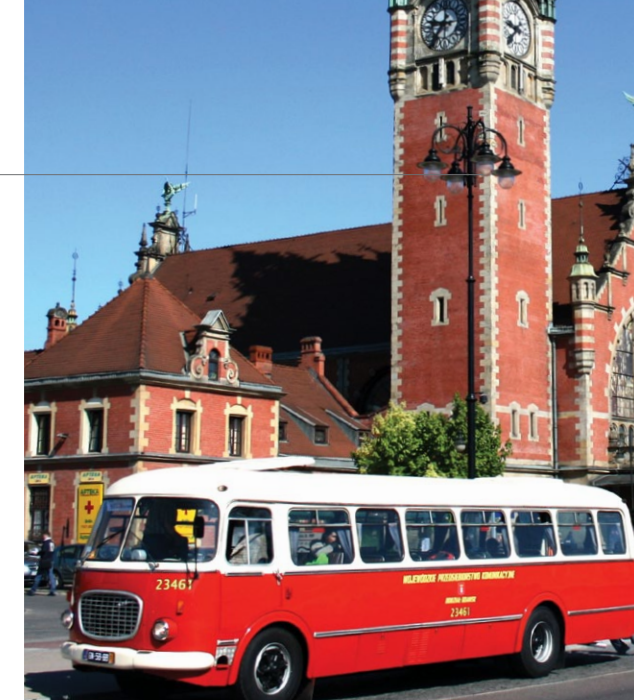
Popularny niegdyś, a dziś już legendarny autobus Jelcz, zwany „ogórkim”