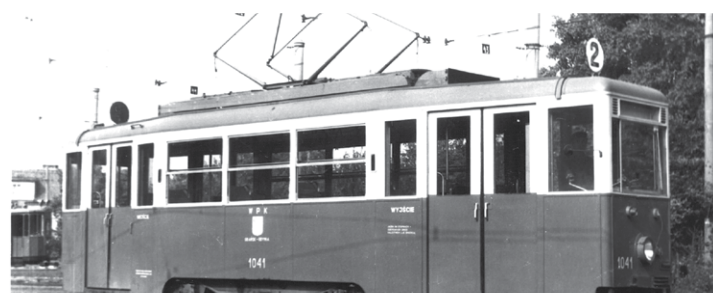
Wagon typu 4N z chorzowskiego Konstalu. W latach 1951-1962 dostarczono do Gdańska wagony w kilku odmianach konstrukcyjnych. Zastąpiły one wiele tramwajów budowy przedwojennej. Kursowały do początku lat 80-tych. Zajezdnia Wrzeszcz – 1961 rok