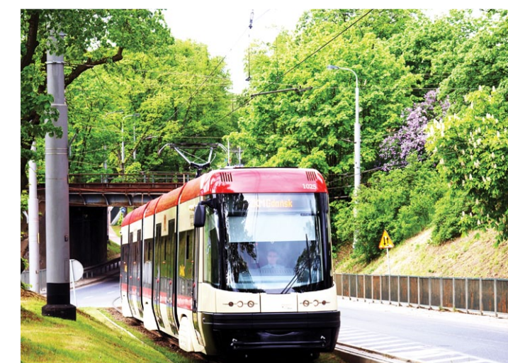
Najnowszy z gdańskich tramwajów – bydgoska Pesa Swing. Do końca 2011 roku po gdańskich torach będzie jeździć 35 takich pojazdów