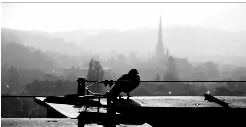
Praca Natalii Glazer