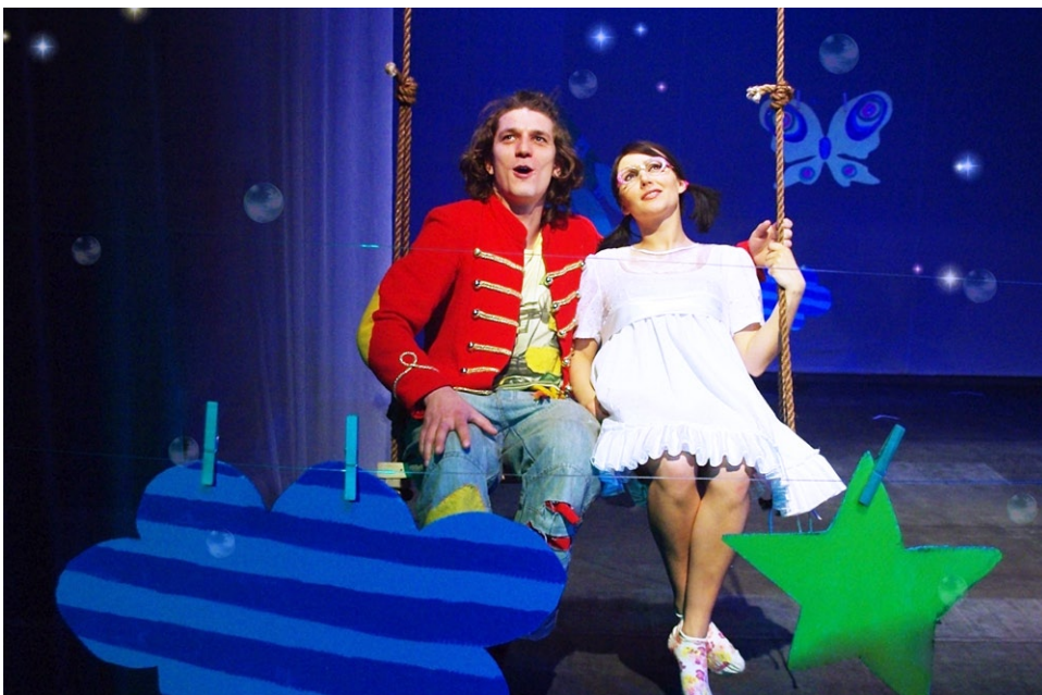
Scena ze spektaklu „Piotruś Pan”

80-236 Gdańsk, ul. Grunwaldzka 16, ☎ Tel./fax: (58) 341 94 83; ☎ (58) 341 12 09 ✉ organizacjawidowisk@teatrminiatura.pl 🌐 www.teatrminiatura.pl