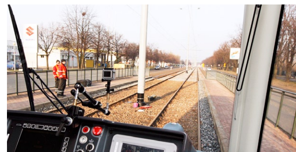
Próbny przejazd tramwaju Pesa 120NaG Swing wyremontowanymi torowiskami od al. Hallera przez Brzeźno i Nowy Port w Gdańsku

W ramach Gdańskiego Projektu Komunikacji Miejskiej, etap IIIA, przebudowano 30% gdańskich torowisk, czyli 30 km torów. Powstała nowa linia tramwajowa z Pętli Chełm do Pętli Nowa Łódzka, na którą tramwaje wyjadą wiosną 2012 roku. ●