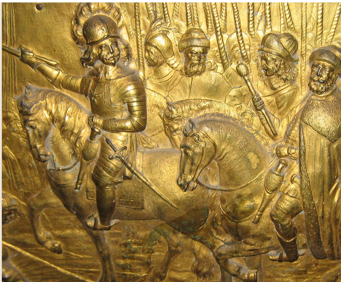
Władysław IV przyjmuje kapitulację wojsk rosyjskich pod Smoleńskiem w 1634 roku

Mieszczanie witali monarchę z należytym szacunkiem, radością i przepychem. Długi Targ tonął w dekoracjach, a specjalnie na cześć szacownego gościa uruchomiono wówczas fontannę Neptuna.