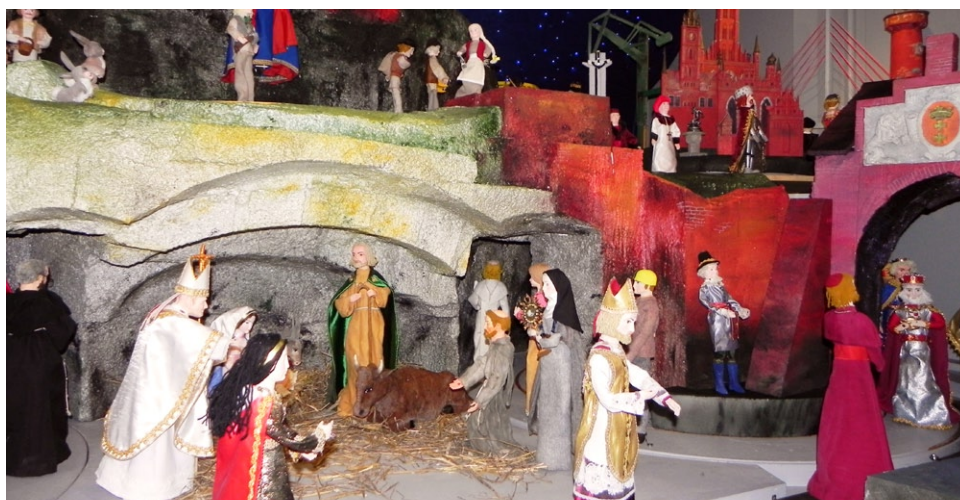
Szopka w kościele Św. Trójcy w Gdańsku

W gdańskiej scenerii, w tle „Żurawia”, Ratusza Głównomiejskiego, dźwigów stoczniowych i stadionu PGE Arena, w szopce przy żłóbku, Maryi i Józefie, spotkali się między innymi Jan Heweliusz i Daniel Fahrenheit. Plan szopki zaludnia ok. 80