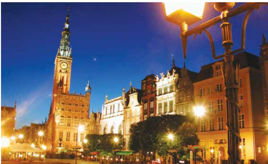
Głosowanie odbywa się na stronie www.6-bsr-wonders.net