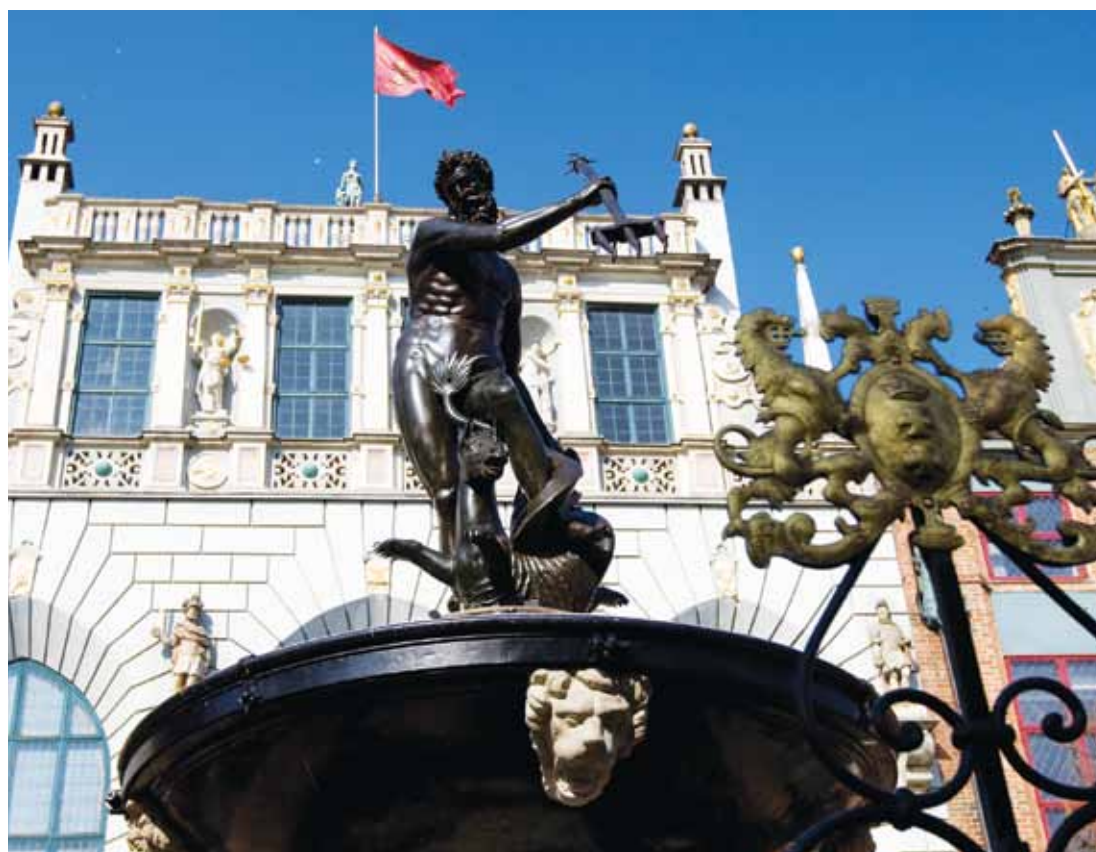
Neptun ma prawie czterysta lat, ale renowacja przywróciła mu dawny blask i młodość