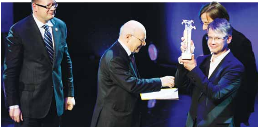
Nagroda literacka Poeta Wolności przyznawana jest co dwa lata. Drugim jej laureatem został Niemiec Durs Grünbein

Grünbein urodził się w roku 1962 w Dreźnie, obecnie mieszka w Berlinie.