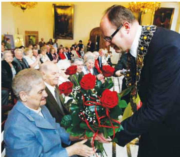
Okolicznościowe medale, które otrzymują jubilanci przyznaje Prezydent RP, a wręcza je prezydent Gdańska