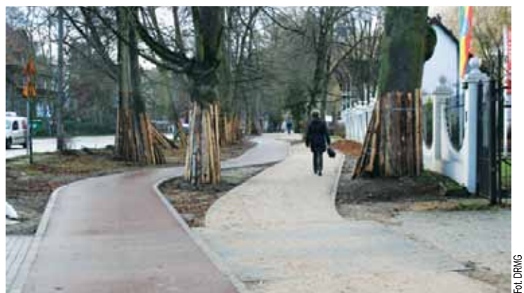
Rowerzyści w Gdańsku mają do dyspozycji 6 km tras rowerowych więcej. W sumie to już 400 km