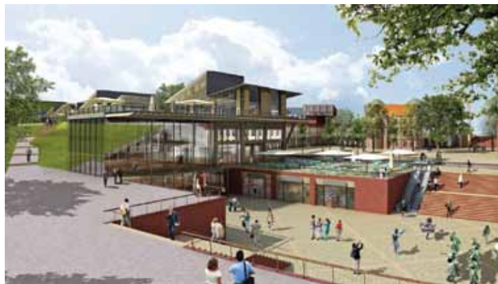
Przestrzeń od strony Podwala Grodzkiego

Miasto Gdańsk i konsorcjum Multi podpisały umowę wspólników dotyczącą zagospodarowania Targu Siennego i Targu Rakowego. Inwestycję wykona spółka zawiązana przez Miasto i Multi Corporation. Zabudowa targów kosztować może nawet miliard złotych!