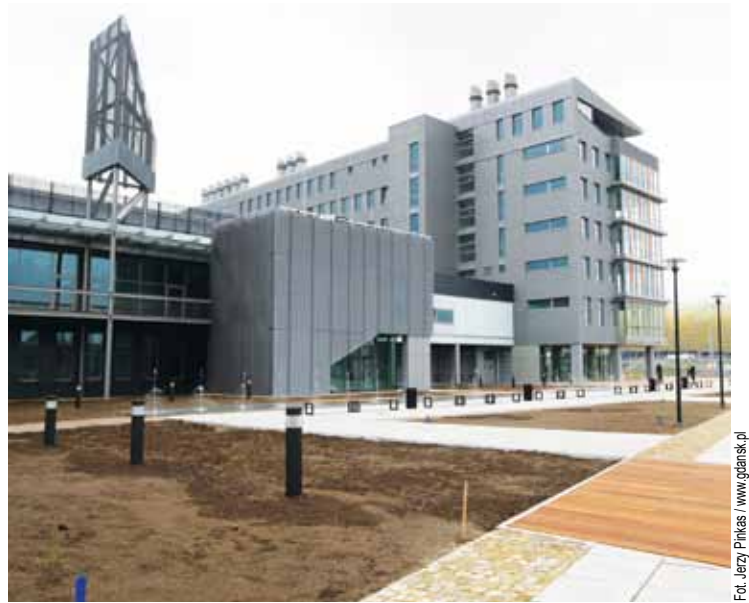
Letnica ma już dwa „bursztynowe obiekty”. Pierwszy to stadion, kolejny to nowa siedziba MTG SA

Najbliższa impreza targowa w nowym centrum to Bałtyckie Targi Militarne Balt-Military-Expo i odbędzie się pod koniec czerwca. (MK)