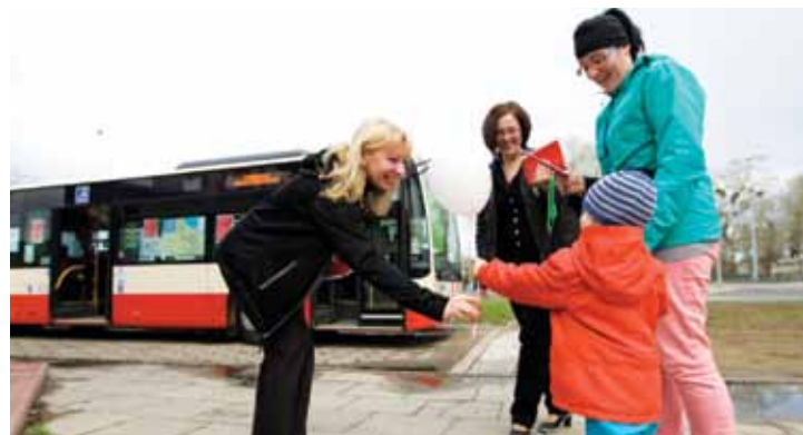
Pracownicy Referatu Komunikacji Społecznej udzielali kompleksowych informacji nt. Euro 2012 w Gdańsku