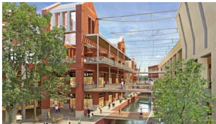
Kanał Raduni znajdzie się częściowo pod lekkiej konstrukcji dachem

Po raz pierwszy w historii Gdańska inwestycja takich rozmiarów zostanie przeprowadzona w ramach partnerstwa publiczno-prywatnego. Pierwsze prace widoczne będą jeszcze w tym roku.