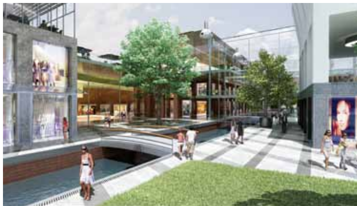
Nad Kanałem Raduni powstanie przestrzeń handlowa