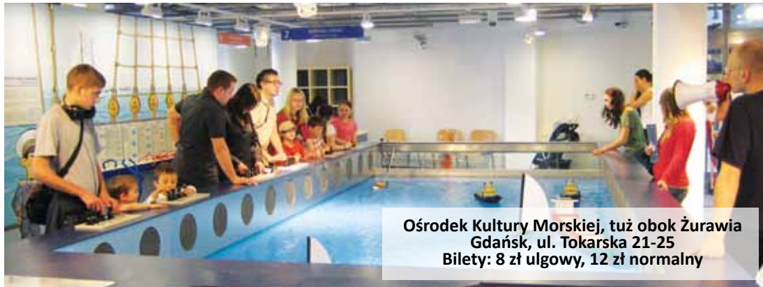
Ośrodek Kultury Morskiej, tuż obok Żurawia Gdańsk, ul. Tokarska 21-25 Bilety: 8 zł ulgowy, 12 zł normalny

Dużym zainteresowaniem zwiedzających cieszy się także wystawa „Łodzie ludów świata”, która przybliży wiedzę z historii i rozwoju sztuki, a grupę głów-