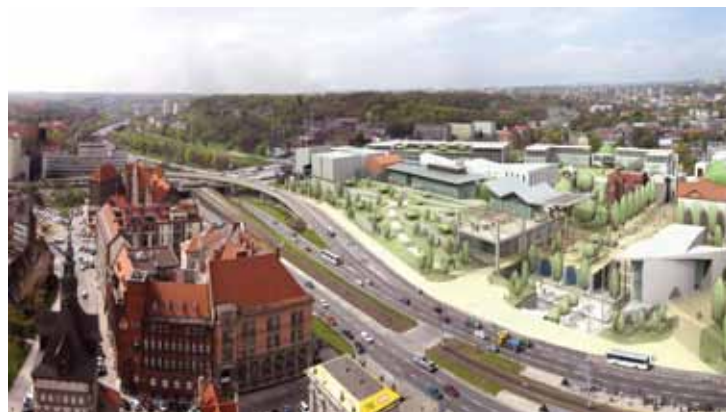
Targ Sienny i Rakowy z lotu ptaka