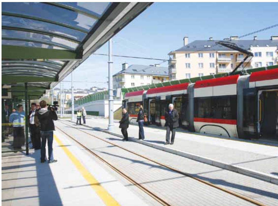
Budowa nowej linii tramwajowej trwała 18 miesięcy i kosztowała 64,5 mln zł

– To system „park and ride”. Liczymy, że wiele osób dojeżdżających spoza Gdańska skorzysta z tej opcji. Parking, który pozwoli za darmo zostawić samochód na cały dzień, będzie w stanie pomieścić około 150 aut i 250 rowerów – zaznacza Maciej Lisicki, zastępca Prezydenta Gdańska ds. gospodarki komunalnej. (MK)