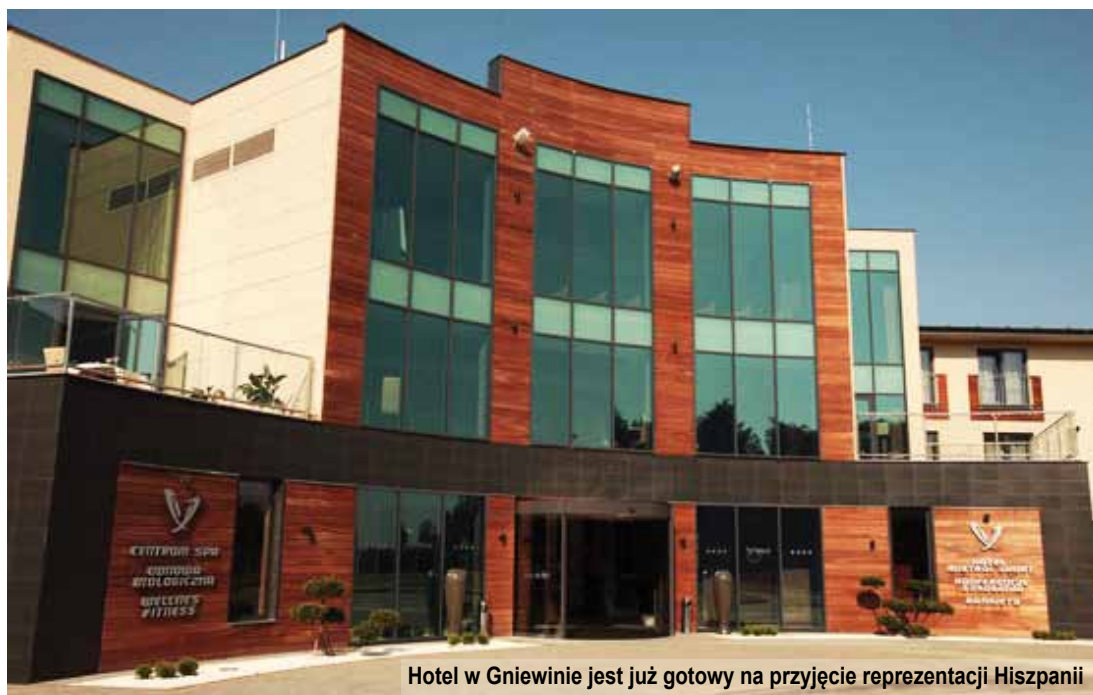
Hotel w Gniewinie jest już gotowy na przyjęcie reprezentacji Hiszpanii