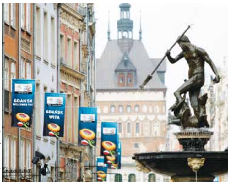
Długa i Długi Targ witają gości banerami