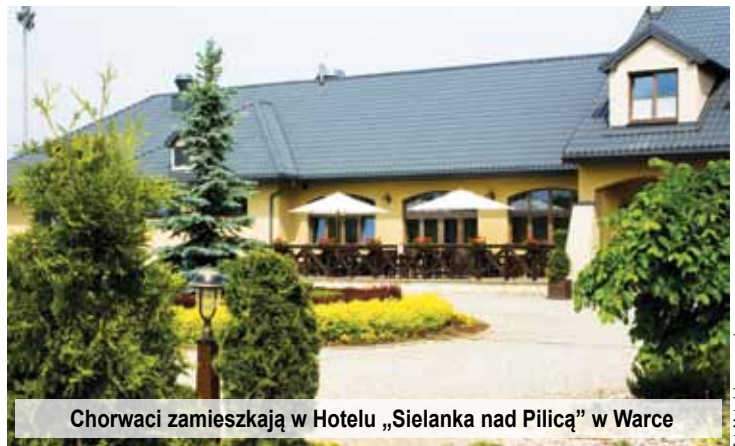
Chorwaci zamieszkają w Hotelu „Sielanka nad Pilicą” w Warce