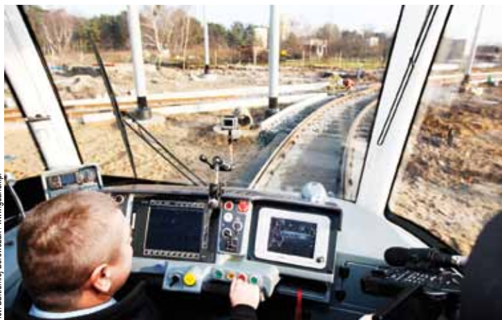
Jedna z trzydziestu pięciu PES w akcji