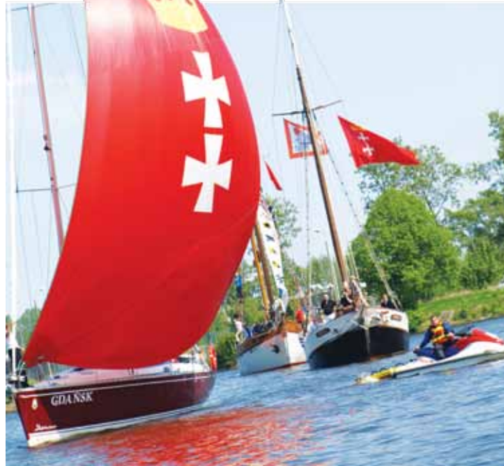
Cała naprzód, ku morskiej przygodzie

Najnowszą inicjatywą Gdańskiej Federacji Żeglarskiej są również Regaty o Puchar Gdańskiego Otwarcia Sezonu Żeglarskiego. Rozegrane zostaną na trasie z Górek Zachodnich do Nowego Portu. Wezmą