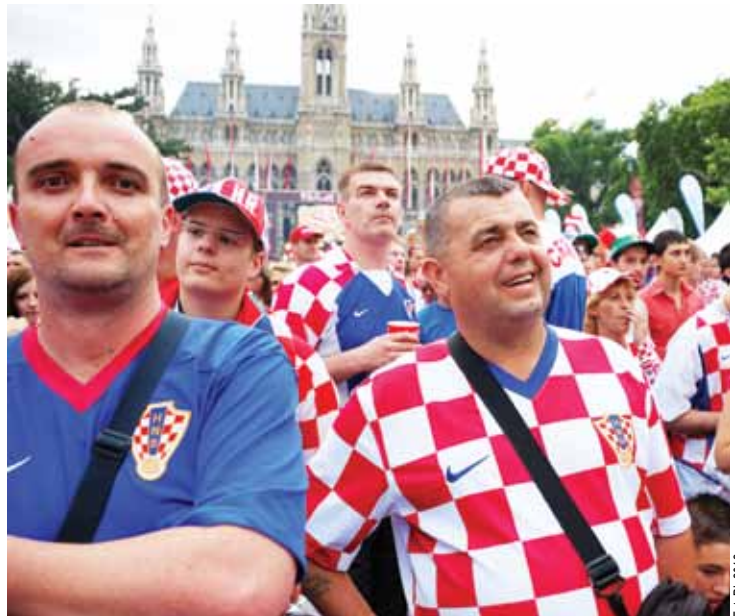
Biało-czerwona szachownica to znak rozpoznawczy fanów z Chorwacji

Chorwaci są niezwykle życzliwi i przyjaźni dla obcokrajowców. Wojna nauczyła ich szacunku w stosunku do innych ludzi. To bardzo pogodni ludzie. Nawet kilkugodzinne stanie w korku czy w kolejce nie stanowi dla nich problemu. Zwyczajny