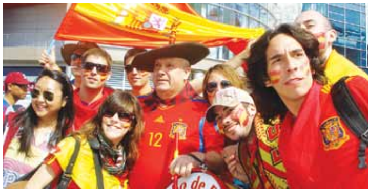
Są kolorowi i głośni. Potrafią żarliwie dyskutować, co wcale nie oznacza kłótni

Gdziekolwiek pojawią się Hiszpanie, robi się kolorowo i głośno. Z pewnością przywiozą ze sobą zwyczaj zabawy do późnych godzin nocnych. Związany jest z tym także nawyk wieczornego jedania posiłków