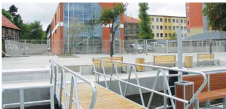
Powstała infrastruktura jest najwyższej klasy