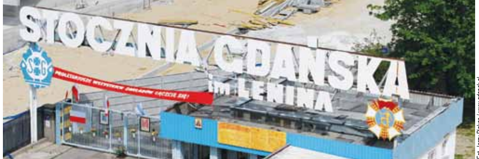
Zrekonstruowana historyczna Druga Brama odtworzona na podstawie fotografii i filmów z czasów strajków w Stoczni

Nie miało być kontrowersyjnie, tylko historycznie... O tym, dlaczego Druga Brama Stoczni Gdańskiej odzyskała dawne imię, pisze prezydent Gdańska Paweł Adamowicz.