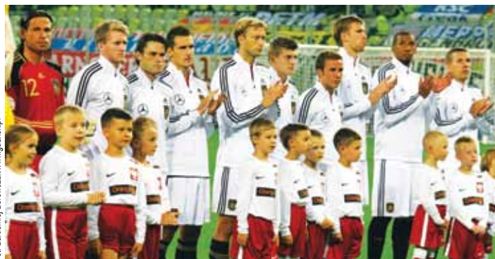
Niemiecką reprezentację widzieliśmy w Gdańsku podczas wrześniowego meczu towarzyskiego z Polską

Łącznie wydane zostaną 11 124 bezpłatne wejściówki, z czego Urząd Miejski