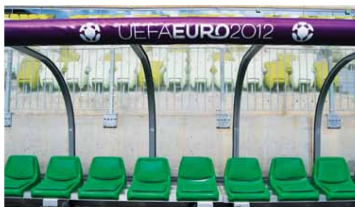
UEFA będzie zarządzać gdańskim stadionem do 26 czerwca