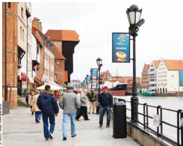
Dekoracja wykonana jest w dwóch wersjach językowych – polskiej i angielskiej

Wielkie odliczanie do pierwszego gwizdka Mistrzostw trwa! Tak, jak piłkarze założą na mecze narodowe stroje reprezentacji, tak w Gdańsku pojawiają się dekoracje świadczące, że start imprezy tuż, tuż... Gdańsk podczas turnieju „zagra” w barwach niebieskich oraz biało-czerwonych barwach narodowych.