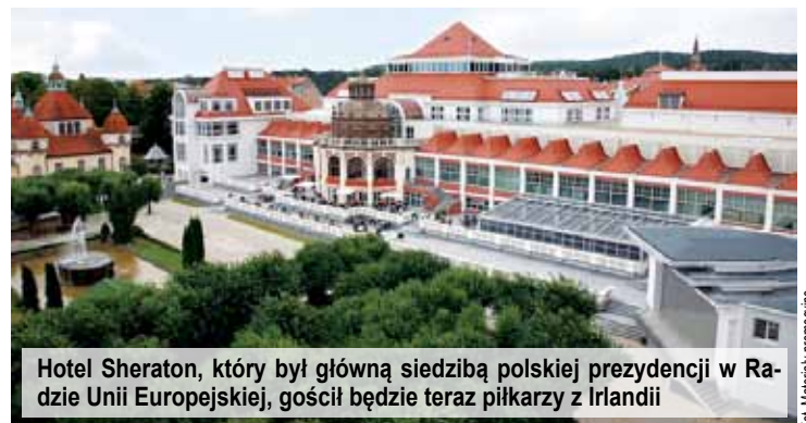
Hotel Sheraton, który był główną siedzibą polskiej prezydencji w Radzie Unii Europejskiej, gościł będzie teraz piłkarzy z Irlandii