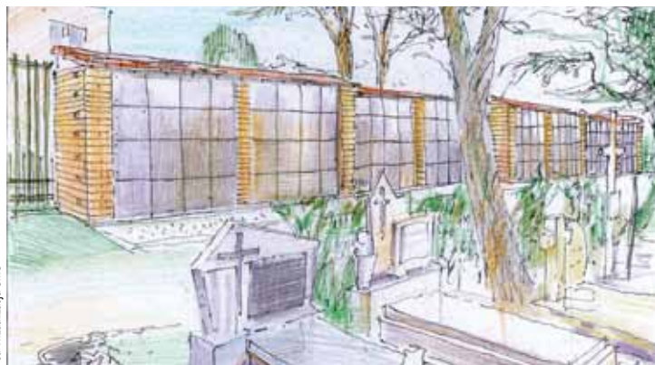
Ściany kolumbarijne to jedyna możliwość na dodatkowe miejsca pochówku na terenie zamkniętych dziś nekropoli

Jeśli wszystko pójdzie zgodnie z planem, inwestor zostanie wyłoniony do końca