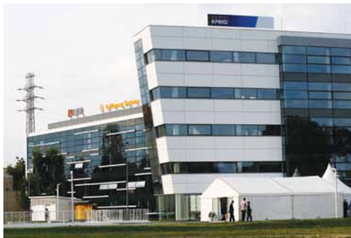
Biurowiec Opera Office budowany był przez 17 miesięcy. Jak zapewnia jego właściciel – firma Euro Styl – to idealne miejsce do pracy