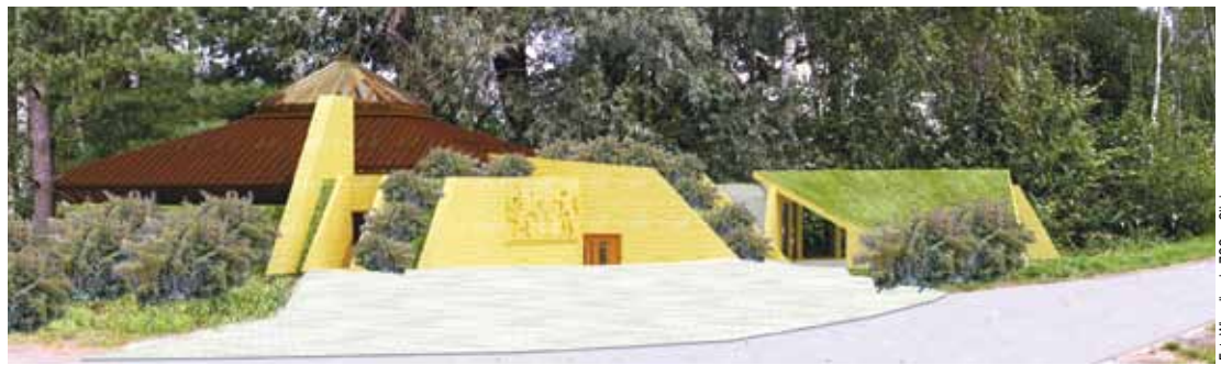
Wejście główne do Pawilonu Lwów