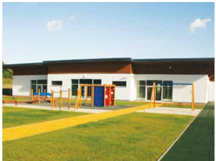
Przedszkole modułowe przy ul. Człuchowskiej będzie służyć pięcioletnim i sześciolatkom, które będą się tu przygotowywać do szkoły