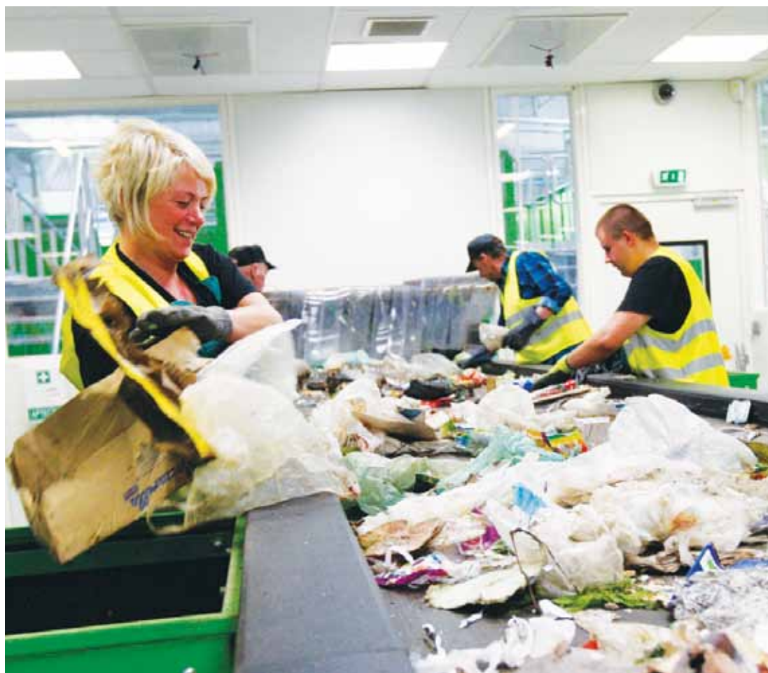
Zmianę w rozliczeniach opłat za śmieci narzuciła ustawa. Ostateczną decyzję w tej sprawie podejmą radni