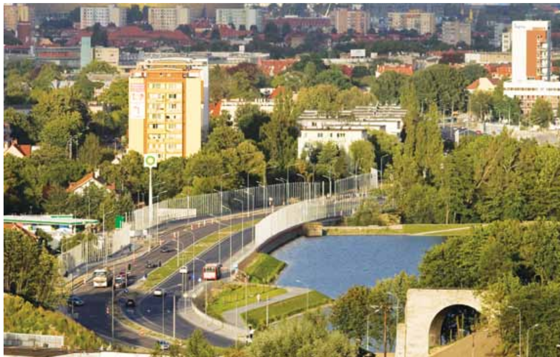
Trasa Słowackiego to najdroższa inwestycja w historii miasta. Budowa drogi wraz z tunelem pod Martwą Wisłą pochłonie 1,4 mld złotych