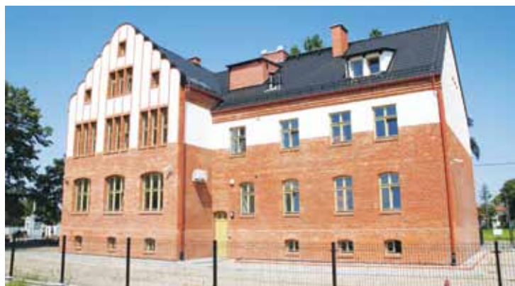
... będzie teraz służył jako Dom Otwarty