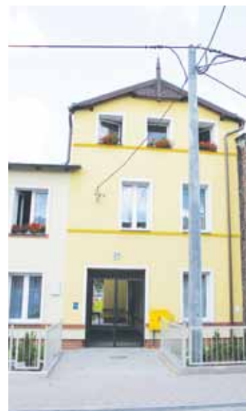
Mieszkańcy Letnicy cieszą się, że stare kamienice zamieniły się w budynki ocieplone, z instalacją gazową zamiast pieców, z nową stolarką okienną