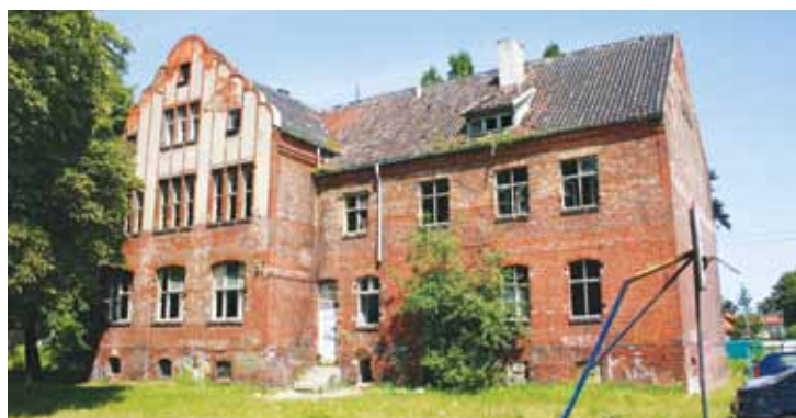
Dawny budynek szkoły przy ul. Uczniowskiej 22...