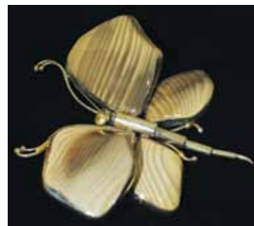
Wyroby z krzemienia pasiastego do obejrzenia w MHMG