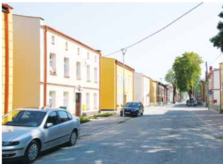
Tak wyglądała ulica Starowiejska przed rewitalizacją...