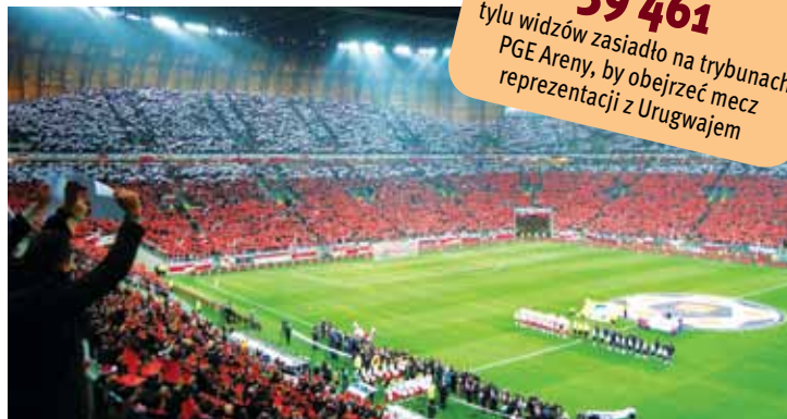
Wyjściowa jedenastka Białoczerwonych podczas hymnu