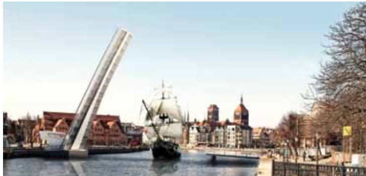
I nagroda – PONTING d. o.o. (Ltd) (Maribor) (nagroda 50 tys. zł)

Koncepcja projektantów ze Słowenii zwyciężyła w konkursie na opracowanie koncepcji zwodzonej kładki pieszej przez Motławę na Ołowiankę. Obiekt i jego spektakularne podnoszenie będą atrakcją turystyczną, nie odwracającą uwagi od dostojności zabytków Gdańska - czytamy w uzasadnieniu sądu konkursowego.