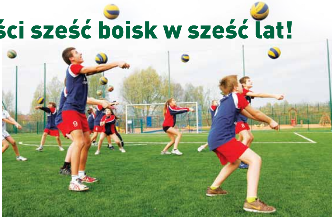
Boisko przy SP 85 służyć będzie uczniom i okolicznym mieszkańcom

Przebudowa kompleksu boisk oraz wykonanie nowej, bezpiecznej nawierzchni istniejącego placu zabaw przy SP 85, odbyły się w ramach programu „Modernizacja w obiektach oświatowych”. Zgodnie z umową, wykonane zostało także pokrycie istniejącego już placu zabaw bezpieczną nawierzchnią oraz jego ogrodzenie. Zakres modernizacji obejmował także urządzenie i uzbrojenie terenu, a w szczególności odwodnienie, remont istniejącej kanalizacji deszczowej, wyposażenie boisk, wykona-