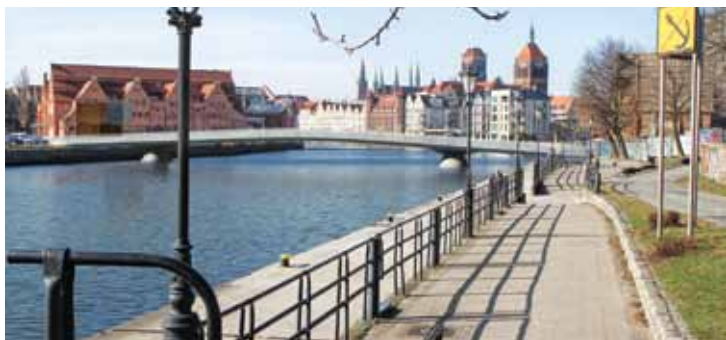
III nagroda – Autorskie Studio Architektury ASA Sp. z o.o. (Strzyżów) i Ryszard Miklas, Pracownia architektoniczna ARCHICOMP (Rzeszów) (nagroda 20 tys. zł)