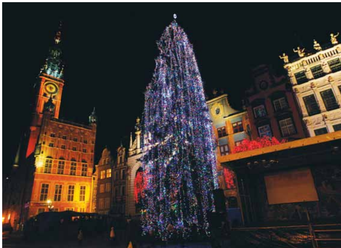
Historia wspólnej Gdańskiej Choinki sięga 1989 roku