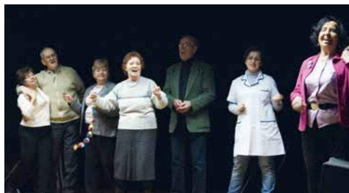
W spektaklu sanatorium zderzają się doświadczenie i młodość. Łączy je... radość życia

„Sanatorium” to próba zmierzenia się ze wszystkimi aspektami życia, tych jakże specyficznych uzdrowisk – z atmosferą i regułami tego miejsca, życiem towarzyskim i ich wpływem na dalsze losy beneficjentów sanatorium, nonsensami służby zdrowia itp. Ważne jest, że scenariusz spektaklu rodzi się z rozmów i improwizacji podczas cyklicznych spotkań seniorów i artystów. Aby lepiej poznać i zrozumieć specyfikę funkcjonowania sanatorium, grupa wybrała się do jednego z sopockich uzdrowisk.