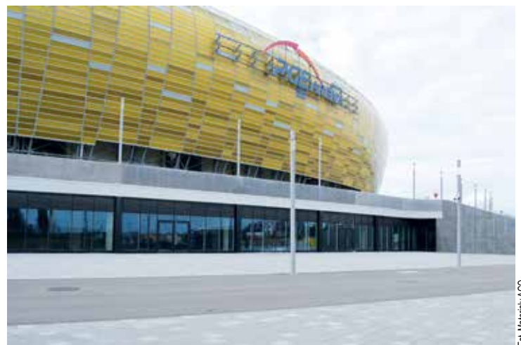
Centrum Rekreacyjno-Sportowe to pomysł na zwiększenie dochodów PGE Areny Gdańsk