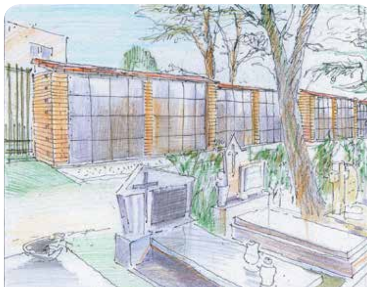
Wygląd ścian kolumbarijnych ma się wpisywać w otoczenie nekropolii. Jako pierwsze powstanie kolumbarium na Cmentarzu Oliwskim