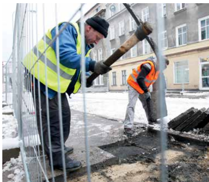
Ulica Wajdeloty przechodzi gruntowny remont