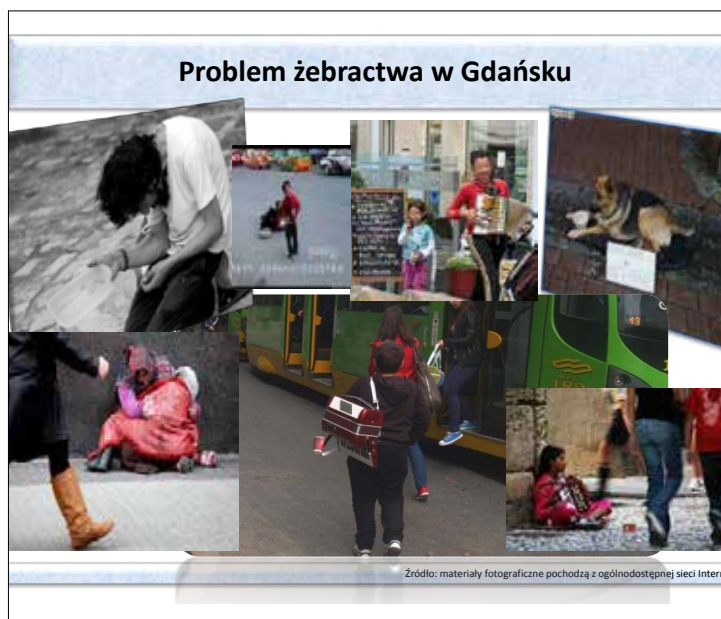
Osoby żebrzące mają wiele sprawdzonych sposobów na efektywne wyłudzenie pieniędzy