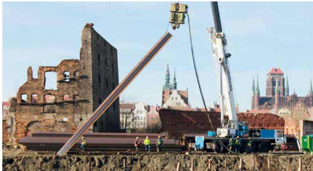
Wykonawca prac – firma Energopol uszczelnia nabrzeża wyspy

Miasto postanowiło także uzbroić teren na gruntach będących w jego posiadaniu.