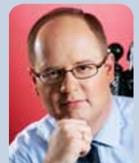
Paweł Adamowicz Prezydent Gdańska

Coraz więcej gdańszczan przekazuje 1% dla organizacji pozarządowych. W ubiegłym roku zrobiło to 80 procent z nas! Pozostaje więc jeszcze 20 procent, które musimy do tego szlachetnego kroku przekonać. Apeluję do wszystkich mieszkańców, szczególnie tych młodszych, by pomogli seniorom wypełnić PIT, czy wytłumaczyli im, że nawet 5-10 złotych z naszego podatku jest dużo warte. Każdy przyszłowiowy „grosz” się liczy!