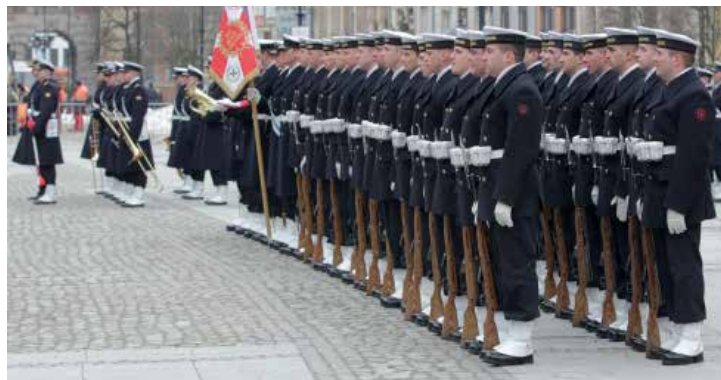
Uroczystości uświetnił pokaz musztry paradowej