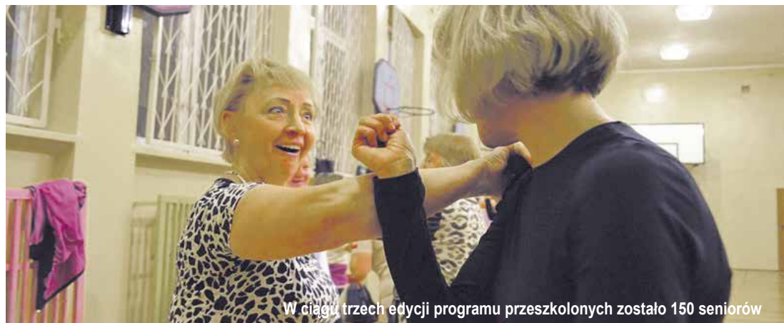
W ciągu trzech edycji programu przeszkolonych zostało 150 seniorów

Starsi ludzie są narażeni na różnego rodzaju niebezpieczeństwa. W oczach napastnika wydają się łatwymi ofiarami. Straż Miejska w ramach projektu „Bezpieczny Senior” uczy seniorów, jak powinni reagować w sytuacjach zagrożenia.