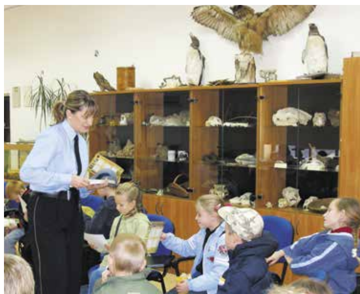
Zajęcia są prowadzone z udziałem funkcjonariuszy Straży Miejskiej w Gdańsku, wychowawców młodzieży i przedstawicieli organizacji ekologicznych