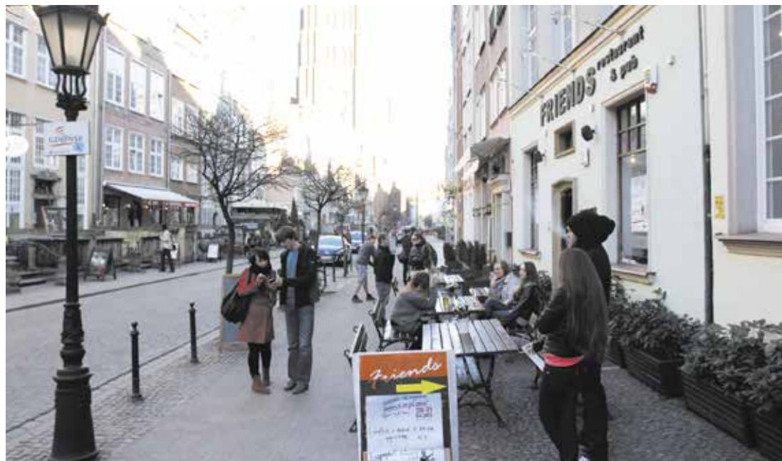
Od kilku lat, latem, ulica Piwna zamieniała się w deptak. Teraz mieszkańcy i turyści będą się po niej mogli poruszać cały rok