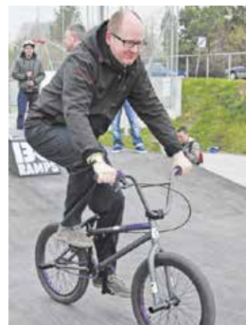
Prezydent Gdańska przekonał się, że wyczynowa jazda na bmx to wyzwanie