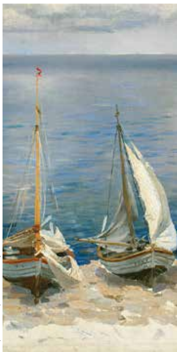
Ferdynand Ruszczyk, „Dwie łodzie zagłowe”, 1896

Po remoncie sal wystawowych znajdujących się w Spichlerzach na Ołowiance kolekcja obrazów marynistycznych Galerii Morskiej zyskała nowy blask, a wśród prezentowanych prac, znalazło się miejsce również na te, które wcześniej nie były stale prezentowane.