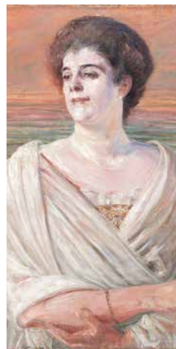
Jacek Malczewski, „Portret dany na ile morza”

Interesującym dopełnieniem ekspozycji są portrety kapitańskie, czyli realistyczne przedstawienia statków, malowane na zamówienie armatorów jako m.in. podarunki dla szczególnie zasłużonych kapitanów. (WS)