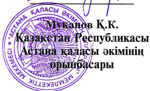
Муканов Қ.К. Қазақстан Республикасы Астана қаласы әкімінің орынбасары