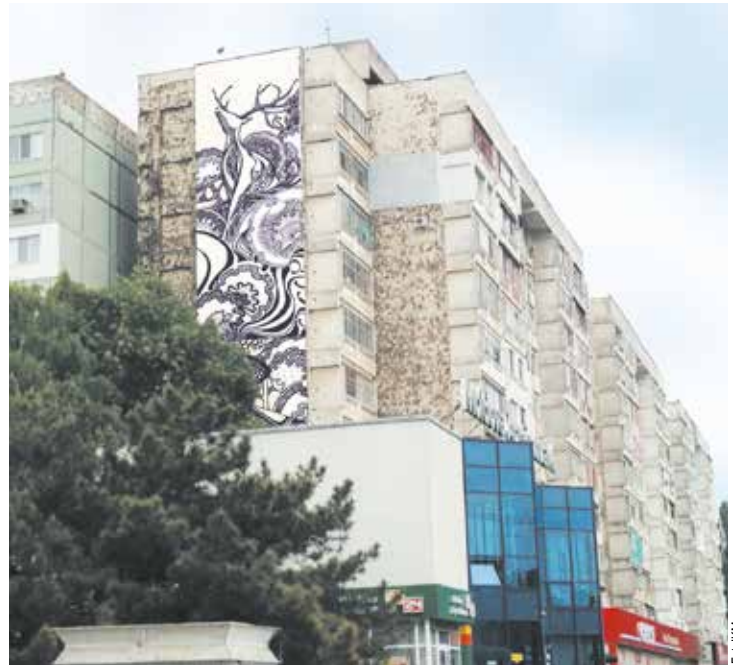
W Kiszyniowie, na osiedlu Botanica, powstanie już drugi mural realizowany przez Gdańską Szkołę Muralu