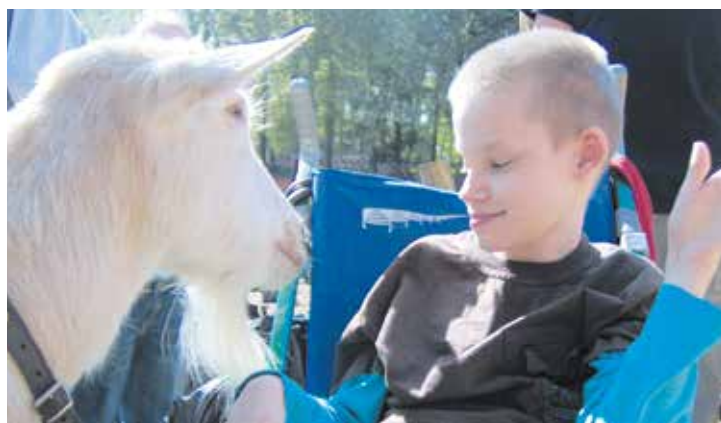
Fot. Archiwum SOSW nr 2

W programie imprezy rocznicowej przewidziano: koncerty muzyczne, prezentację albumu „Blżej Nas”, projekcje filmu „Wczoraj i dziś”, występy teatralne i zespołów muzycznych, zwiedzanie ośrodka i bal integracyjny.