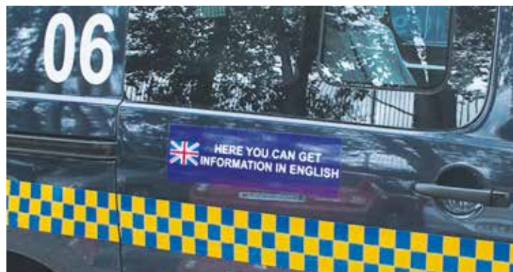
Językowe patrole Straży Miejskiej poznać można po specjalnych plakietkach