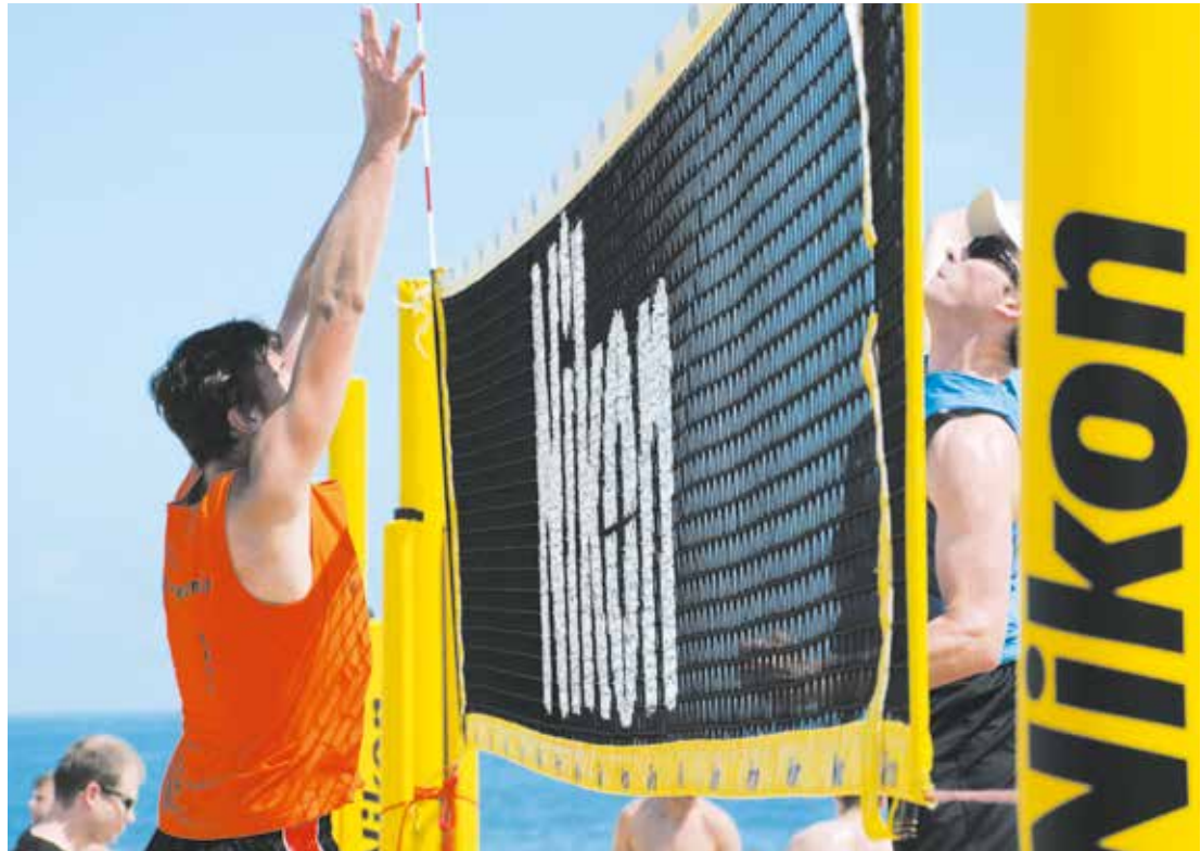
Siatkówka plażowa jest bardzo popularną i widowiskową dyscypliną sportu

Informacje i regulamin dostępne na mosir.gda.pl . (GP)