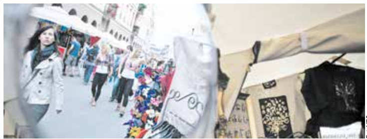
Tegoroczny Jarmark potrwa 23 dni

Trzy ostatnie dni Jarmarku (16-18 sierpnia, Długi Targ) ucieszą tych, którzy kochają unikatowe wzornictwo i rzeczy piękne i oryginalne. Projektanci zaprezentują akcesoria wystroju wnętrz, przedmioty codziennego użyt-