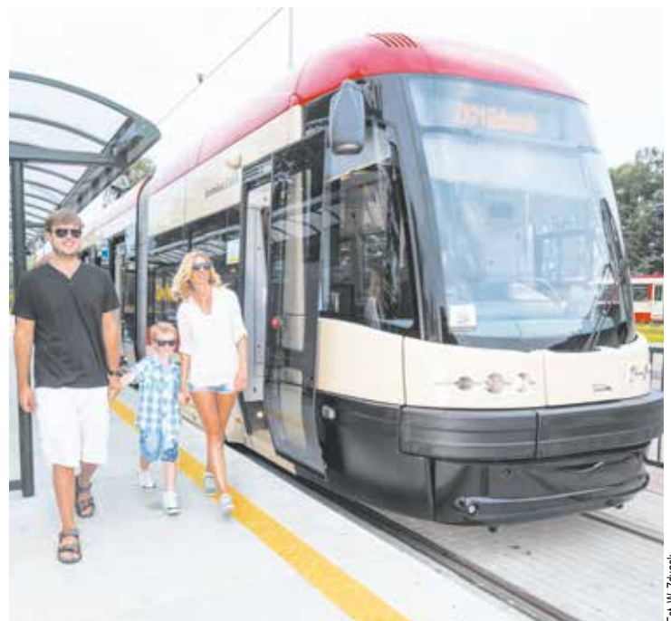
PESA to najnowsze tramwaje w gdańskiej flocie. Są komfortowe i klimatyzowane. Klimatyzację posiada także 80% autobusów