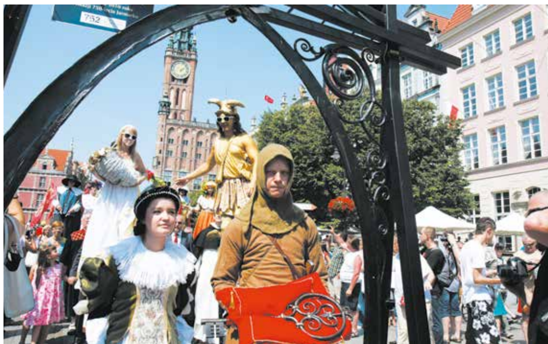
Klucz do bram miasta kupcy otrzymają podczas ceremonii otwarcia - 27 lipca w samo południe

Przebojem ubiegłorocznego jarmarku była „Koławka” – szumiąca morzem ławka w formie pierścienia. W tym roku dołączy do niej „Ławkoło”. Obydwie ławki będą zarazem miejscem książkokerażenia, czyli punktem bookcrossingowym. Szykujcie książki!