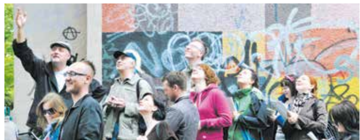
Jednym ze sposobów poznania miasta są spacer z przewodnikami. Wystarczy się zapisać

O projekcie „Metropolitanka” można poczytać na blogu: http://metropolitanka.ikm.gda.pl/ (MB)