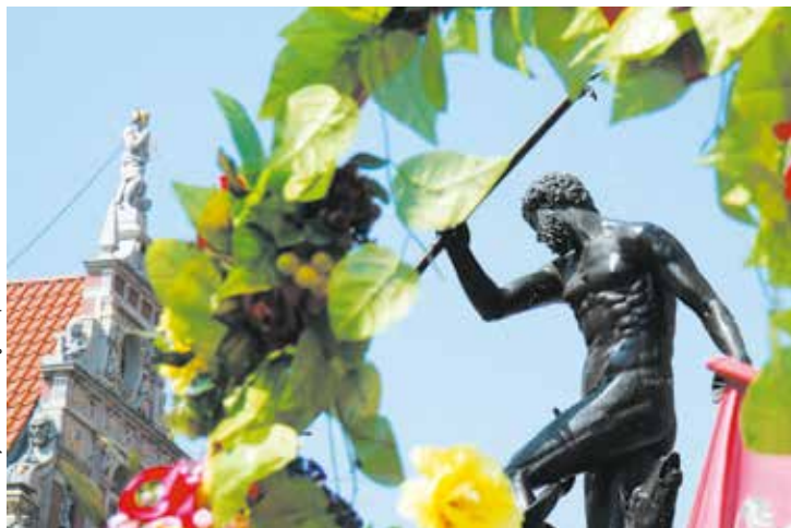
Od 27 lipca do 18 sierpnia Gdańsk we władanie przejmują kupcy