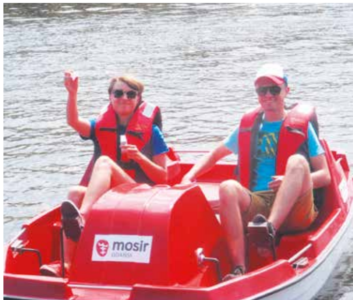
Rowerzy wodne to kolejna atrakcja mająca na celu ożywienie wód Motławy