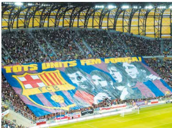
Piłkarskie święto Lechia Gdańsk - FC Barcelona zakończyło się remisem 2:2