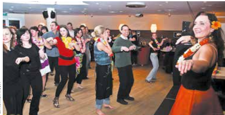
Hawaje są miejscem narodzin tańca Hula

▪ Tańce Etniczne - poprzez północną Europę z tańcami Fińskimi, Niemieckimi i Polskimi, przez wschodnie tańce z Rosji, Armenii czy Izraela po bogactwo południowych tańców greckich, bałkańskich czy afrykańskich, aż po zachodnie kroki z Francji, Irlandii i Anglii a nawet Ameryki. Tańce odbywają się w kręgu, korowodzie lub rządach. Celem