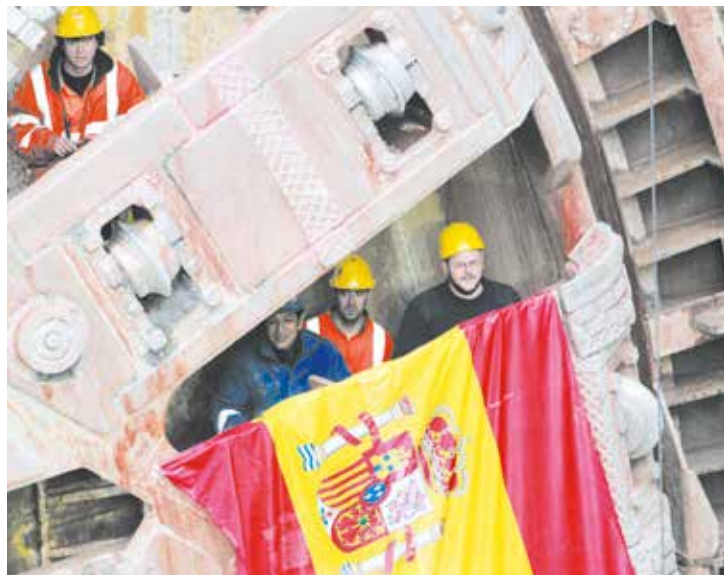
Flaga Hiszpanii pojawiła się po symbolicznym przebiciu się maszyny TBM na drugi koniec Wisły

885 mln zł to koszt odcinka „tunelowego” Trasy Słowackiego