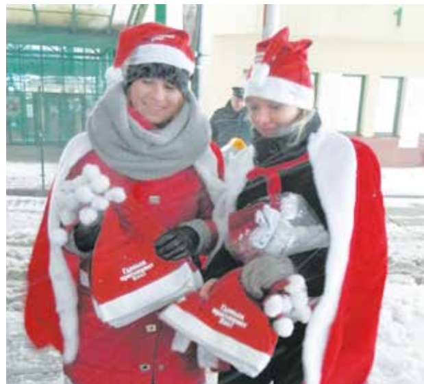
Hostessy zapraszające do Gdańska były oczywiście w strojach Świętego Mikołaja

Pięknie ustrojony Gdańsk zaprasza w swoje progi także turystów zagranicznych. Na przejściach granicznych w Grzechotkach i Gronowie na Rosjanie otrzymali 1 000 mikołajowych czapek z wyszytym hasłem: „GDAŃSK ZAPRASZA!”. Originalna akcja zorganizowana przez Biuro Prezydenta ds. Promocji Miasta to forma podziękowania Rosjanom za to, że od czasu wprowadzenia Małego Ruchu Granicznego mieszkańcy Kaliningradu wyjątkowo upodobałi sobie właśnie stolicę Pomorza. Rosjanie coraz częściej przyjeżdżają do Gdańska nie tylko na zakupy, ale również na koncerty, wypoczynek i zwiedzanie. Są zachwyceni miastem, a na portalach w Obwodzie Kaliningradzkim często dzielą się pozytywnymi opiniami na jego temat.