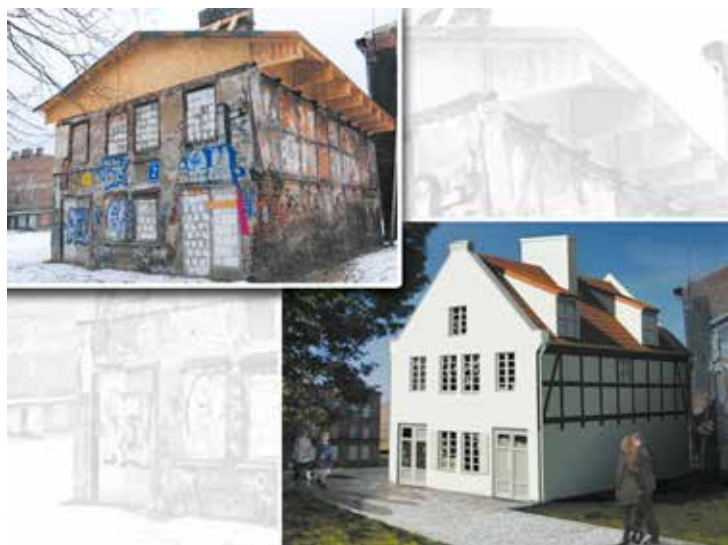
Budynek przy ul. Reduta Wyskok przed remontem i po jego wykonaniu

Prace remontowe prowadzone przez TBS Motława trwają też w kamienicy przy ul. Wróblej 24. W budynku wymieniana jest stolarka okienna i drzwiowa i wszystkie instalacje. Odnawiane są również wnętrza mieszkań i wymiana systemu ogrzewania na gazowe. Remont kosztuje 1,4 mln zł. (eM)