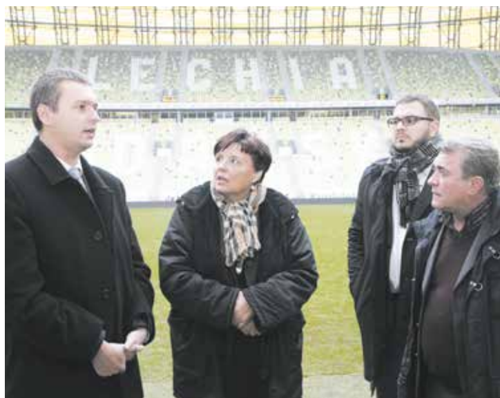
Stadion, tradycyjnie już robił na gościach duże wrażenie

Kolejny dzień grupa rozpoczęła od wizyty w Centrum Zarządzania Kryzysowego i wykładów poświęconych bezpieczeństwu.