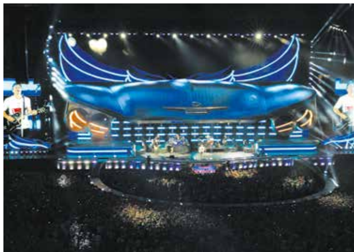
Koncert Bon Jovi był wyjątkowy pod każdym względem, a wyjątkowości tej dodała mu jeszcze scena w kształcie cadillaca