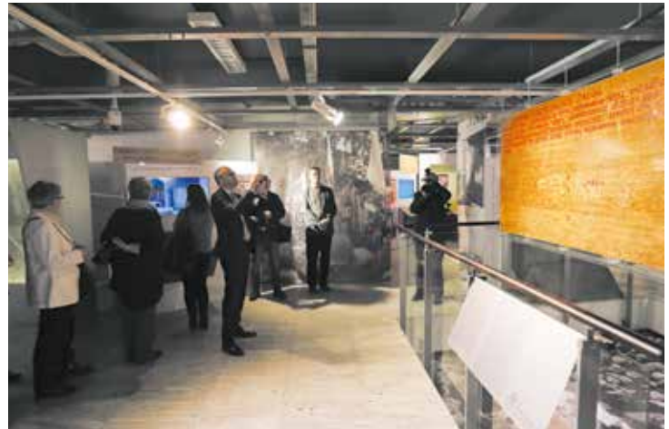
Tablice z postulatami Międzyzakładowego Komitetu Strajkowego są główną atrakcją wystawy, ale zbudowano wokół nich opowieść o ludziach i okolicznościach, w których powstały

Wystawa będzie czynna przez rok. Ośrodek Kultury Morskiej, ul. Tokarska 21–25, www.cmm.pl.