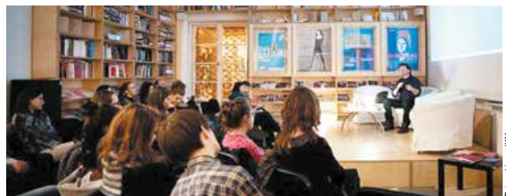
Wykłady są otwarte. Przyjść może każdy, kto chce posłuchać o Gdańsku, Rzymie czy Paryżu

– Miasta to księgi, zapisywane na wielu poziomach, przy użyciu wielu kodów – żądają rozmaitych odczytań, prowokują do lektury. Najlepiej czytać je wspólnie z innymi – podczas wykładów, tych wyobrażonych spacerów miejskich, przy pomocy obrazów, widoków, wędut, ożywiający wspomnienia niegdysiejszych pobytów bądź pobudzając pragnienia przyszłych spotkań... Doświadczenie wielu miast składa się przecież na odczuwanie miasta, w którym teraz właśnie jesteśmy – komentuje Bilewicz.