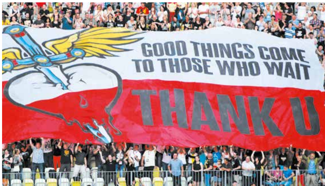
Na grupę BON JOVI warto było czekać, a fani dali temu wyraz wywieszając tzw. sektorówkę