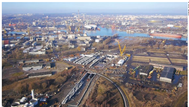
Tunel pod Martwą Wisłą widziany od góry.

Każdy z dwóch tuneli będzie miał po dwa pasy ruchu w każdym kierunku i zostanie połączony 7 przejściami ewakuacyjnymi. Prace przy ich wykonywaniu rozpoczyna się na przełomie kwietnia i maja, kiedy TBM powinien być już w połowie wiercenia drugiej rury. Roboty przy tej nitce trasy, potrwać około 4 miesięcy, czyli krócej niż poprzednio. Wykonawca ma już bowiem przygotowane obydwa szyby: startowy i wyjściowy, na placu budowy znajduje się cały zapas tubingów dla tej rury tunelu, w praktyce został także rozpoznany grunt, przez który przechodzi maszyna. Średnia prędkość wiercenia – podobnie jak poprzednio