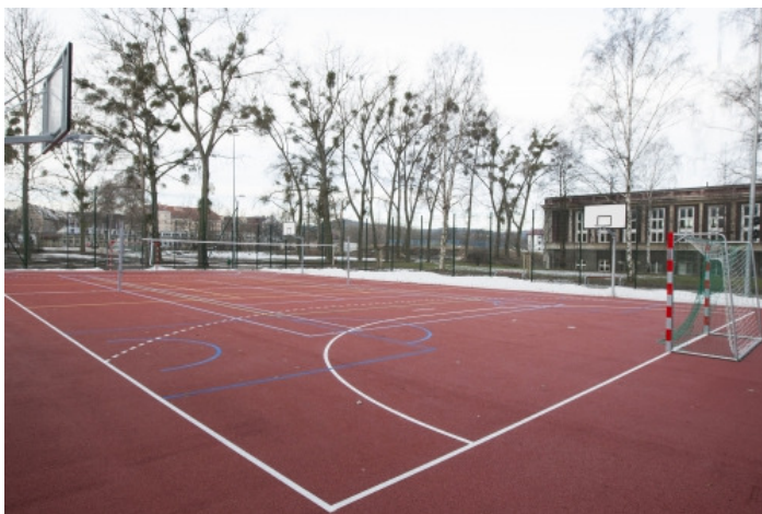
Państwowe Szkoły Budownictwa przy al. Grunwaldzkiej 238 (luty 2014)