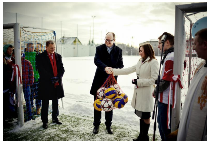
Centrum Kształcenia Zawodowego i Ustawicznego nr 2 na Oruni (styczeń 2014)

Projekt Top Talent - realizowany wspólnie przez Urząd Miejski w Gdańsku, Akademię Wychowania Fizycznego i Sportu oraz Pomorski Związek Piłki Nożnej.