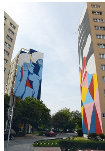
Kolekcja gdańskich murali to 45 prac.

Kolekcję Malarstwa Monumentalnego tworzą wielkoformatowe prace powstające na ścianach szczytowych bloków mieszkalnych gdańskiego osiedla Zaspa. Pierwsze w Kolek-