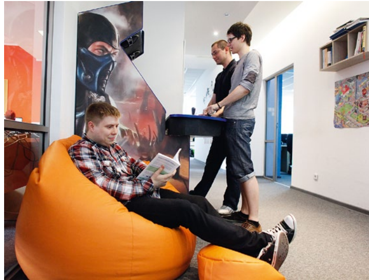
Specjalne miejsca do odpoczynku dla pracowników branży IT zwiększają ich efektywność i kreatywność.

O warunkach pracy w IT mówi się dużo. Wielu spoza branży sądzi, że dla większości pracowników to bardziej freelancing niż standardowy etat. A jak jest w rzeczywistości? Czy faktycznie obiegowa opinia o pracy w branży IT jest prawdziwa?