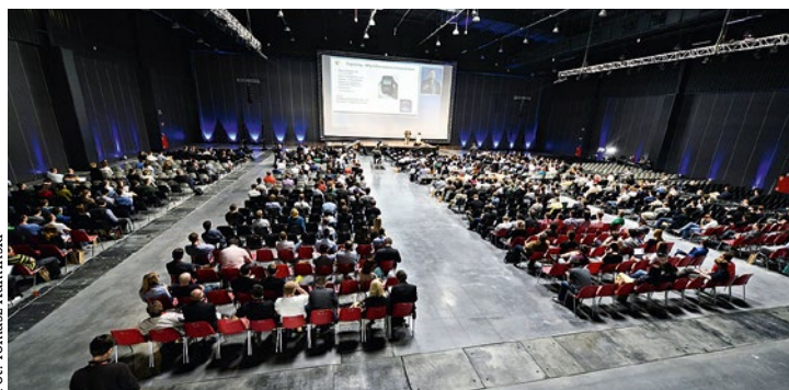
Z roku na rok liczba uczestników infoShare rośnie o 40%.