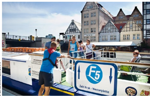
Rejsy gdańskich tramwajów wodnych odbywają się 3 razy dziennie w dni powszednie. Dodatkowy rejs przewidziano w dni wolne od pracy.

Długość wodnego szlaku turystycznego gdańskich tramwajów wodnych wynosi 45,1 km. Statki Sonica i Sonica I, oznaczone numerami F5 i F6, kursują na trasach: F5: Żabi Kruk – Westerplatte/Latarnia Morska z przystankami pośrednimi: Zielony Most, Targ Rybny, Wiosny Ludów, Nabrzeże Zbożowe, Twierdza Wisłoujście (długość trasy – 25,6 km) oraz F6: Targ Rybny – Narodowe Centrum Żeglarstwa z przystankami pośrednimi: Sienna Grobla, Wiosny Ludów, Tamka, Stogi Górki Zachodnie (długość trasy – 28,5 km). Na każdej trasie przez cały tydzień (także w dni ustawowo wolne od pracy) odbywać się będą 3 rejsy dziennie