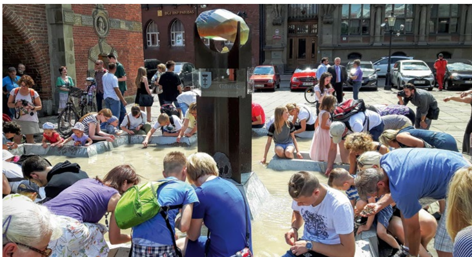
Chętni mogą spróbować znaleźć bursztyn... i zabrać go ze sobą!

Niecka „Poszukiwacza Bursztynu” ograniczona jest nieregularnym, modułowym