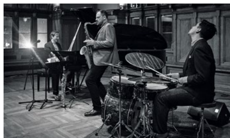
Jazz w plenerze najlepiej „smakuje” w Gdańsku.

Więcej na: http://www.gak.gda.pl/ wydarzenia