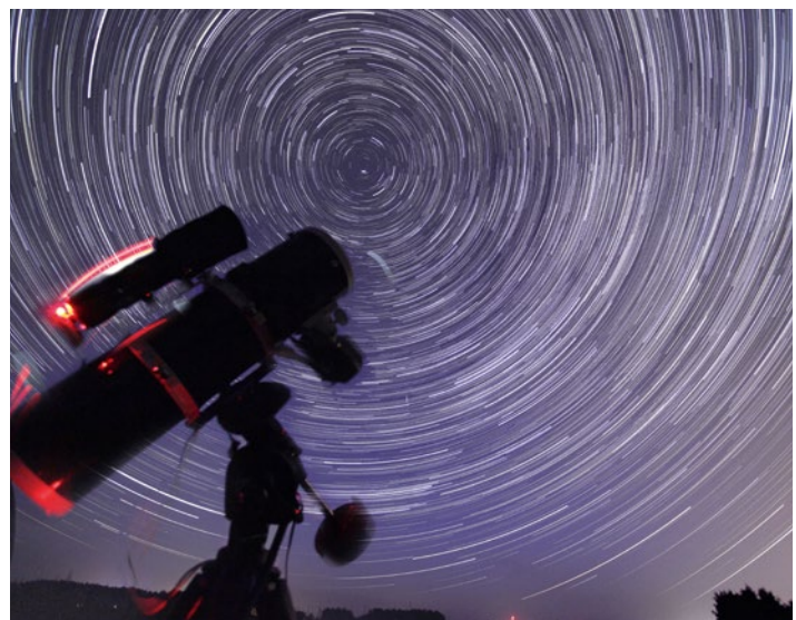
FOT. SZCZEPAN SKIBICKI

„Nocne podglądanie Wszechświata” będzie się zaczynać codziennie od 9 do 14 sierpnia o godz. 21 i potrwa do północy. Wstęp jest wolny.