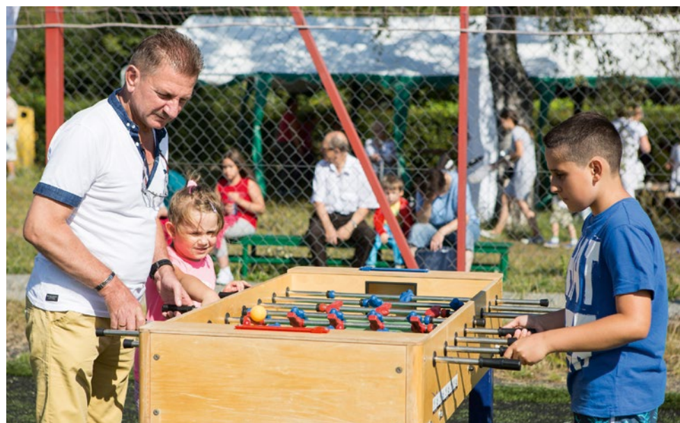
Czas spędzony wspólnie z dzieckiem to najlepsza inwestycja.

Wakacje zatem stwarzają możliwość wypoczynku nie tylko fizycznego, ale także tego psychicznego. Warto zadbać o siebie i najbliższych... nawet jeśli nie było to w wakacyjnych planach.