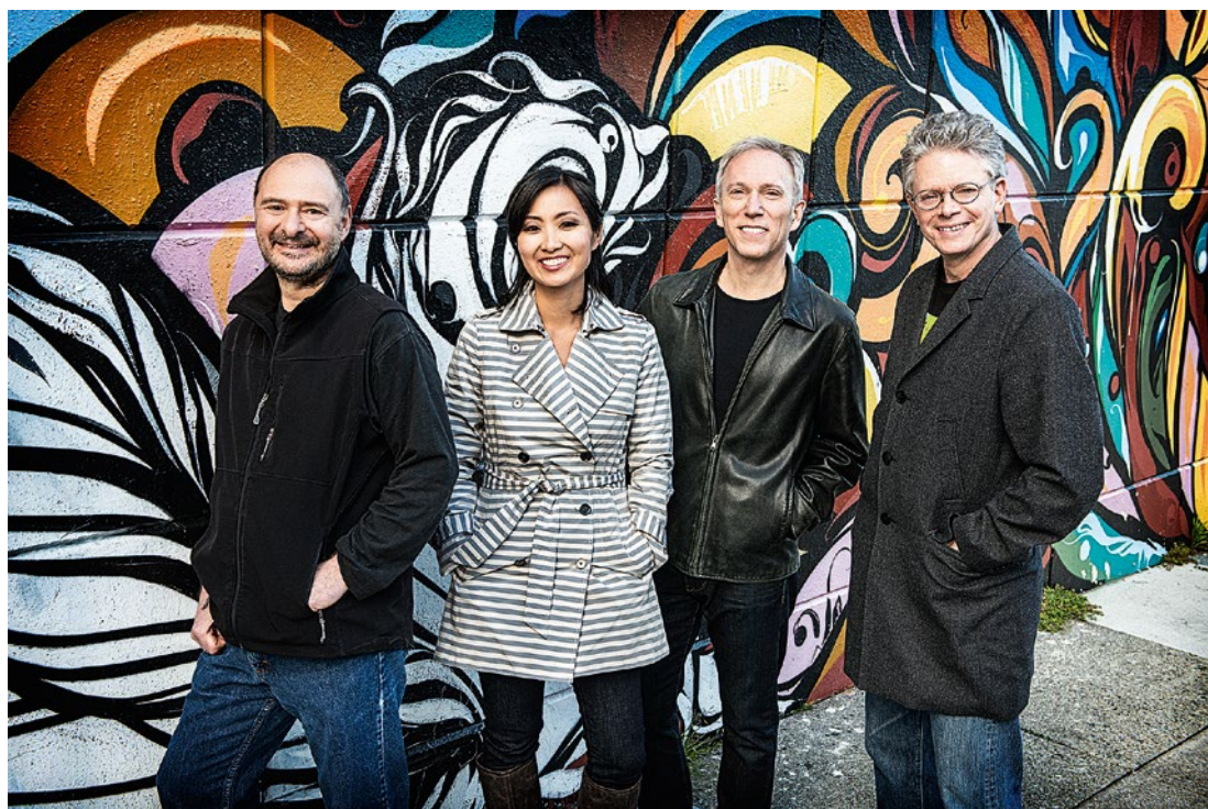
Jedną z gwiazd tegorocznej edycji festiwalu będzie zespół KRONOS QUARTET.