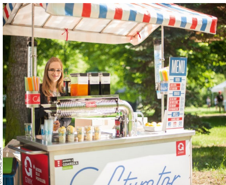
Saturator serwuje wodę samą lub z sokiem. Obie opcje są bezpłatne!