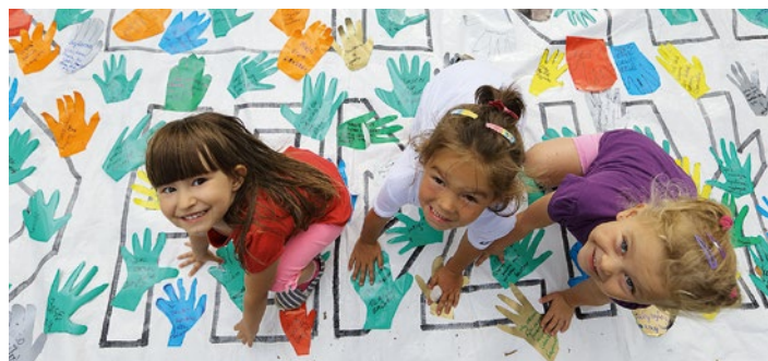
Razem można lepiej i więcej.

Same korzyści – atrakcyjnie spędzisz wolny czas, lepiej poznasz swoich sąsiadów, być może znajdziesz nowych przyjaciół. Już po raz 8 kolektywy aktywistów organizują w gdańskich dzielnicach społeczne obchody Sierpnia '80 pod wspólnym hasłem ZROZUMIEĆ SIERPIEŃ.