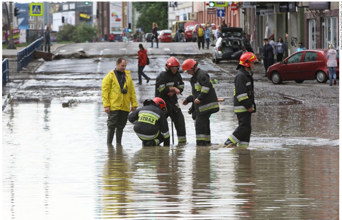
Usunięcie skutków ulewy trwało kilka dni.

W nocy z 14 na 15 lipca 2016 roku Gdańsk zmierzył się z szalejącym żywiołem. W ciągu 14 godzin na miasto spadała taka ilość deszczu, jaka w normalnej sytuacji odnotowywana jest w regionie w ciągu dwóch miesięcy (na metr kwadratowy spadło aż 160 litrów deszczu). Pamiętnej nocy miasto i jego mieszkańców przed ulewami deszczami ratowali pracownicy służb miejskich, którymi zarządzał Miejski Sztab Kryzysowy. W ciągu kilku godzin straż pożarna zarejestrowała prawie 500 interwencji , na ulicach miasta działało ponad 400 funkcjonariuszy policji wspomaganych przez strażników miejskich oraz pracowników innych służb, jak np. Gdańskich Melioracji. Przed bezwzględnym żywiołem swój dobytek ratowali też mieszkańcy. Najbardziej doświadczeni przez naturę zostali mieszkańcy Wrzeszcza. To oni też otrzymali od miasta największe