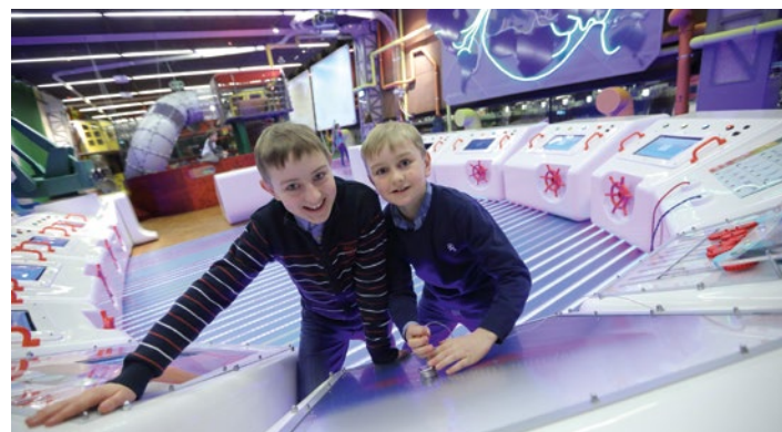
Dzieci uczą się zasad współpracy.

Bilety można kupić w kasie ECS z wyprzedzeniem, cena: 5 zł. (każde dziecko i opiekun) lub 2,5 zł. dla posiadaczy Karty Dużej Rodziny