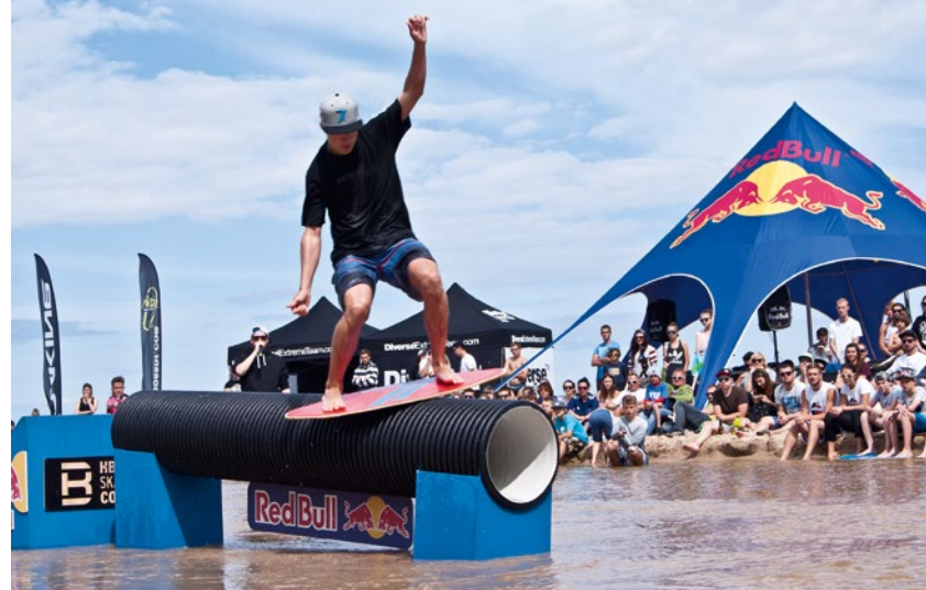
Skimboarding jest bardzo widowiskowy!