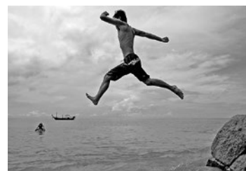
A czy Ty odważysz się skoczyć?

bogactwem, o którym mogą na razie tylko nieśmiało pomarzyć. Będziemy namawiali do innej niż zazwyczaj aktywności: wypożyczenie krwawego kryminału - jeśli przez całe życie czytaliśmy subtelny poezję, udział w warsztatach tanecznych - jeśli dotychczas w wolnych chwilach uprawialiśmy