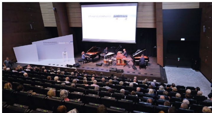
Wykłady gromadzą publiczność w różnym wieku.

miejsce: Europejskie Centrum Solidarności, wstęp wolny, rezerwacja miejsc: www.ecs.gda.pl 30 sierpnia, wtorek, godz. 18.00