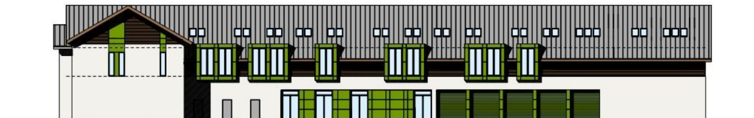
elewacja tylna 1:200

PRAWA AUTORSKIE ZASTRZEŻONE! Przedmiotowy projekt (dzieło architektoniczne) jest chroniony prawem autorskim zgodnie z art. 1 ustawy z dnia 4 lutego 1994 r. o prawie autorskim (Dz. U. Nr 24 poz. 84, wraz z późniejszymi zmianami)