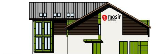
elewacja szczytowa 1:200