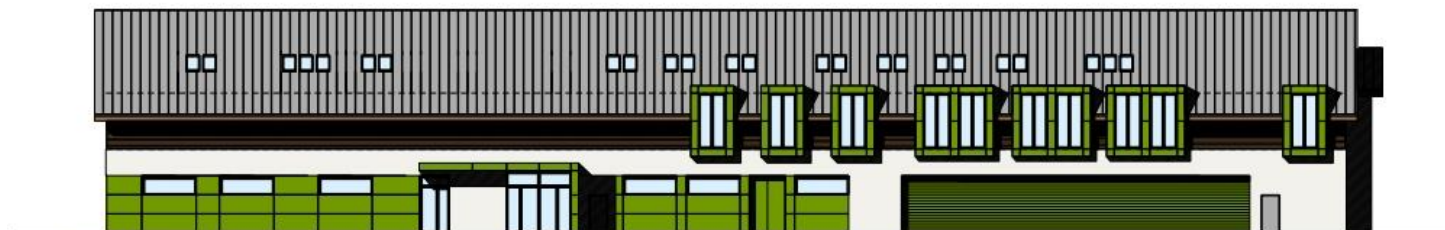
elewacja frontowa 1:200