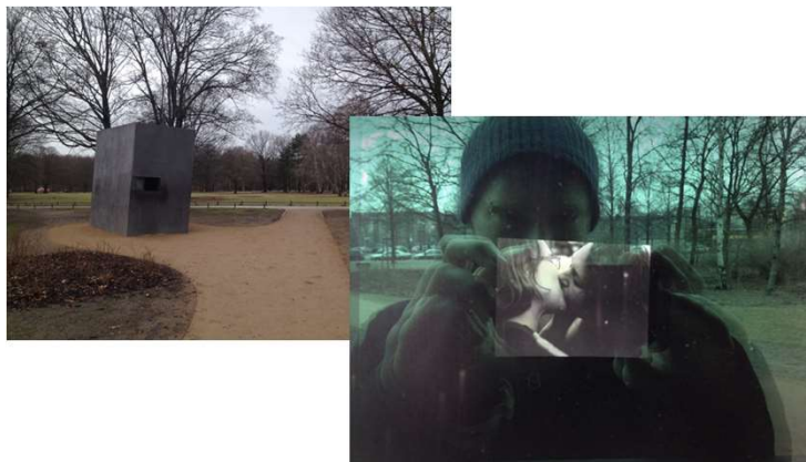
Denkmal für die im Nationalsozialismus verfolgten Homosexuellen(2008)