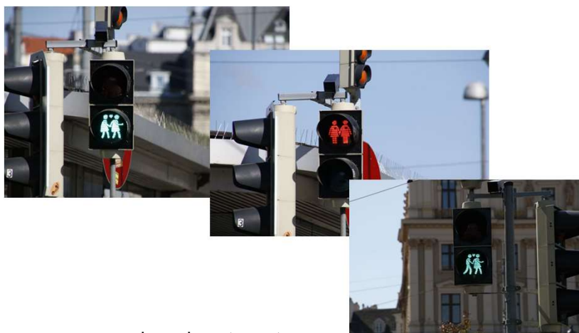
Wiener Ampelpärchen (2015)