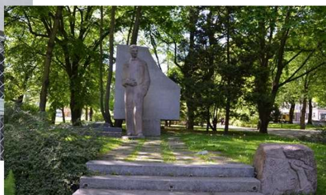
Pomnik Karola Szymanowskiego w Słupsku (1972)