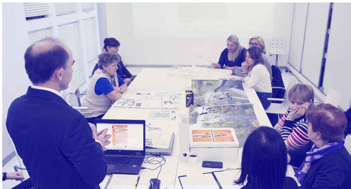
ryc. 11. Działania rewitalizacyjne - warsztaty w Nowym Porcie dotyczące wizji zagospodarowania dzielnicy

* w skali 5 punktowej, gdzie 1 oznacza bardzo źle, a 5 – bardzo dobrze