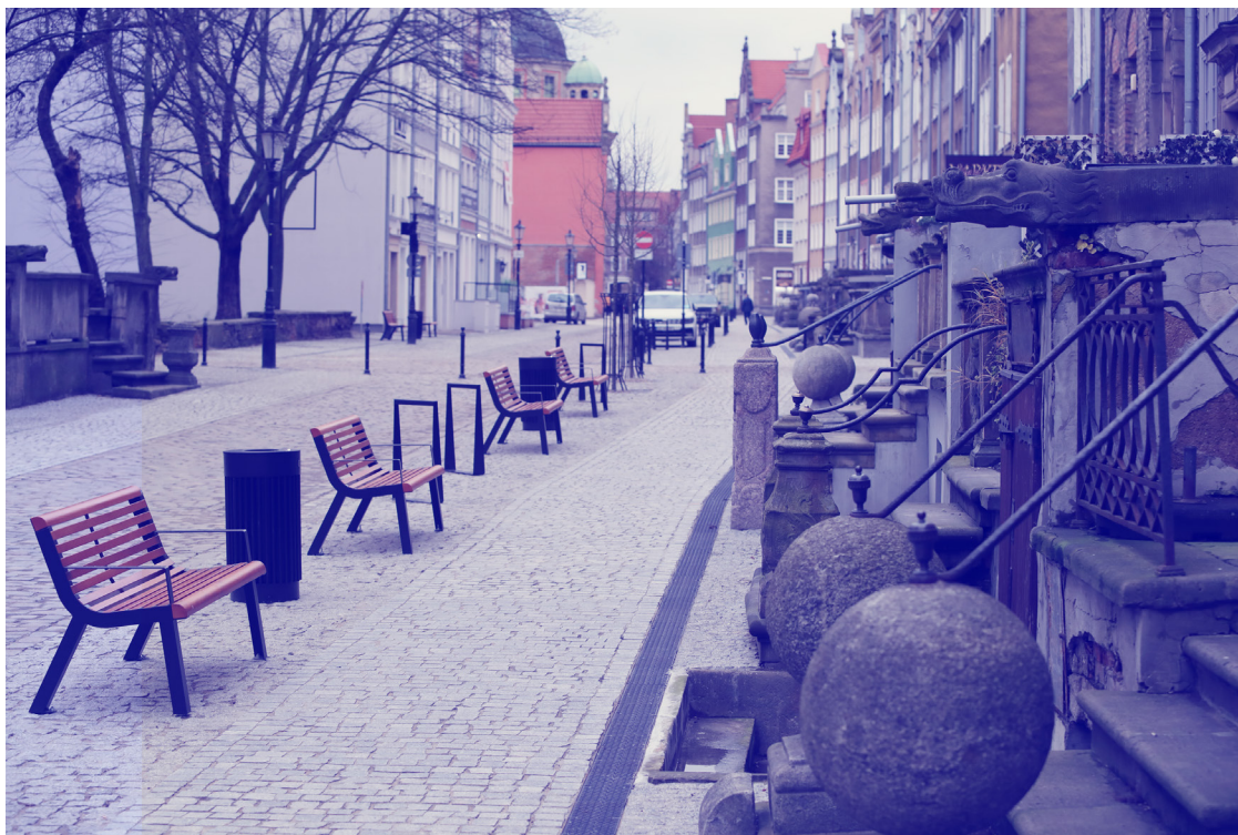
ryc. 2. Ulica Św. Ducha po remoncie; fot. Grzegorz Mehring / gdansk.pl

Wybrane przestrzenie i ulice historycznego Śródmieścia zostały odnowione według wyższych jakościowo standardów. Odnowione ulice i skwery stały się bardziej przyjazne i otwarte dla mieszkańców, przez co sprzyjają integracji społecznej i wzrostowi poczucia tożsamości . W 2017 r. w celu udostępnienia mieszkańcom bezpiecznej i estetycznej przestrzeni publicznej do spotkań i rekreacji wyłączono z ruchu kołowego ul. Grobla IV i ul. św. Ducha, a także rozpoczęto remont drugiej w wymienionych ulic. Zakończono II etap rewaloryzacji skweru przy ul. Szerokiej, polegający na zamontowaniu nawodnienia, nasadzeniach kwiatów, realizacji placu zabaw w otwartej przestrzeni miejskiej. Projekt zagospodarowania tej przestrzeni powstał przy szerokiej partycypacji mieszkańców. Dokończono rewaloryzację ul. Stągiewnej przez umeblowanie jej w ramach konkursu Lech Starter. Ulica w nowej odsłonie uzyskała nagrodę w konkursie Najlepsza Przestrzeń Publiczna Województwa Pomorskiego 2017 r.