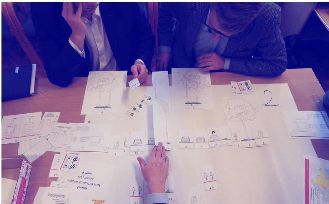
ryc. 9. Konsultacje dotyczące założeń Gdańskiego Standardu Ulicy Miejskiej; fot. Biuro Rozwoju Gdańska