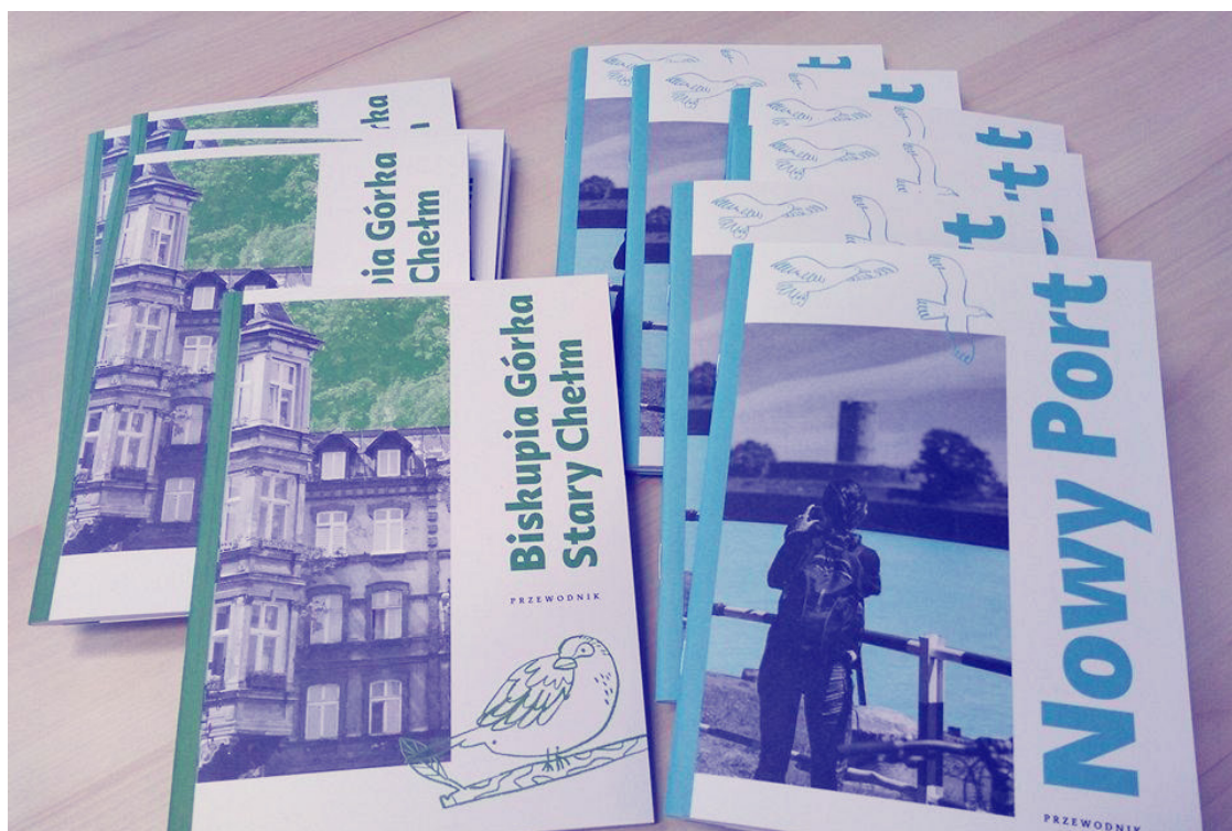
ryc. 10. Przewodniki po zrewitalizowanych dzielnicach Gdańska