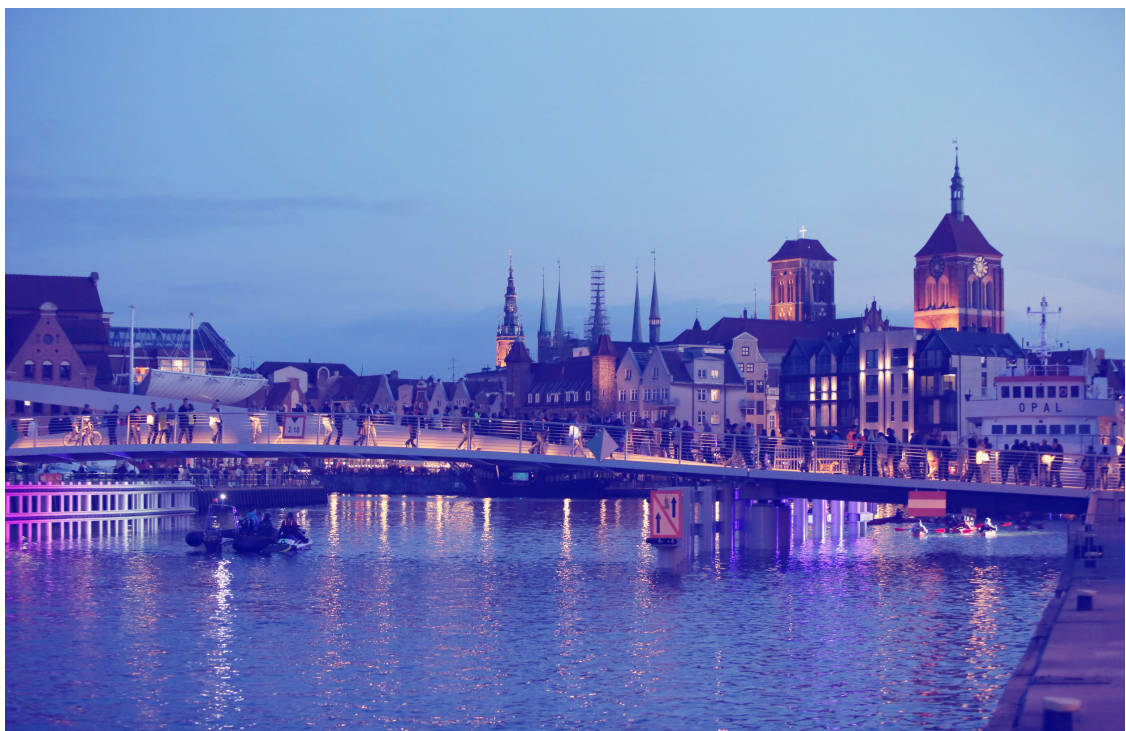
ryc. 6. Kładka dla pieszych; fot. Grzegorz Mehring / gdansk.pl