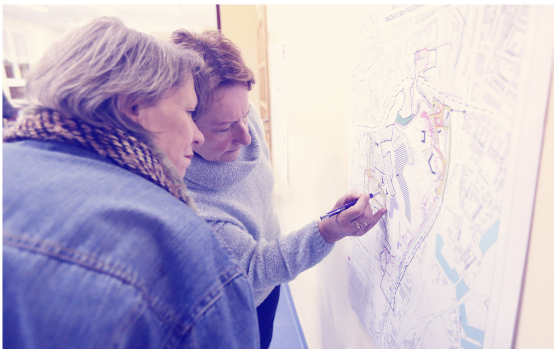
ryc. 1. Konsultacje w sprawie rewitalizacji dla obszaru Biskupia Górka / Stary Chełm

W 2017 r. uchwalono Gminny Program Rewitalizacji dla czterech obszarów: Biskupia Górka / Stary Chełm, Orunia, Dolne Miasto / Plac Wałowy / Stare Przedmieście oraz Nowy Port z Twierdzą Wisłoujście. W ten sposób otwarto kolejny wieloletni, interdyscyplinarny i zintegrowany proces rewitalizacji w Gdańsku. Dokument stanowi element zrównoważonej polityki miejskiej warunkującej uzyskanie trwałej poprawy jakości życia mieszkańców w obszarach wymagających wsparcia. W ramach Gminnego Programu Rewitalizacji – poza działaniami na rzecz społeczności lokalnych obszarów rewitalizacji, takich jak konkurs dla organizacji pozarządowych, mający na celu realizację kompleksowych działań społecznych w obszarach rewitalizacji (animacje społeczno-kulturalne oraz aktywizacja społeczności i pomoc mieszkańcom) – jest realizowanych wiele działań inwestycyjnych , takich jak: remonty dróg wraz z infrastrukturą towarzyszącą, zagospodarowanie przestrzeni publicznych, adaptacja lokali na cele społeczne i modernizacja budynków mieszkalnych. W celu realizacji remontów budynków i niezbędnych adaptacji w 2017 r. odbyły się nabór oraz podpisanie umów z partnerami (127 wspólnot i spółdzielni mieszkaniowych). Powyższe działania finansowane są m.in. ze środków Europejskiego Funduszu Rozwoju Regionalnego w ramach Regionalnego Programu Operacyjnego dla Województwa Pomorskiego na lata 2014–2020.