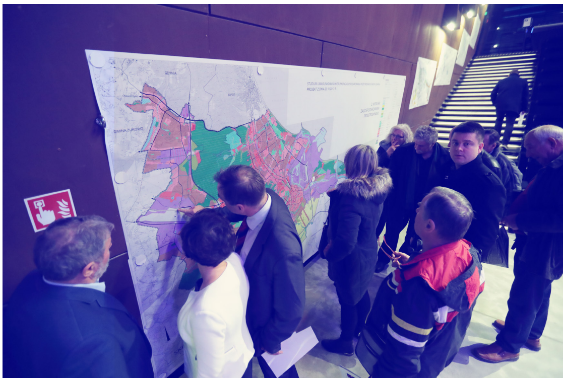
ryc. 4. Dyskusja publiczna nad projektem Studium Uwarunkowań i Kierunków Zagospodarowania Przestrzennego Miasta Gdańska