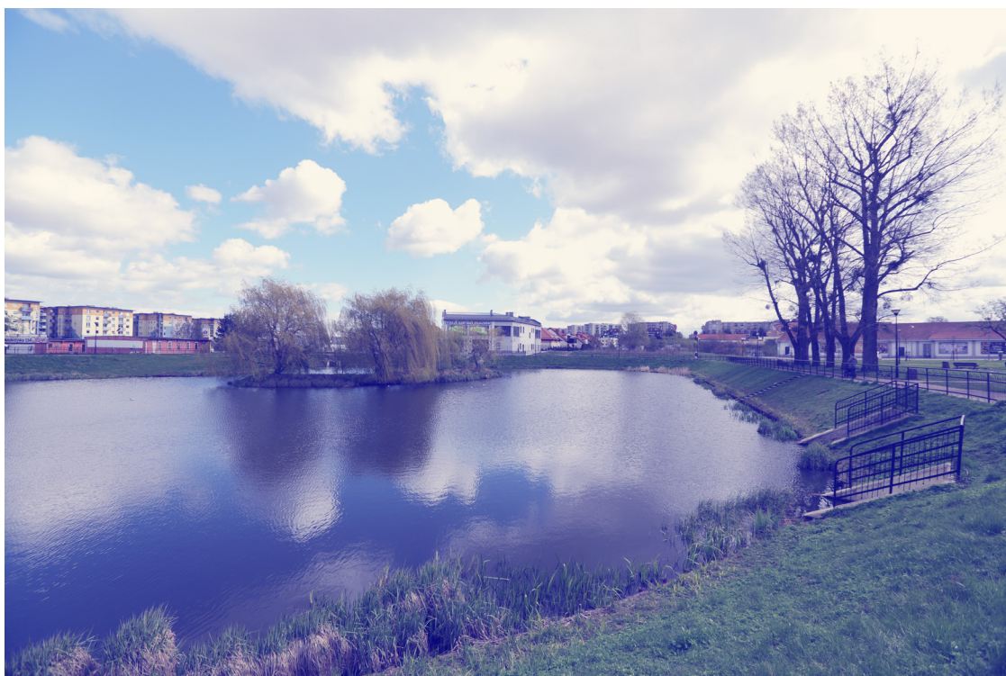
ryc. 3. Zbiornik Retencyjny Platynowa

Trwają prace nad tworzeniem Gdańskiej Polityki Wodnej, która powstaje na podstawie analiz terenów nadwodnych pod względem wykorzystania walorów ich położenia. Dokument określa kierunki rozwoju przestrzeni, takich jak bulwary spacerowe i ciągi piesze wraz z sąsiedztwem. Opracowanie docelowo określi przeznaczenie terenów nadwodnych oraz będzie stanowiło podstawę do zmian planów zagospodarowania przestrzennego. Jednocześnie wytyczne te będą stanowiły materiał wyjściowy do projektów realizowanych przez Miasto (m.in. Budżet Obywatelski) i działań jednostek miejskich, takich jak Gdański Zarząd Dróg i Zieleni (GZDiZ), Dyrekcja Rozbudowy Miasta Gdańska (DRMG), Gdański Ośrodek Sportu (GOS) itp. Dodatkowo w 2017 r. został powołany, zarządzeniem Prezydenta Miasta Gdańska, Zespół ds. wdrożenia strategii zarządzania wodą na terenie Gminy Miasta Gdańska, który jest odpowiedzialny za wprowadzenie zintegrowanych działań na rzecz poprawy bezpieczeństwa lokalnej społeczności, przestrzeni i gospodarki. W 2018 r. Gdańska Polityka Wodna otrzymała wyróżnienie w kategorii "Idea", w konkursie im. Jerzego Regulskiego organizowanym przez Dziennik Rzeczpospolita.