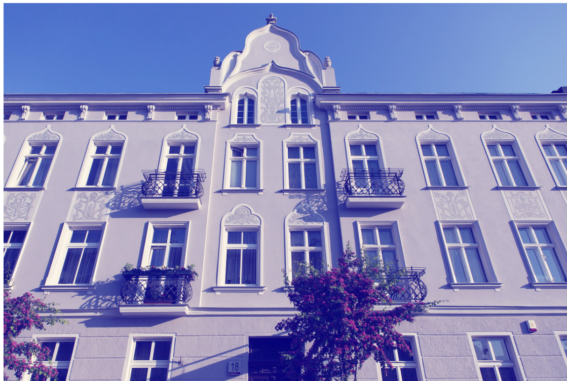
ryc. 7. Odnowiona elewacja kamienicy przy u. Wajdeloty 18; fot. Jerzy Pinkas / gdansk.pl