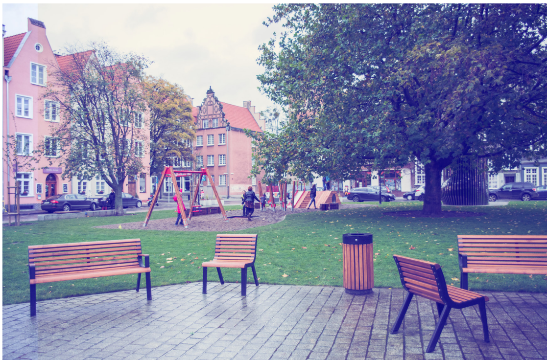
ryc. 8. Skwer przy Placu Świętopełka; fot. Dominik Paszliński / gdansk.pl