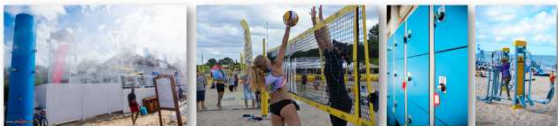
Gdański Ośrodek Sportu