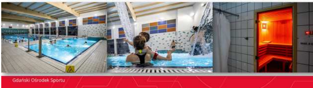
Gdański Ośrodek Sportu