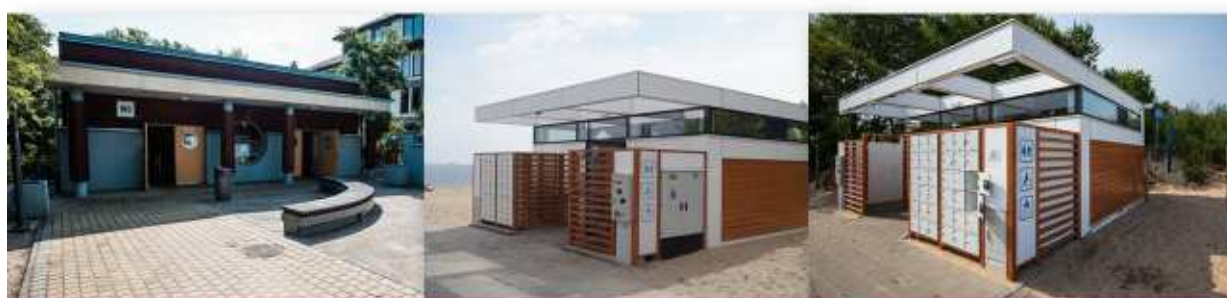
Gdańskie Ośrodek Sportu

Powstaje też Gdański stadion letni, który będzie miał nazwę Lotos Stadion Letni. Jest to umowa podpisana z dzierżawcą na okres 10-letni do 2027 roku. Jest to popularne miejsce spotkań gdańszczan. Są to rozgrywki w najwyższej klasie rozgrywkowej w piłce siatkowej, w piłce ręcznej, w piłce nożnej, puchar Polski, mistrzostwa Polski, szereg innych dyscyplin, strongmeni będą tam się spotyka, a także turnieje i animacje dla dzieci i młodzieży oraz turnieje ogólnodostępne.