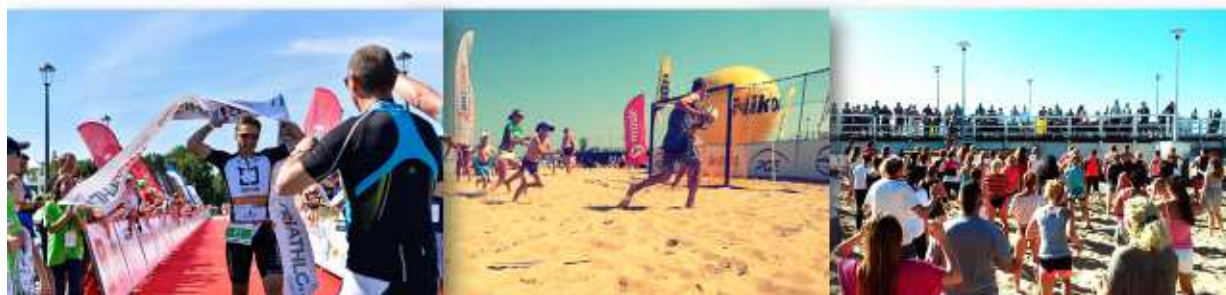
Gdański Ośrodek Sportu