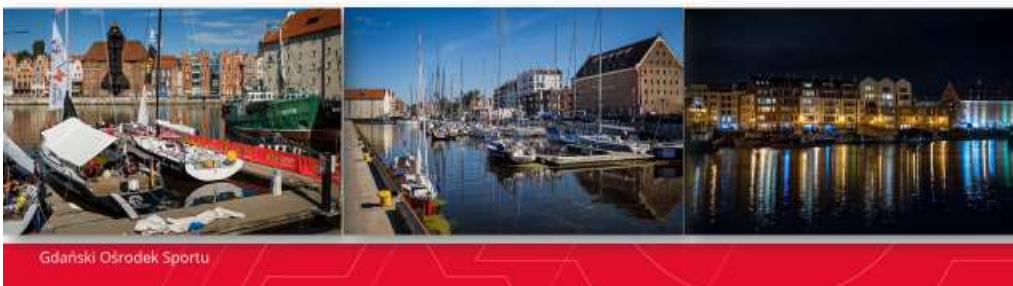
Gdański Ośrodek Sportu