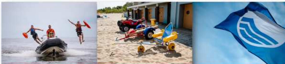
Gdańskie Centrum Sportu