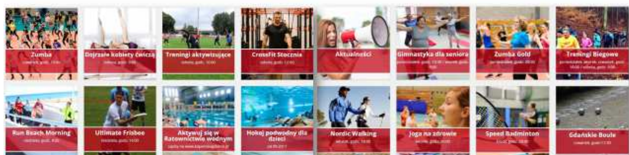
Gdański Ośrodek Sportu

Pływalnie miejskie w tym roku, ponieważ zarządzamy 4 pływalniami prowadzimy je w takim cyklu rotacyjnym. Będziemy je remontować, czyli robić ten sezon konserwacyjny, ponieważ obiekt musi być konserwowany i rotacyjnie te pływalnie będą wyłączane i damy szansę mieszkańcom przez całe lato dostępu do obiektów, aby nie wszystkie były jednocześnie zamknięte. Marina Gdańsk jest przygotowana do sezonu. Wyzwaniem dla nas będzie na pewno usunięcie jachtu, który już niemal trzeci rok nam zalega w marinie, ale o tym jeszcze za chwilę powiem.