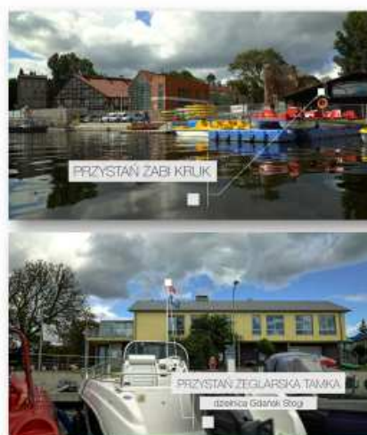
PRYZYSTAŃ ŻABI KRUK