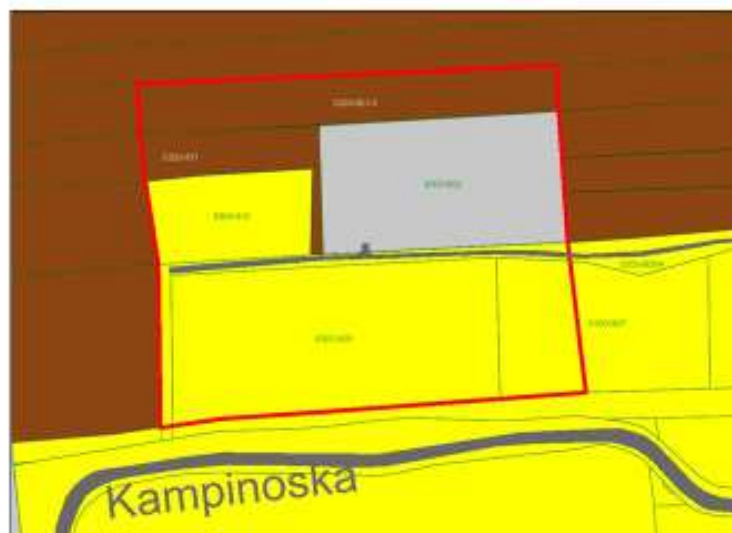
struktura własności - projektowany obszar Natura 2000 Zbiornik na Oruni PLH220106