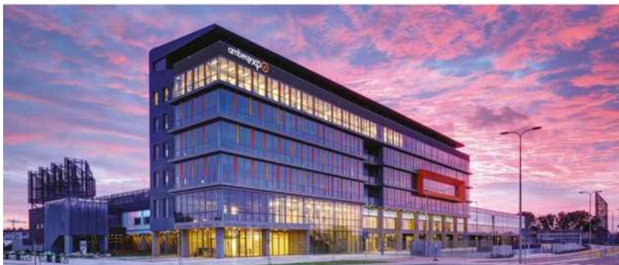
Międzynarodowe Targi Gdańskie S.A