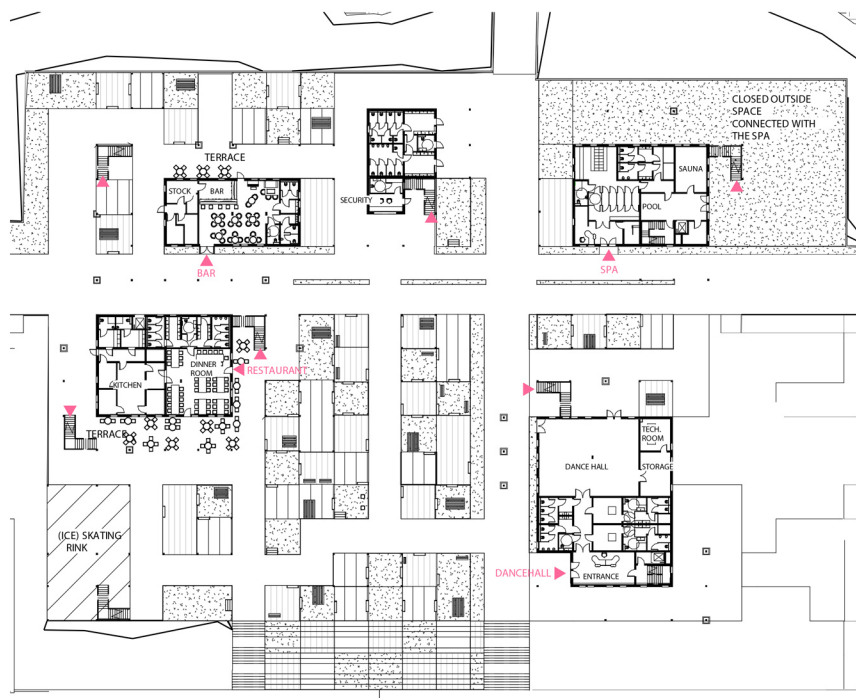
RZUT PATRERU 1:500