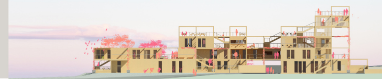
FASADA WSCHODNIA 1:500