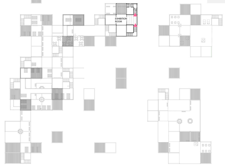
RZUT CZWARTEGO PIĘTRA 1:500