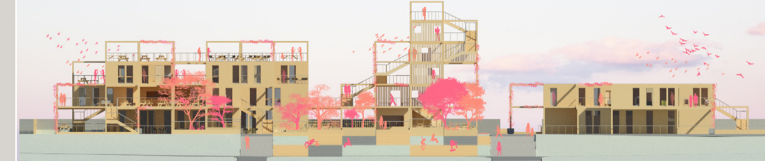
FASADA POŁUDNIOWA 1:500