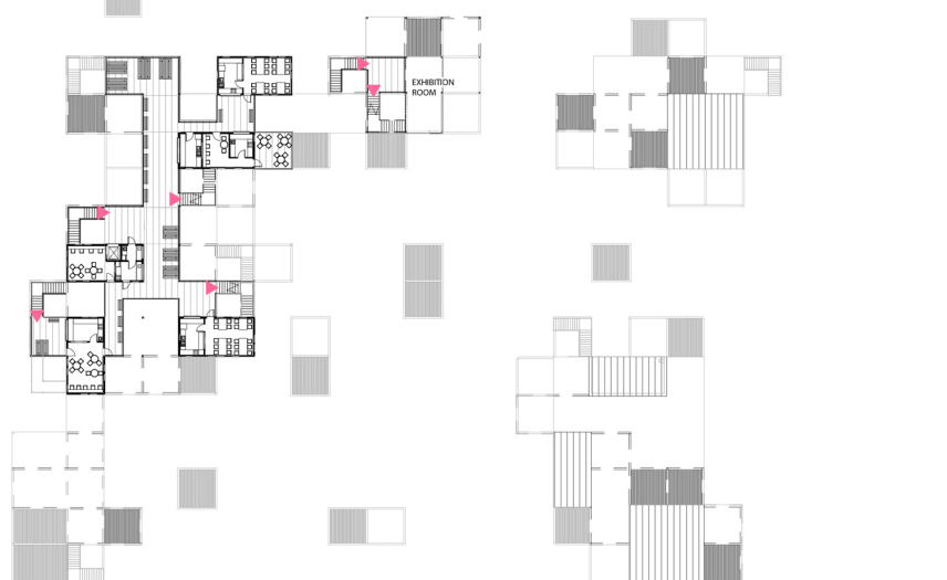
RZUT DRUGIEGO PIĘTRA 1:500