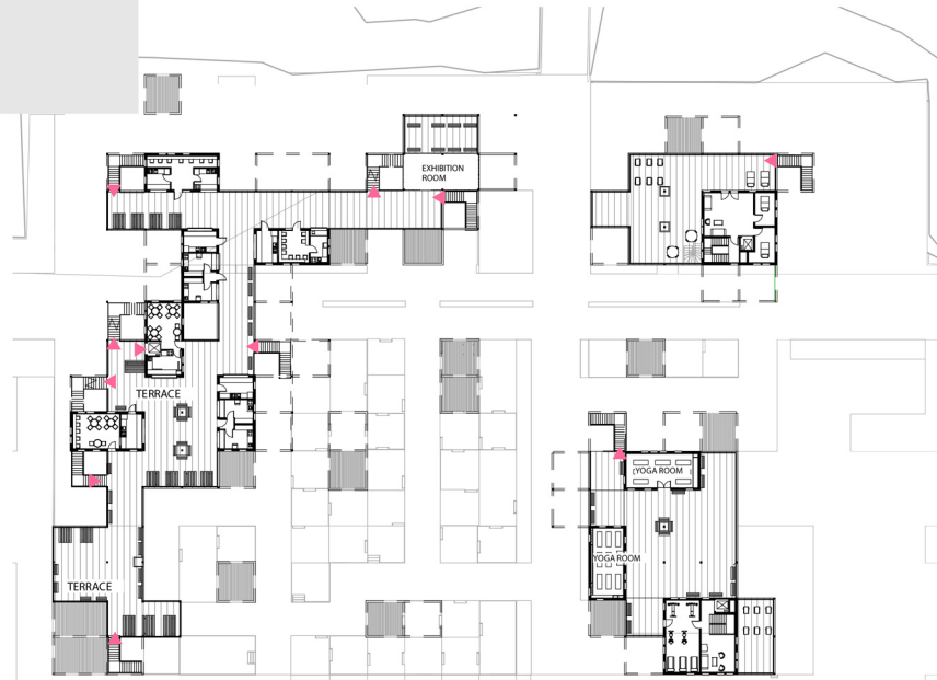
RZUT PIERWSZEGO PIĘTRA 1:500