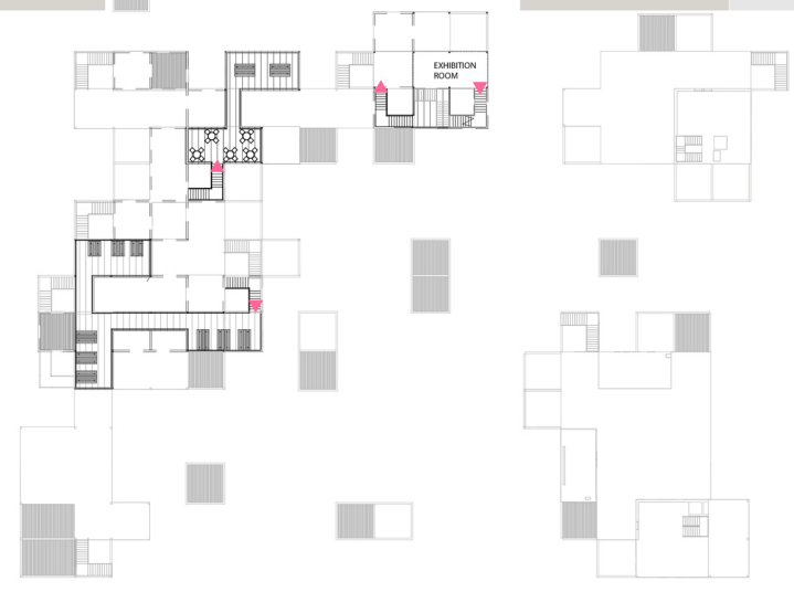
RZUT TRZECIEGO PIĘTRA 1:500