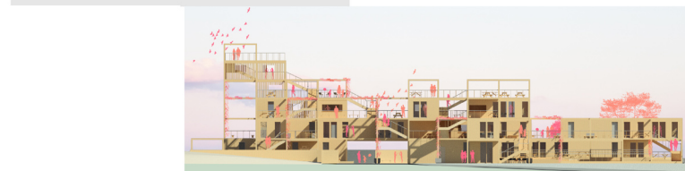
FASADA ZACHODNIA 1:500