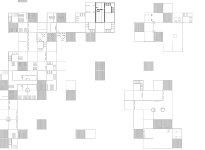
RZUT PIĄTEGO PIĘTRA 1:500