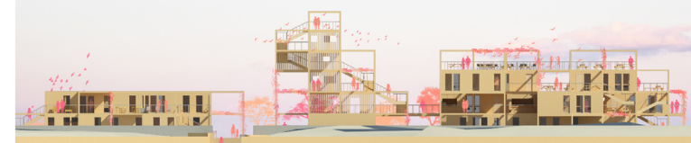
FASADA PÓLNOCNA 1:500