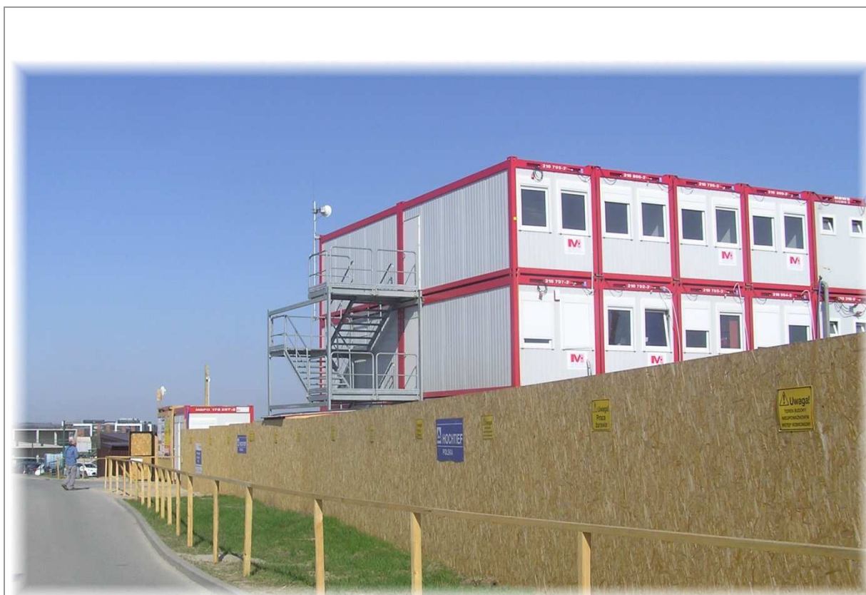
Fot. 1. OM Gdańsk / ul. Słowackiego 175 – widok anteny linii radiowej na dachu budynku